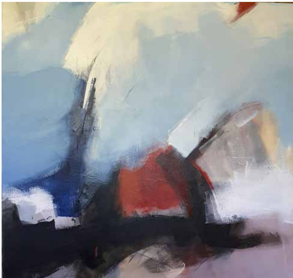
2. Sem título, 2015/16 Acrílico s/ tela, 100x100 cm