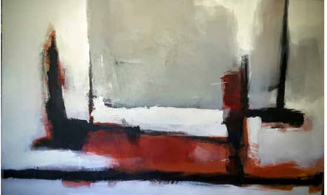
20. Sem título, 2015/16 Acrílico s/ tela, 100x150 cm