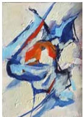
28 a 36. Sem título, 2015/16 Acrílico s/ papel-tela, 10x15 cm