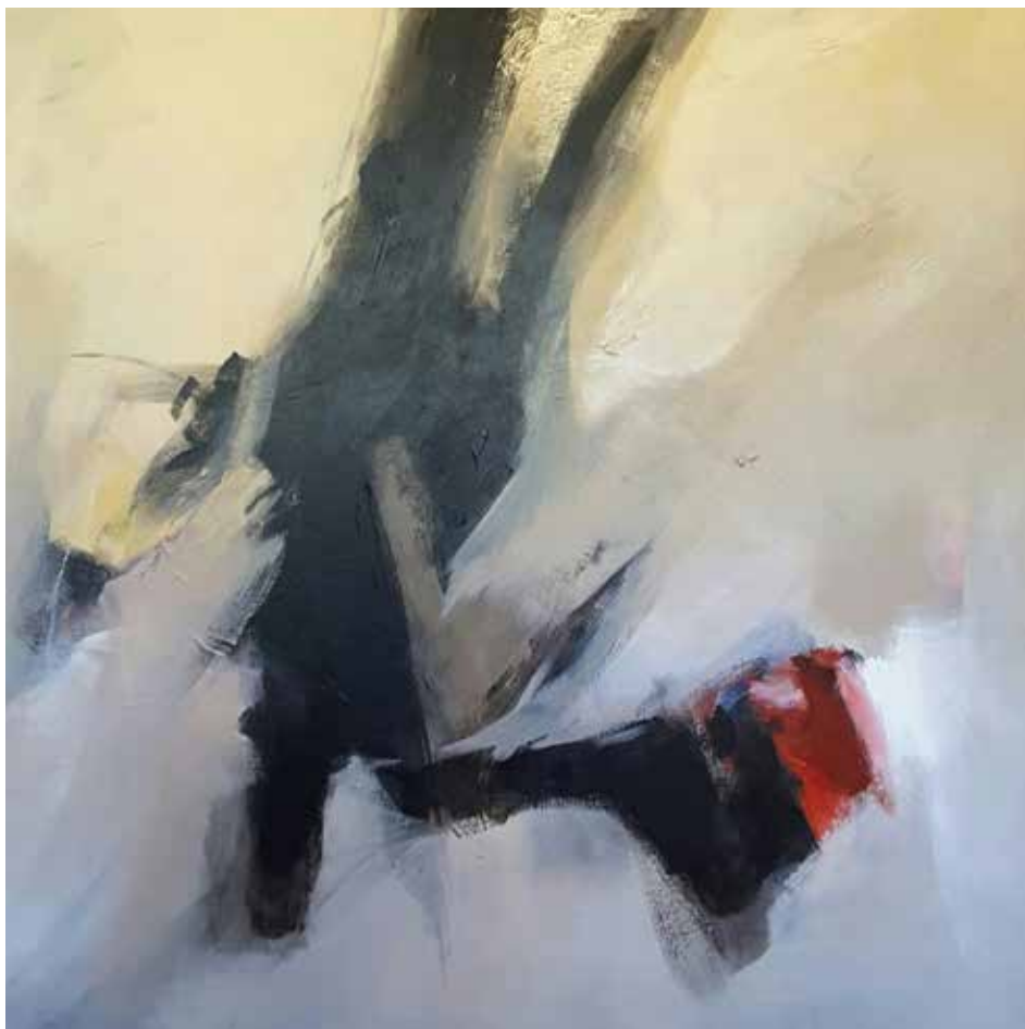
19. Sem título, 2015/16 Acrílico s/ tela, 100x100 cm