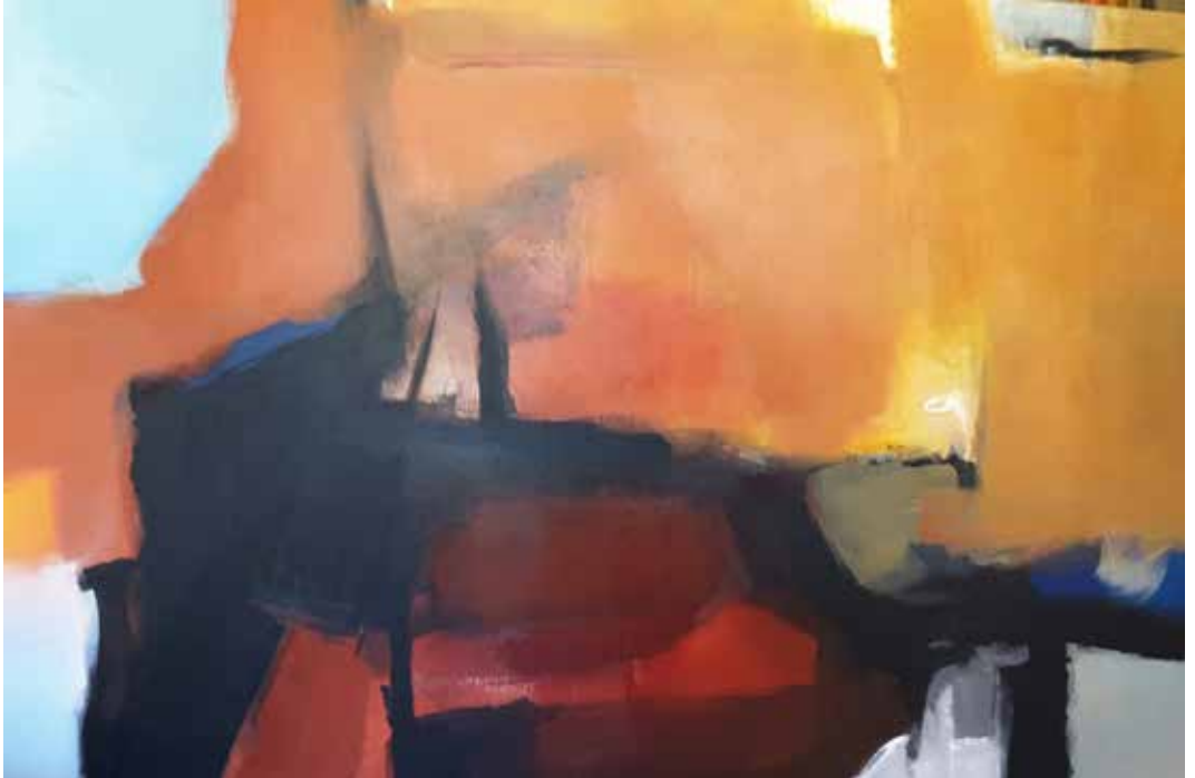
4. Sem título, 2015/16 Acrílico s/ tela, 100x150 cm