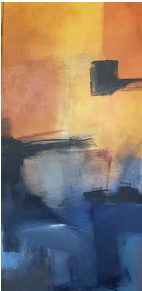
25 / 26. Sem título, 2015/16 Acrílico s/ tela, 100x50 cm