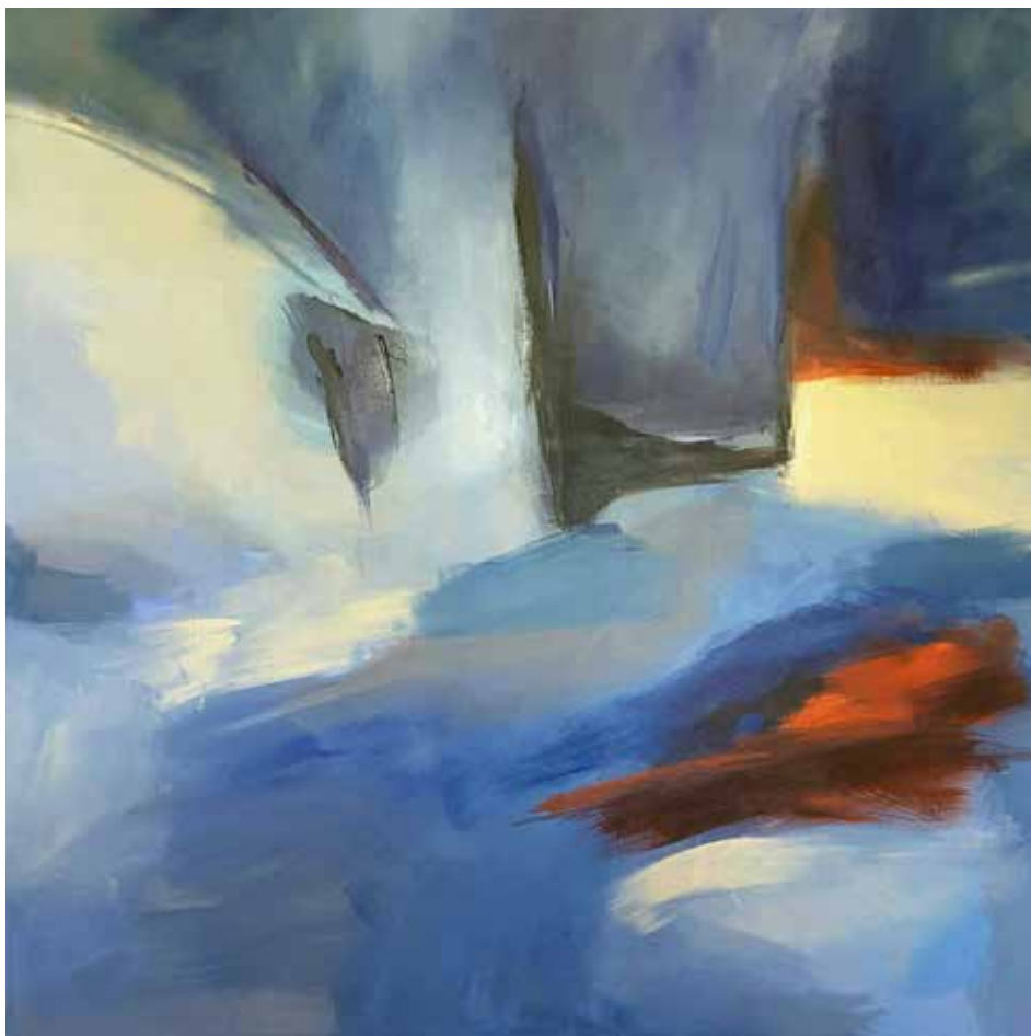
16. Sem título, 2015/16 Acrílico s/ tela, 100x100 cm