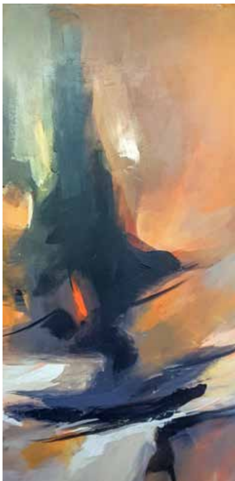
21 / 22. Sem título, 2015/16 Acrílico s/ tela, 100x50 cm