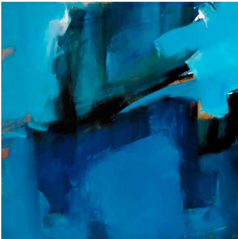
15. Sem título, 2015/16 Acrílico s/ tela, 100x100 cm