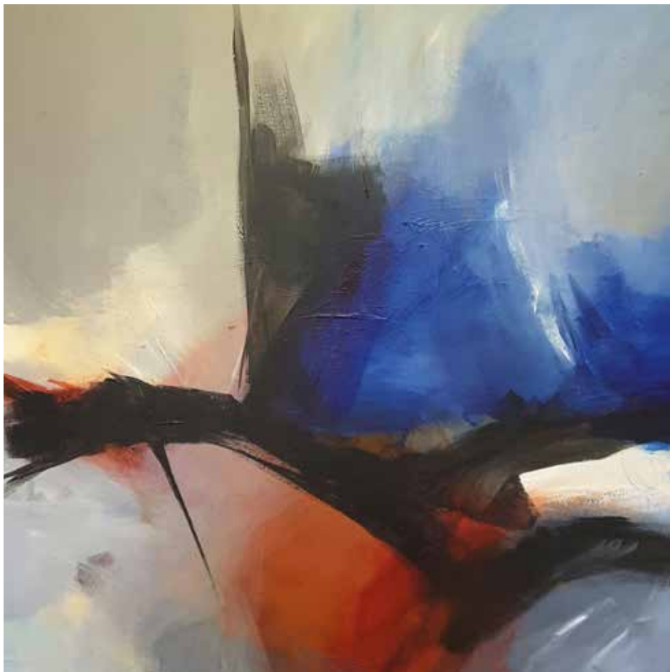
17. Sem título, 2015/16 Acrílico s/ tela, 100x100 cm