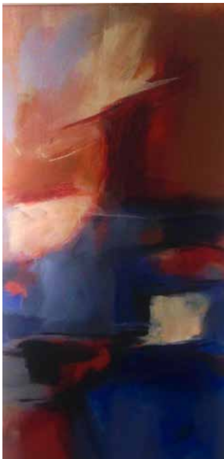
23 / 24. Sem título, 2015/16 Acrílico s/ tela, 100x50 cm