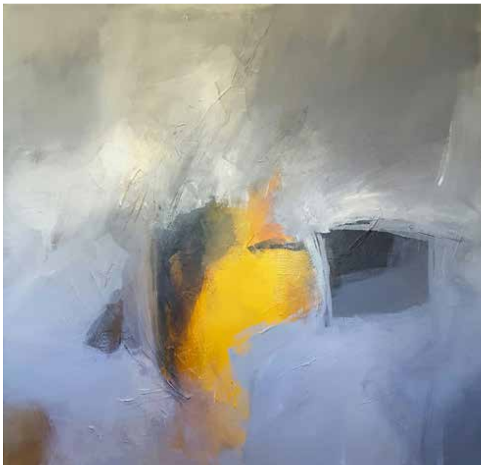
1. Sem título, 2015/16 Acrílico s/ tela, 100x100 cm