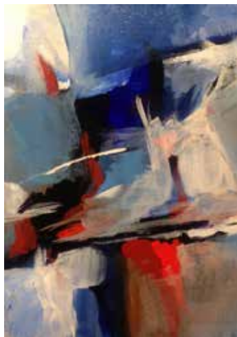
5 a 14. Sem título, 2015/16 Acrílico s/ tela, 18x24 cm