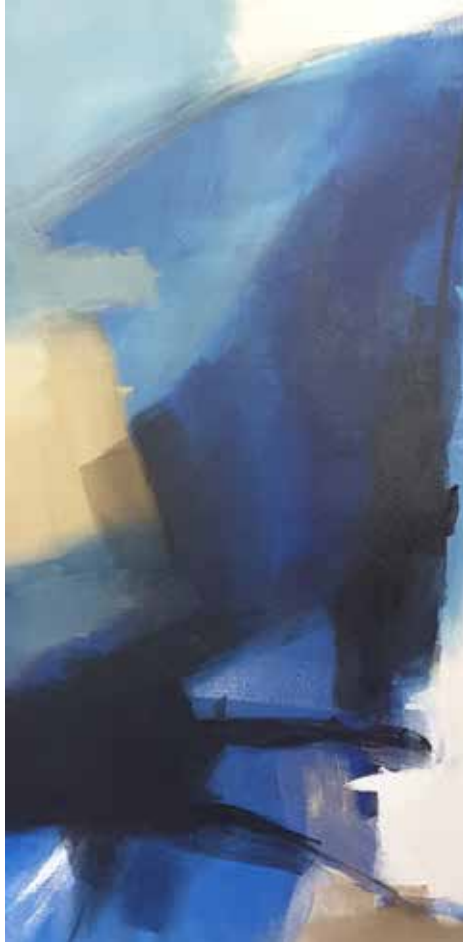
27. Sem título, 2015/16 Acrílico s/ tela, 100x50 cm