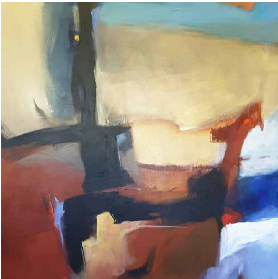
18. Sem título, 2015/16 Acrílico s/ tela, 100x100 cm