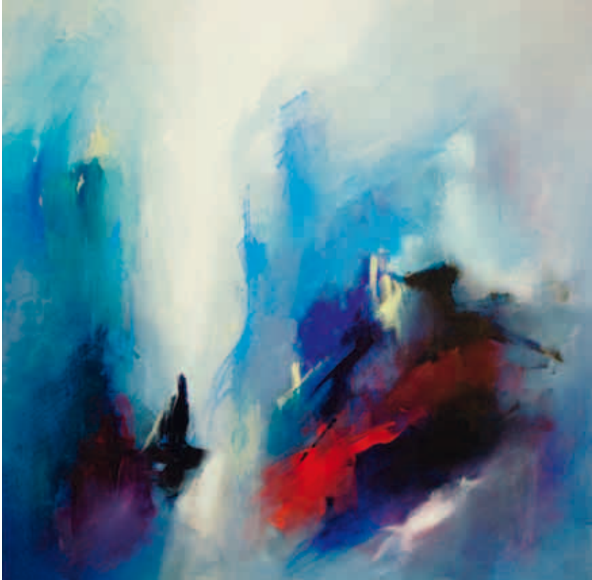
6. Sem Título, 2010 Técnica mista s/ tela 140x140 cm