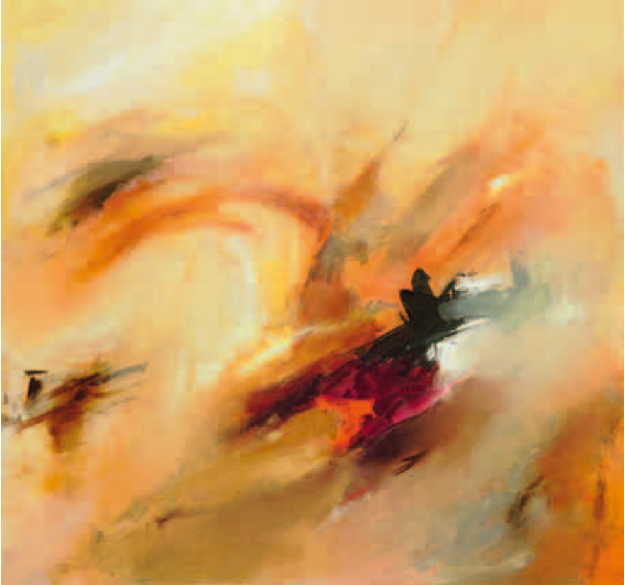
1. Sem Título, 2010 Técnica mista s/ tela 140x140 cm