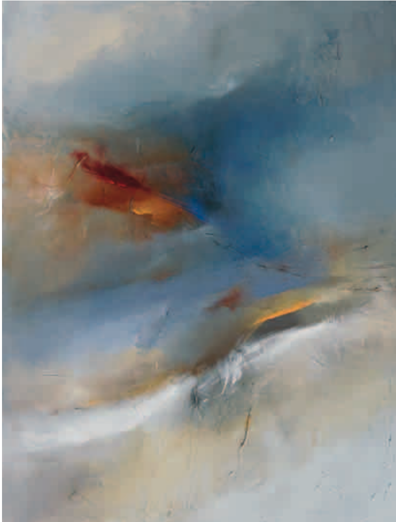
3. Sem Título, 2010 Técnica mista s/ tela 170x130 cm