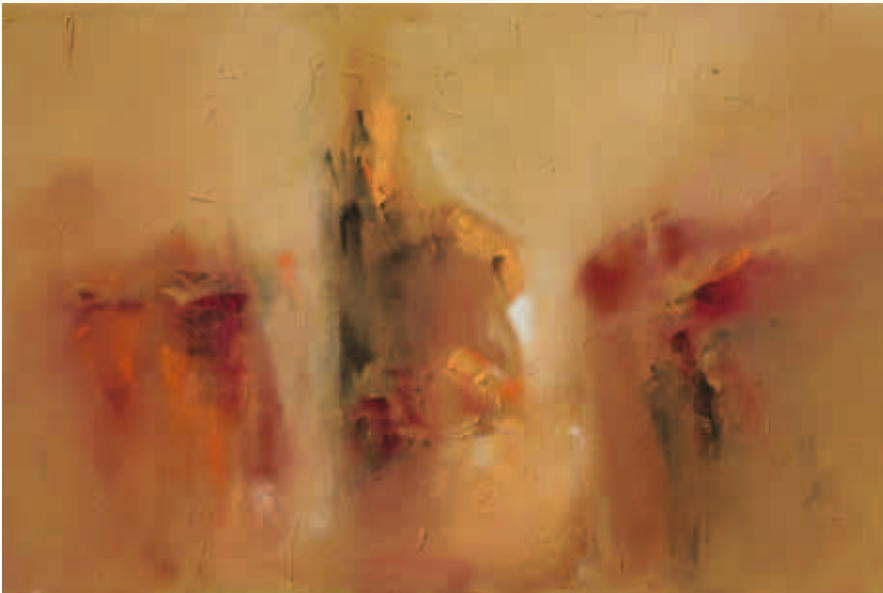
2. Sem Título, 2010 Técnica mista s/ tela 80x120 cm