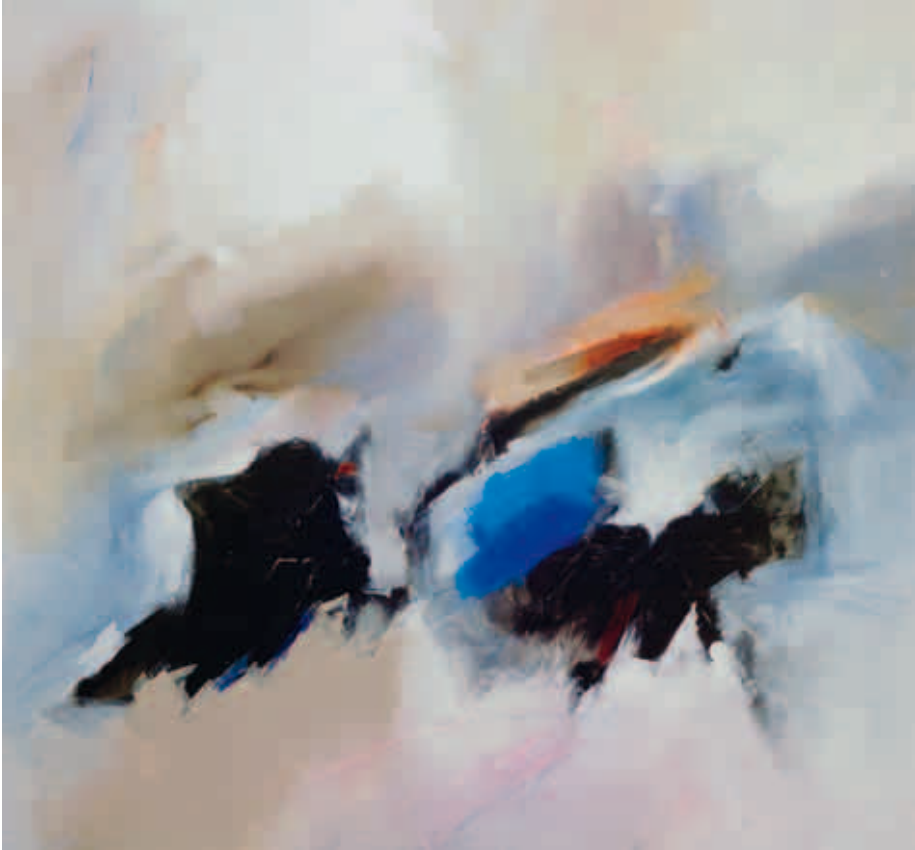
4. Sem Título, 2010 Técnica mista s/ tela 150x150 cm