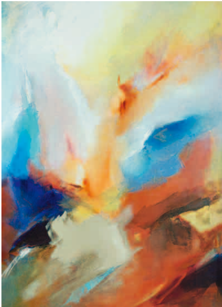
8. Sem Título, 2010 Técnica mista s/ tela 170x130 cm