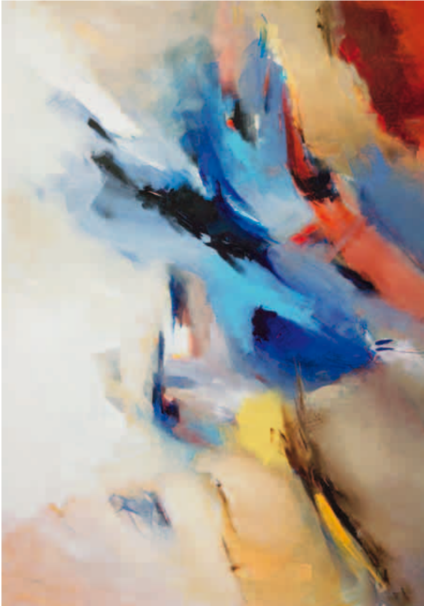
5. Sem Título, 2010 Técnica mista s/ tela 150x200 cm