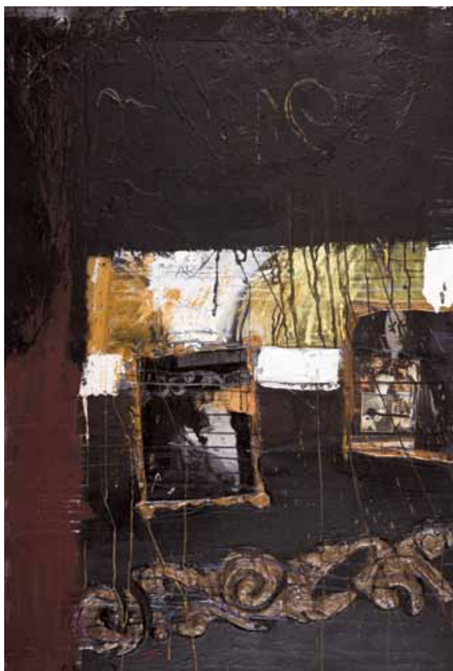
5. S/ título , 2011/12

Técnica mista s/ tela e madeira, 125x85cm