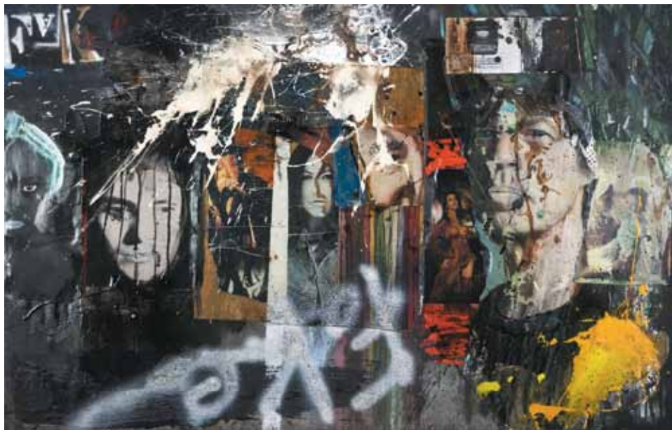
13. Fake , 2012

Técnica mista s/ tela e madeira, 85x125 cm