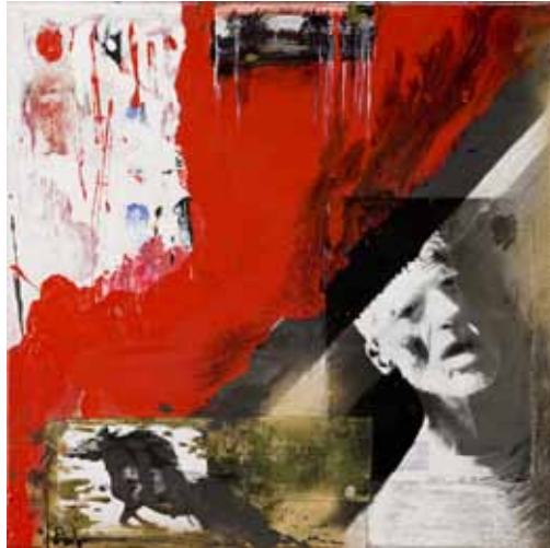
29. Viagem , 2012

Técnica mista s/ tela e madeira, 65x65 cm