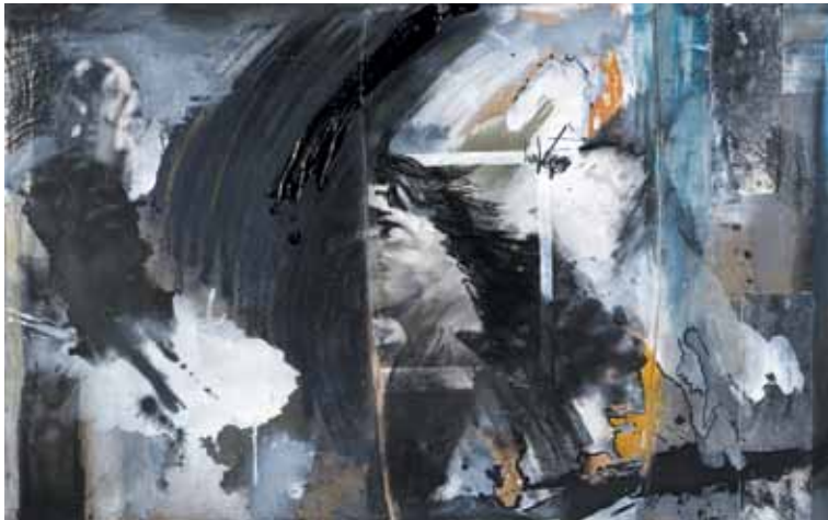
27. A rapariga de Richter II , 2012 Técnica mista s/ tela e madeira, 65x100 cm