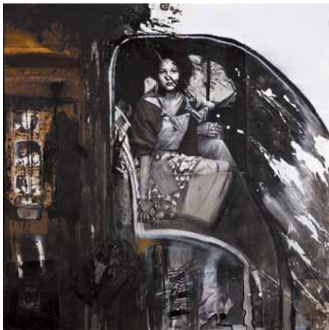
17. Anda! , 2012

Técnica mista s/ tela e madeira, 100x100 cm