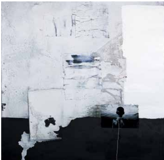
15. O quadro branco , 2011/12 Técnica mista s/ tela e madeira, 100x100 cm