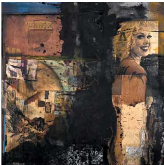
18. White Goddess , 2011

Técnica mista s/ tela e madeira, 100x100 cm