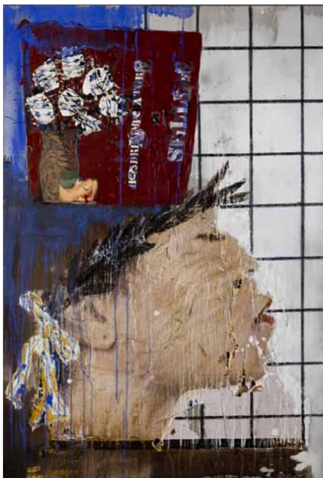
3. Jimi e jarra de flores , 2012

Técnica mista s/ tela e madeira, 125x85 cm