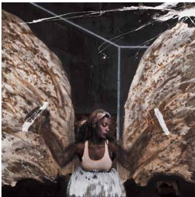
16. Tempo de zarpar , 2011/12 Técnica mista s/ tela, 100x100 cm