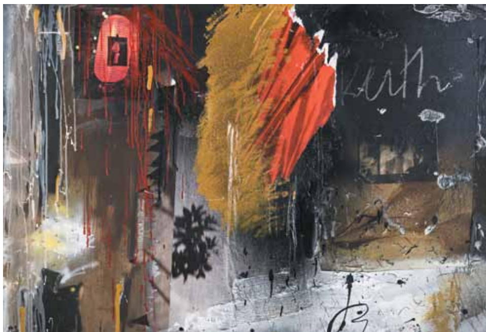
12. Keith / Tokyo , 2012

Técnica mista s/ tela e madeira, 85x125 cm