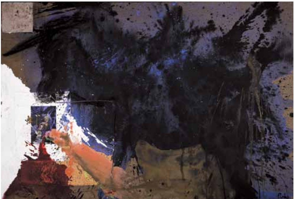
11. Touro e toureiro , 2011

Técnica mista s/ tela e madeira, 85x125 cm