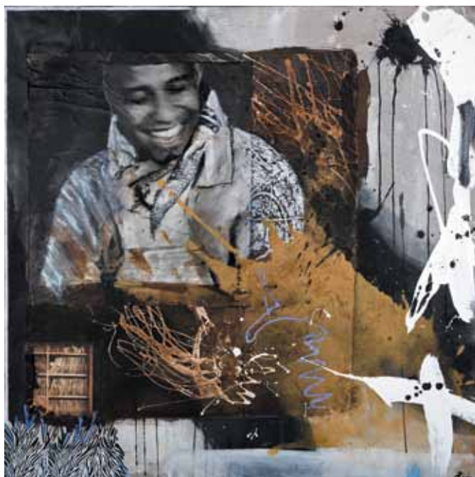
20. S/ título , 2011/12

Técnica mista s/ tela e madeira, 100x100 cm