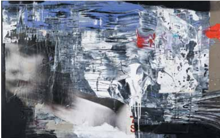
26. A rapariga de Richter I , 2012 Técnica mista s/ tela e madeira, 65x100 cm