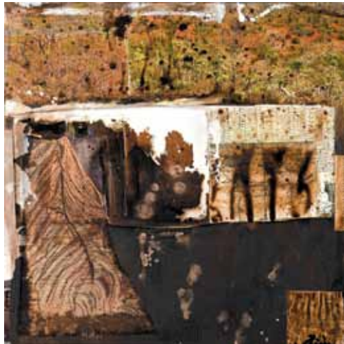
30. La Connaissance , 2012

Técnica mista s/ tela e madeira, 65x65 cm