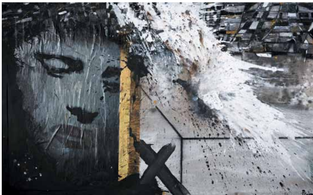
24. Mais outra Amália , 2011

Técnica mista s/ tela e madeira, 100x160 cm