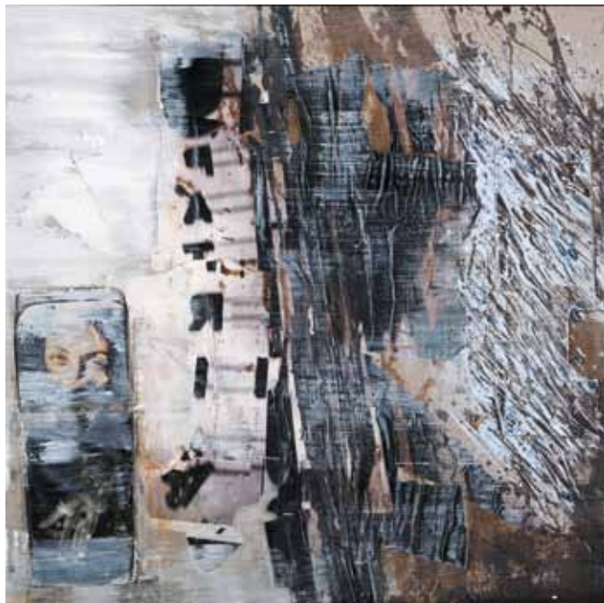
21. Pátria (azul) , 2012

Técnica mista s/ tela e madeira, 100x100 cm