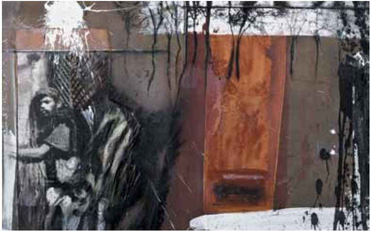
28. A janela de Mark , 2011

Técnica mista s/ tela e madeira, 65x100 cm