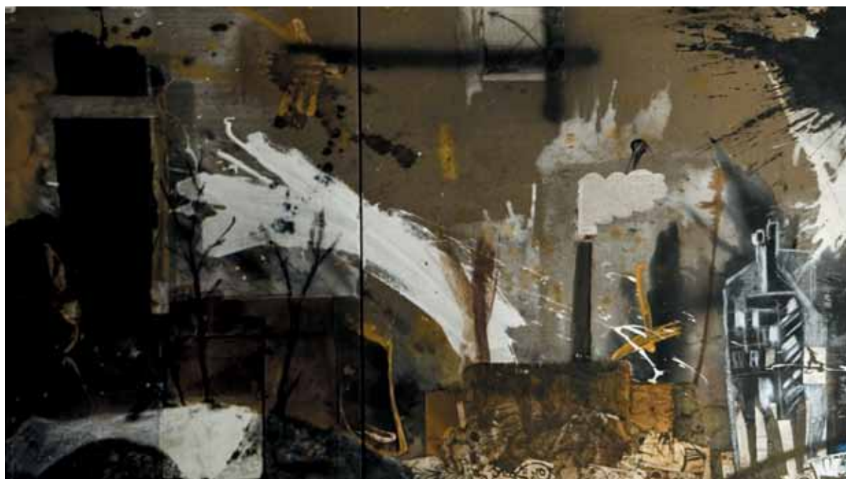
14. St. Petersburg encontra o Rio , 2011/12 Técnica mista s/ tela e madeira, Políptico: 100x330 cm