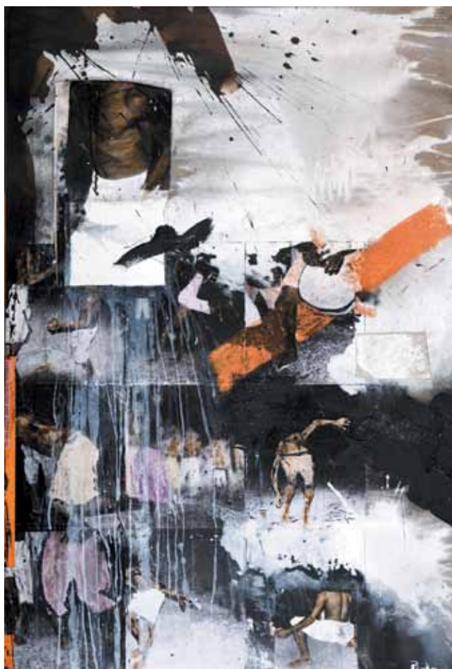
6. Num écran cor de cinema , 2012

Técnica mista s/ tela e madeira, 125x85cm