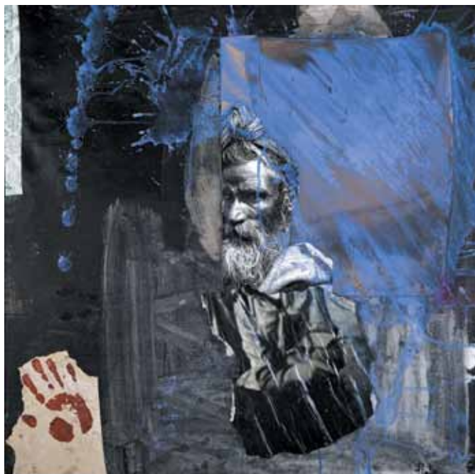
19. Kali , 2011

Técnica mista s/ tela e madeira, 100x100 cm