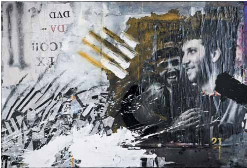
10. DVD 21 , 2012

Técnica mista s/ tela e madeira, 85x125 cm