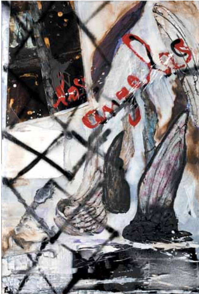
7. A janela e o Anjo , 2011/12 Técnica mista s/ tela e madeira, 125x85cm