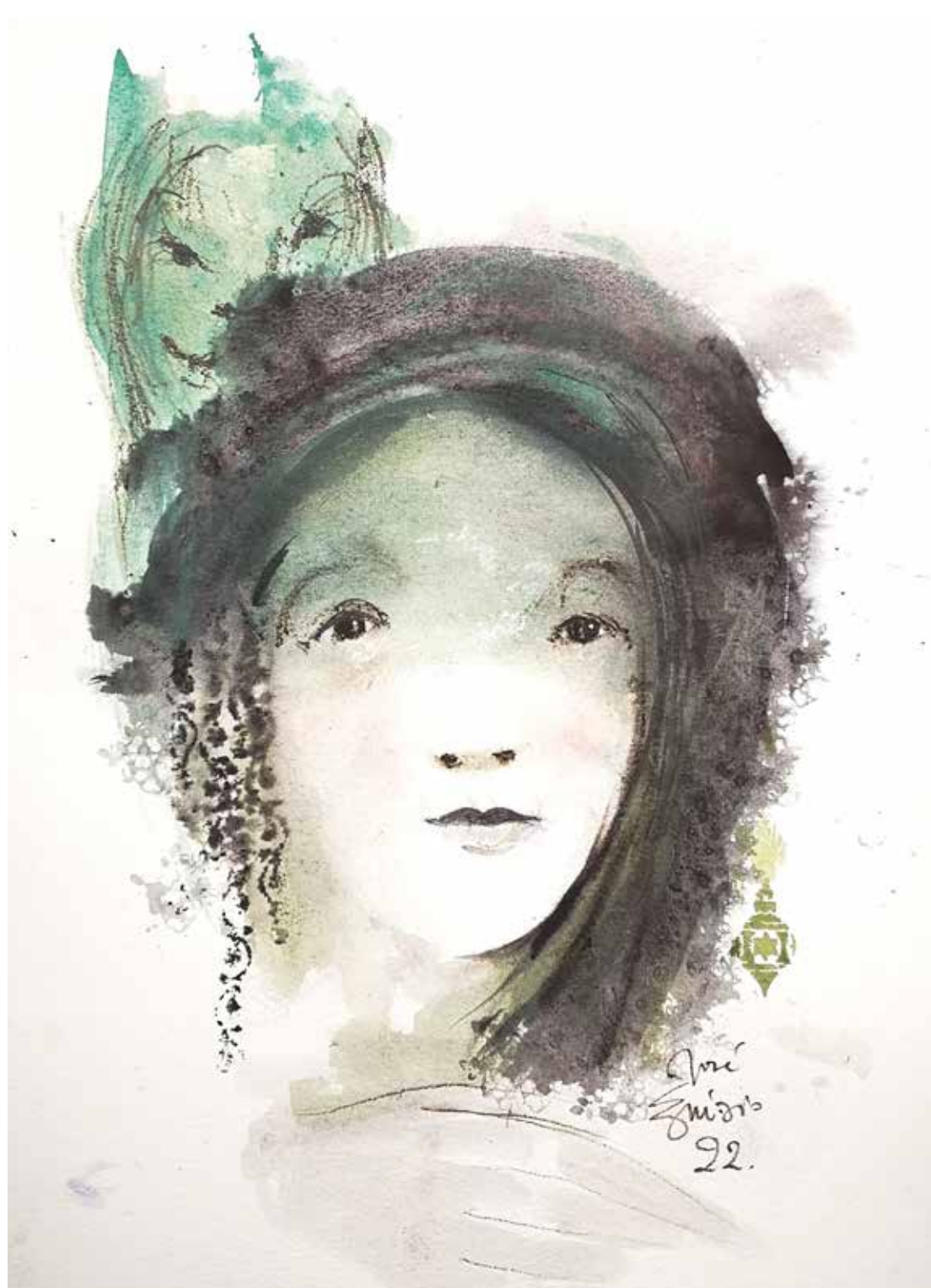
23. Série "A poética do olhar", 2022 Aguarela e aguadas ArtGraf s/ papel, 65x50 cm