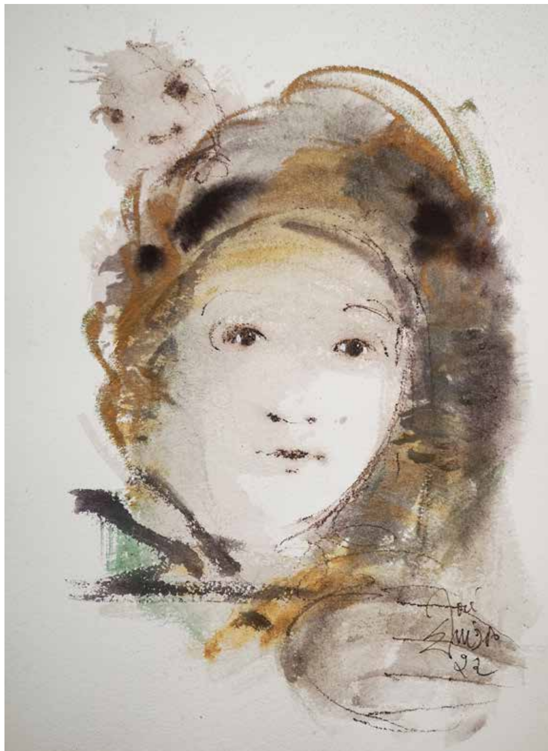
33. Série "A poética do olhar", 2022 Aquarela e aguadas ArtGraf s/ papel, 65x50 cm