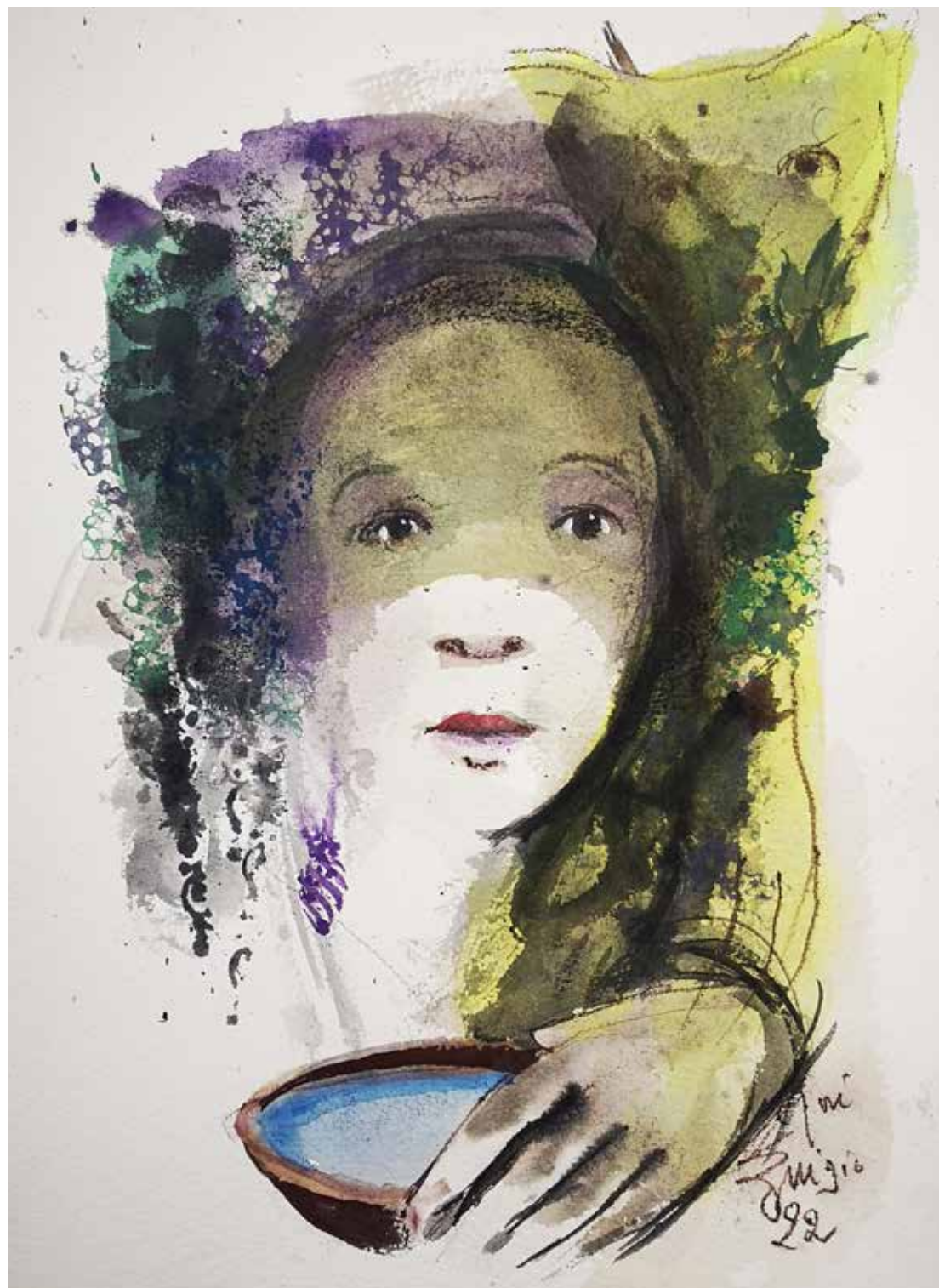
2. Série "A poética do olhar", 2022 Aquarela e aguadas ArtGraf s/ papel, 65x50 cm