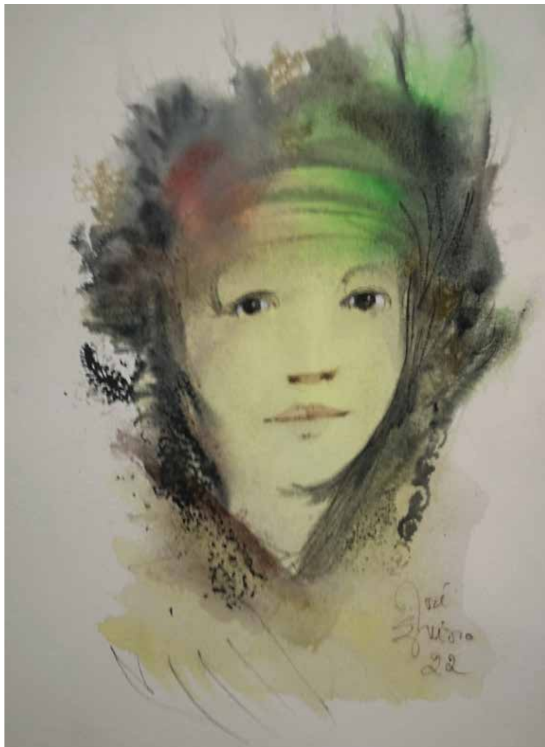
38. Série "A poética do olhar", 2022 Aquarela e aguadas ArtGraf s/ papel, 65x50 cm