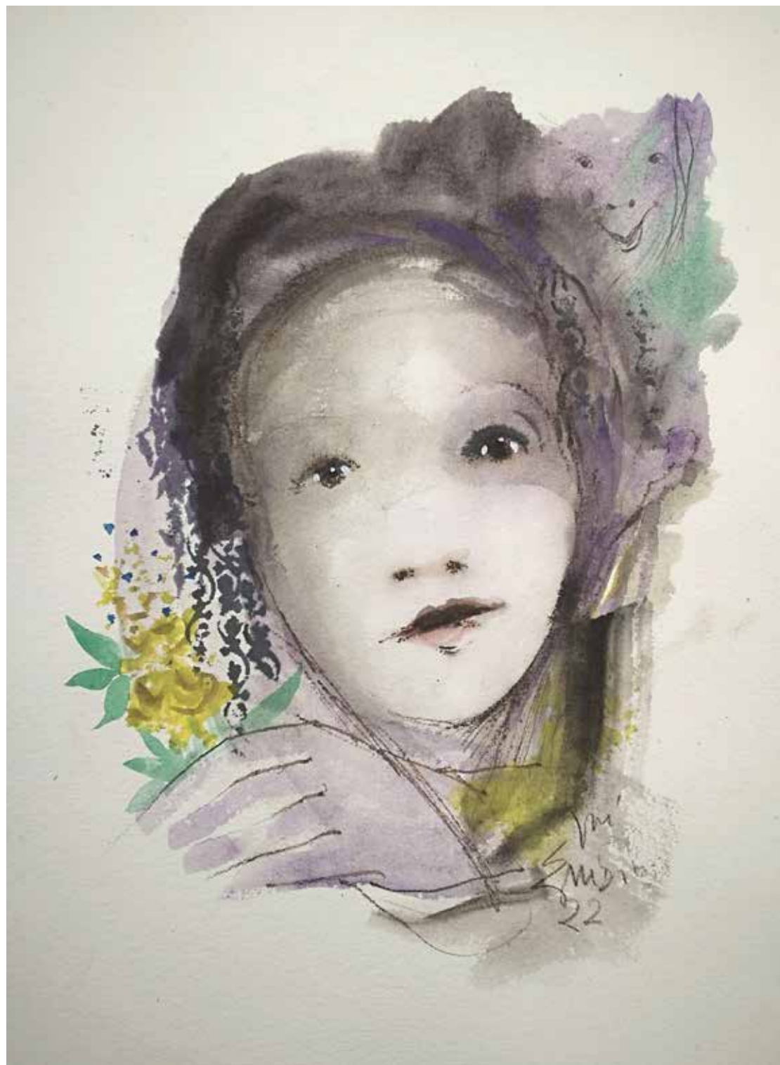
19. Série "A poética do olhar", 2022 Aquarela e aguadas ArtGraf s/ papel, 65x50 cm