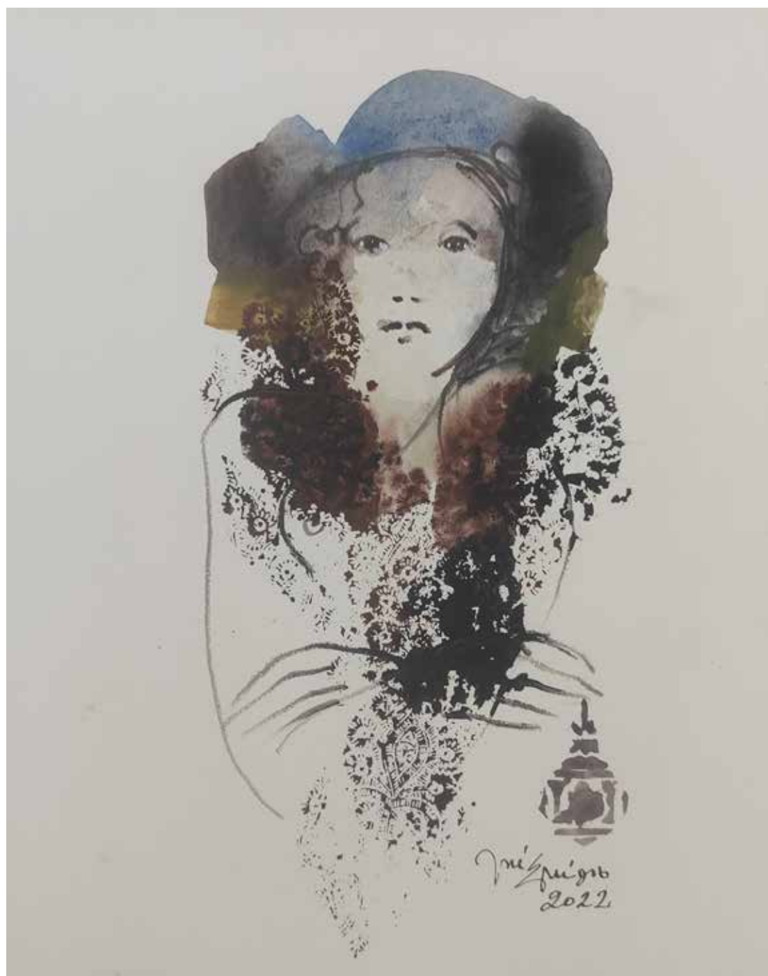
48. Série "A poética do olhar", 2022 Aguarela e aguadas ArtGraf s/ papel, 35x25 cm