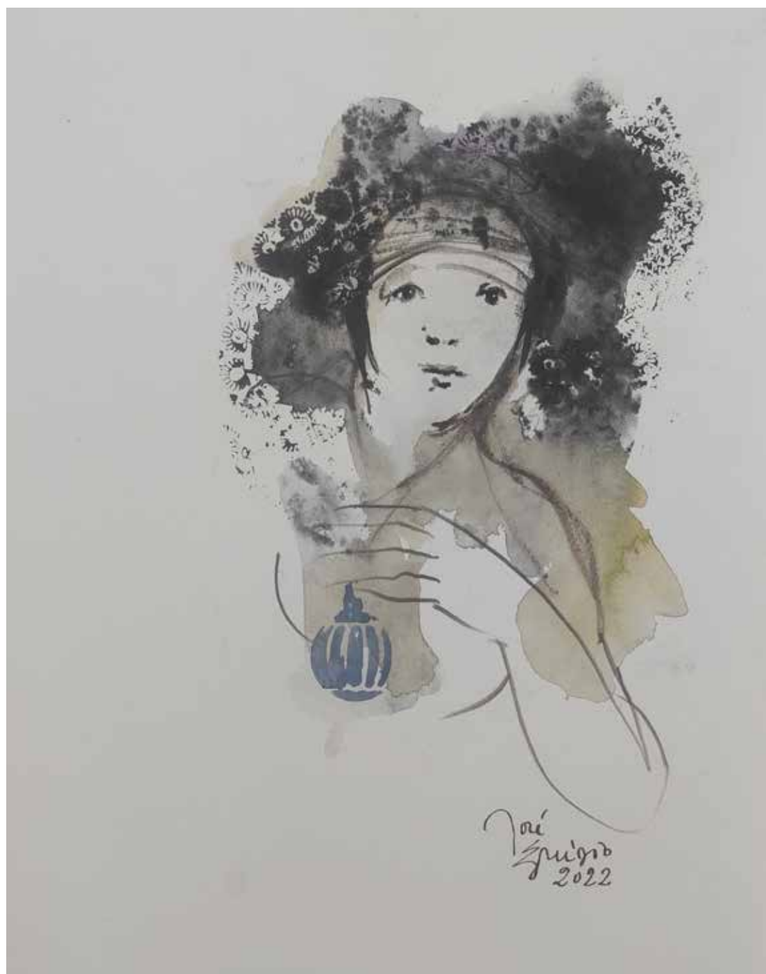
49. Série "A poética do olhar", 2022 Aquarela e aguadas ArtGraf s/ papel, 35x25 cm