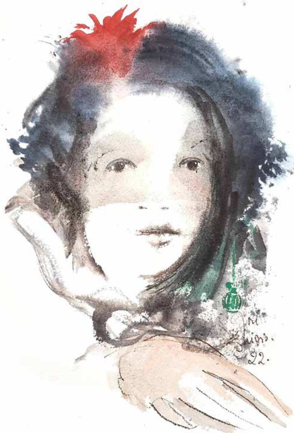
16. Série "A poética do olhar", 2022 Aquarela e aguadas ArtGraf s/ papel, 65x50 cm