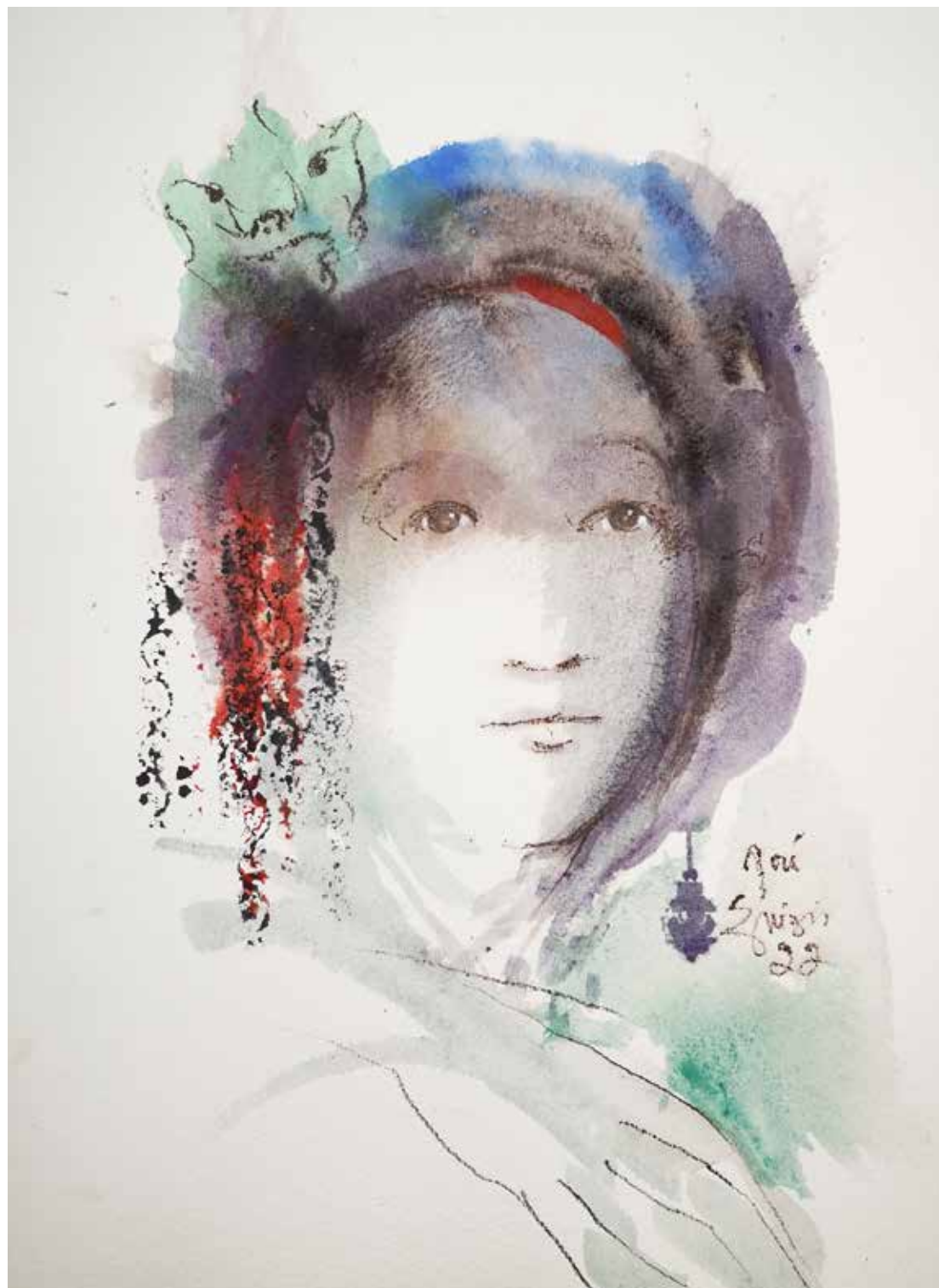
11. Série "A poética do olhar", 2022 Aquarela e aguadas ArtGraf s/ papel, 65x50 cm