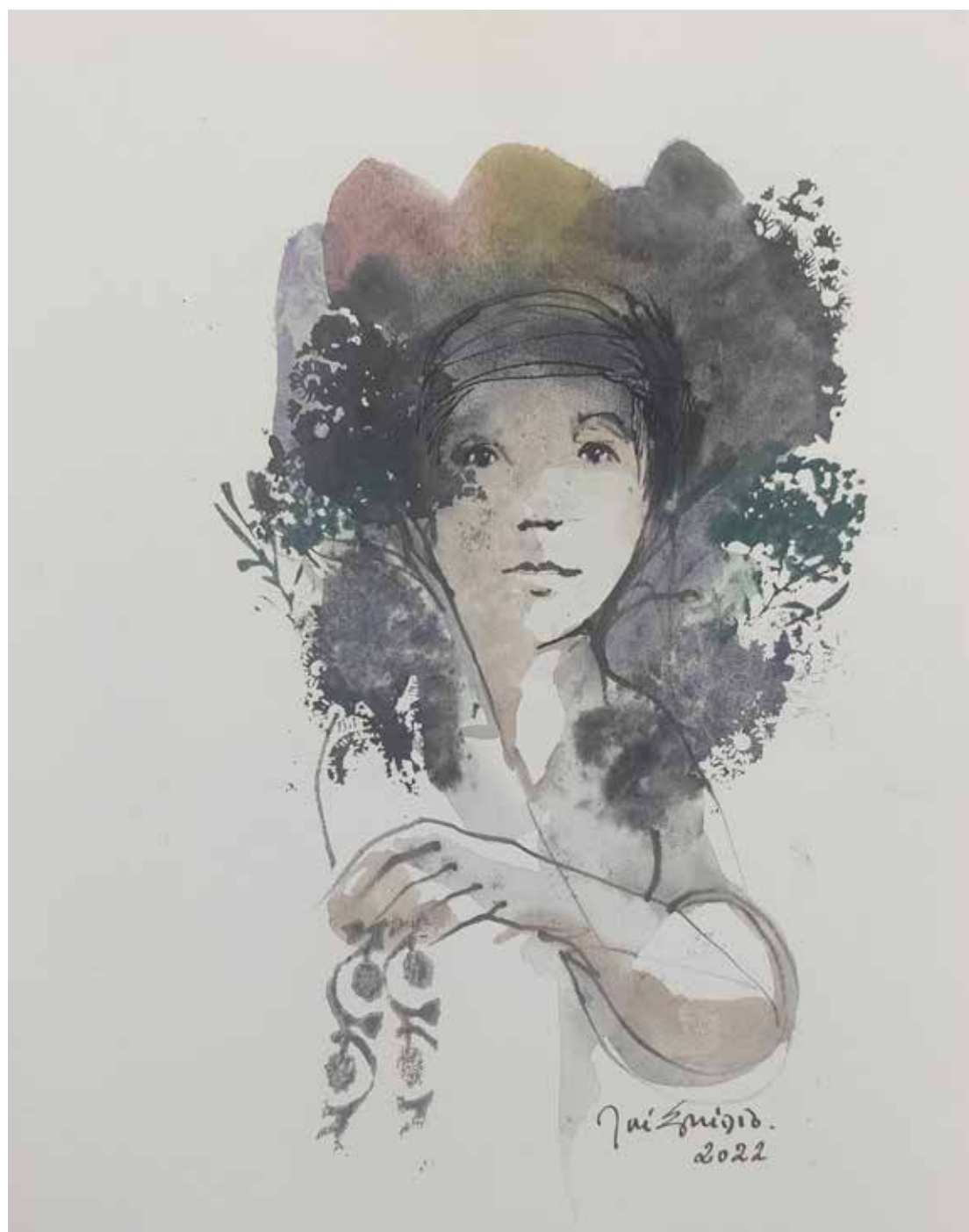
43. Série "A poética do olhar", 2022 Aquarela e aguadas ArtGraf s/ papel, 35x25 cm