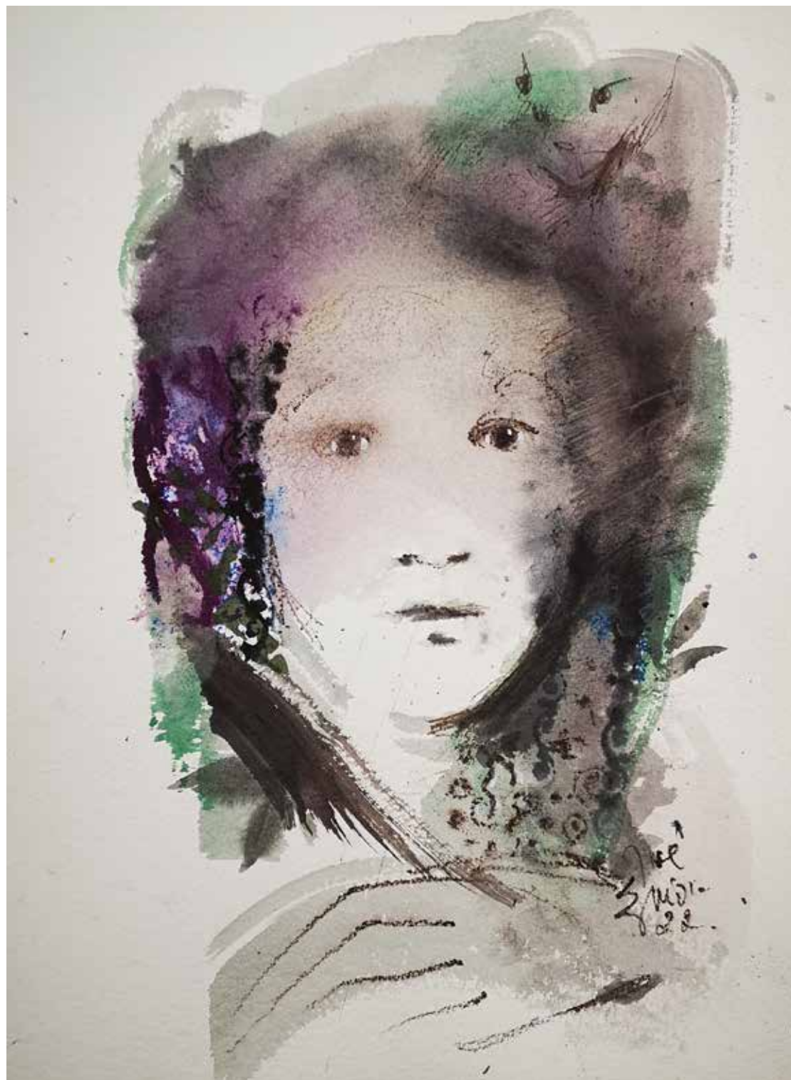
13. Série "A poética do olhar", 2022 Aguarela e aguadas ArtGraf s/ papel, 65x50 cm