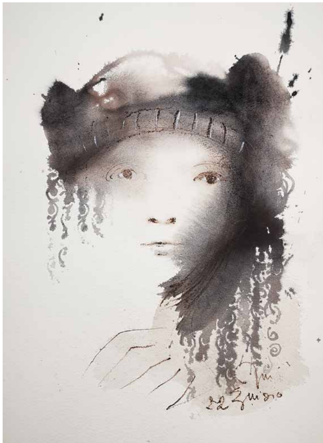
37. Série "A poética do olhar", 2022 Aquarela e aguadas ArtGraf s/ papel, 65x50 cm