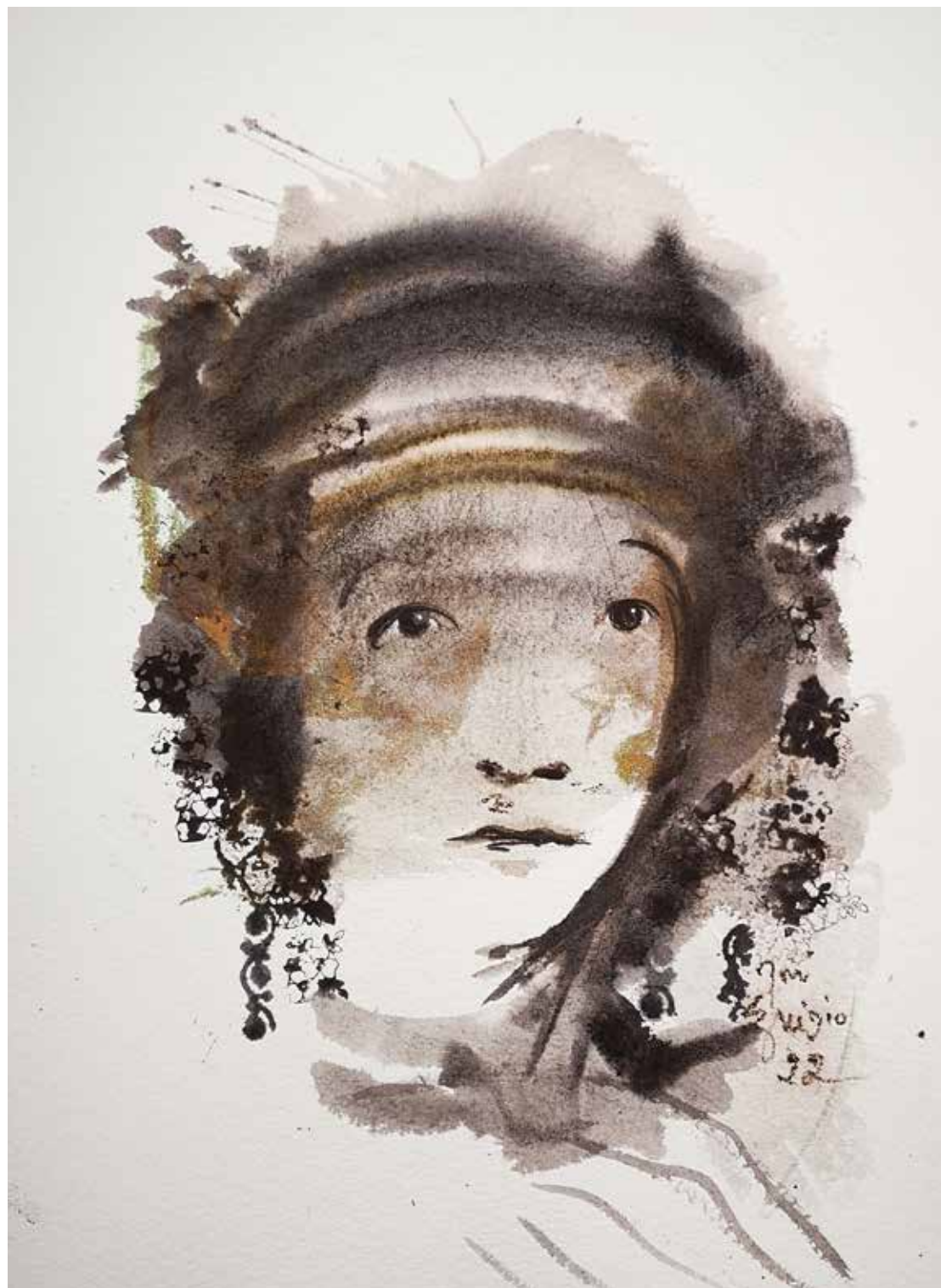
35. Série "A poética do olhar", 2022 Aquarela e aguadas ArtGraf s/ papel, 65x50 cm