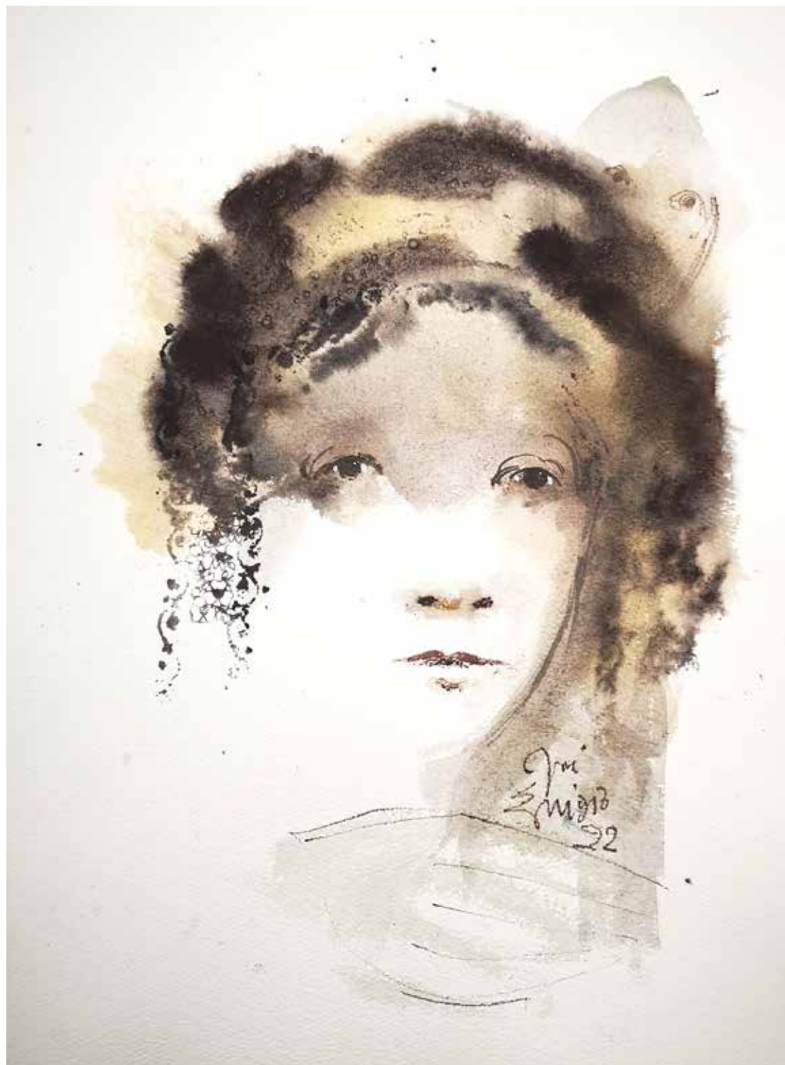
28. Série "A poética do olhar", 2022 Aquarela e aguadas ArtGraf s/ papel, 65x50 cm