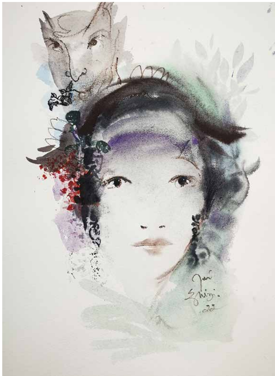
15. Série "A poética do olhar", 2022 Aquarela e aguadas ArtGraf s/ papel, 65x50 cm