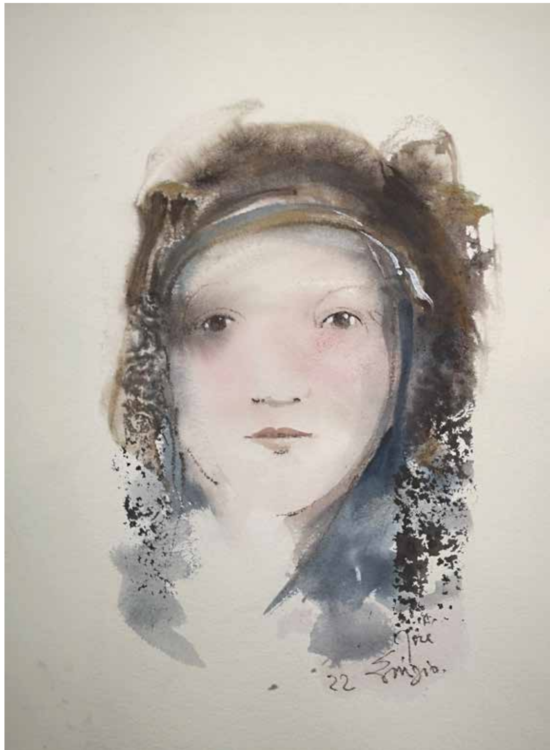
29. Série "A poética do olhar", 2022 Aquarela e aguadas ArtGraf s/ papel, 65x50 cm