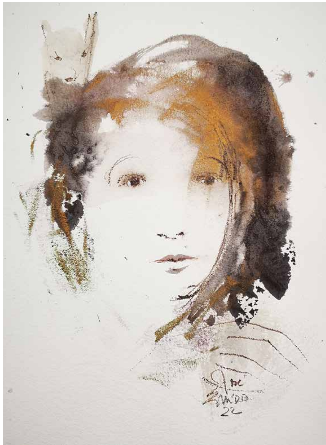
34. Série "A poética do olhar", 2022 Aguarela e aguadas ArtGraf s/ papel, 65x50 cm