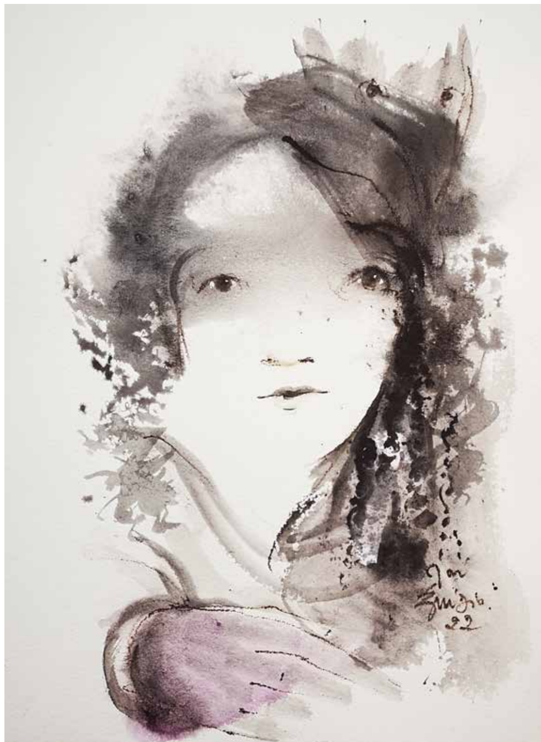
36. Série "A poética do olhar", 2022 Aguarela e aguadas ArtGraf s/ papel, 65x50 cm