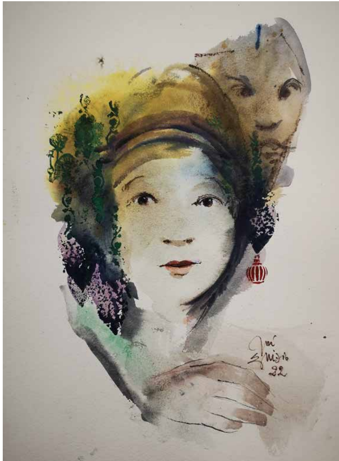
5. Série "A poética do olhar", 2022 Aquarela e aguadas ArtGraf s/ papel, 65x50 cm