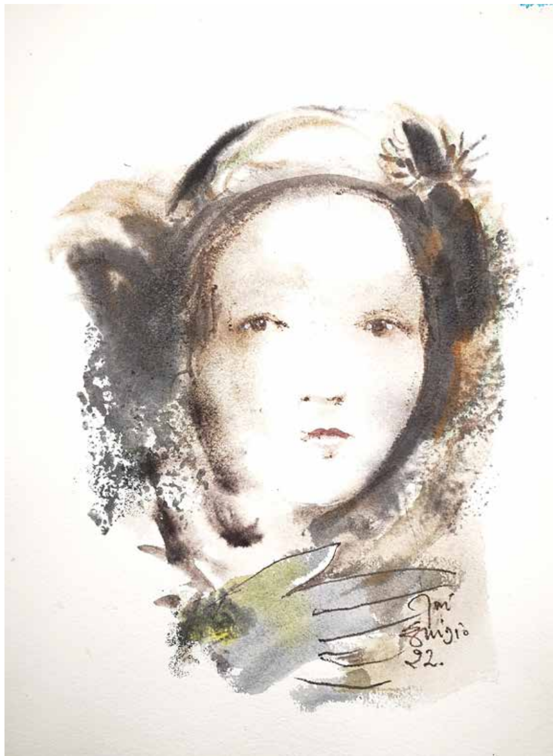
26. Série "A poética do olhar", 2022 Aquarela e aguadas ArtGraf s/ papel, 65x50 cm