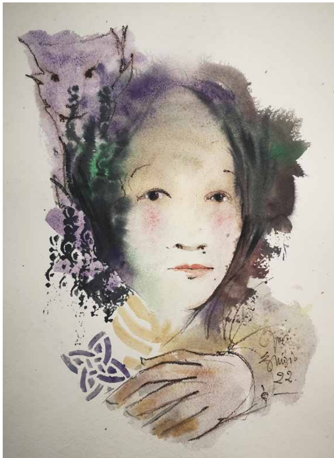
18. Série "A poética do olhar", 2022 Aguarela e aguadas ArtGraf s/ papel, 65x50 cm