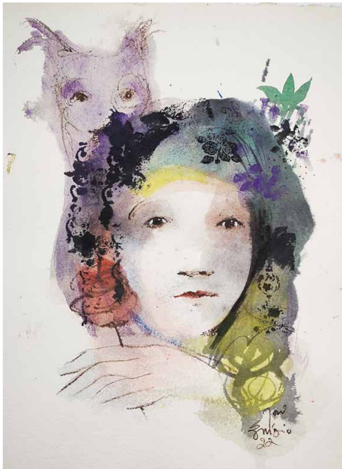
8. Série "A poética do olhar", 2022 Aguarela e aguadas ArtGraf s/ papel, 65x50 cm