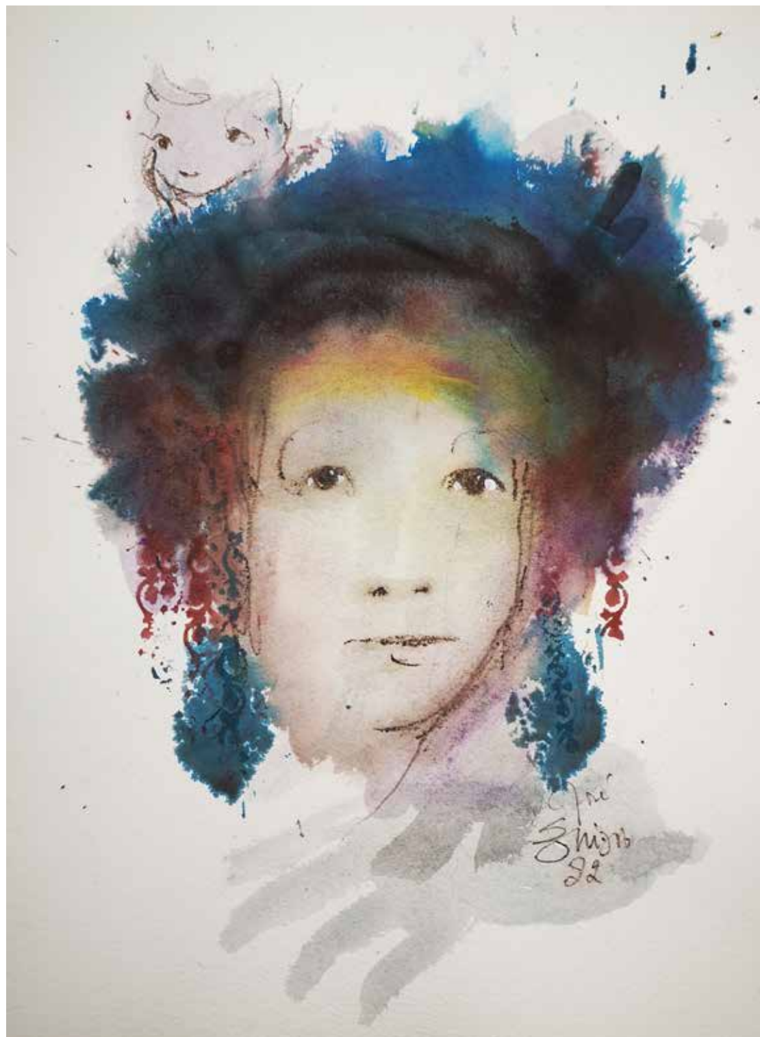
3. Série "A poética do olhar", 2022 Aguarela e aguadas ArtGraf s/ papel, 65x50 cm