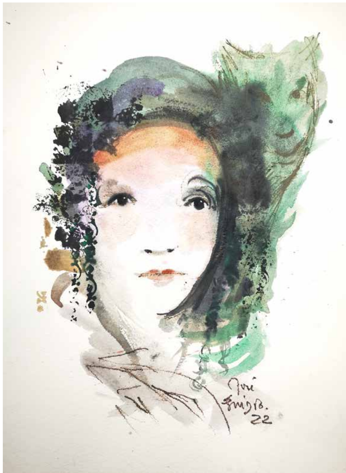
20. Série "A poética do olhar", 2022 Aquarela e aguadas ArtGraf s/ papel, 65x50 cm