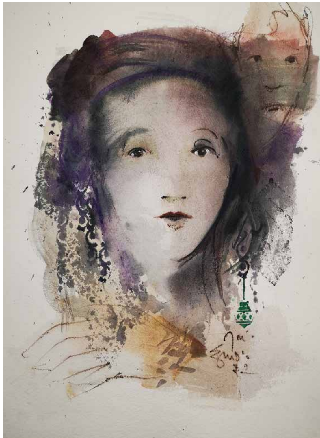
12. Série "A poética do olhar", 2022 Aguarela e aguadas ArtGraf s/ papel, 65x50 cm