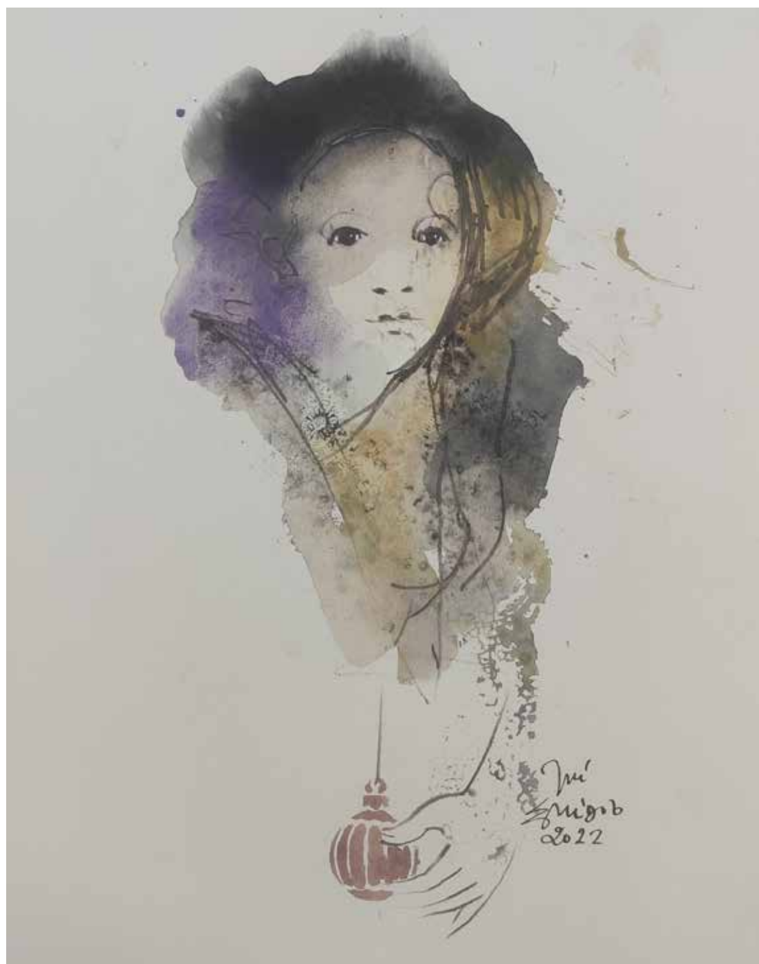
39. Série "A poética do olhar", 2022 Aquarela e aguadas ArtGraf s/ papel, 35x25 cm