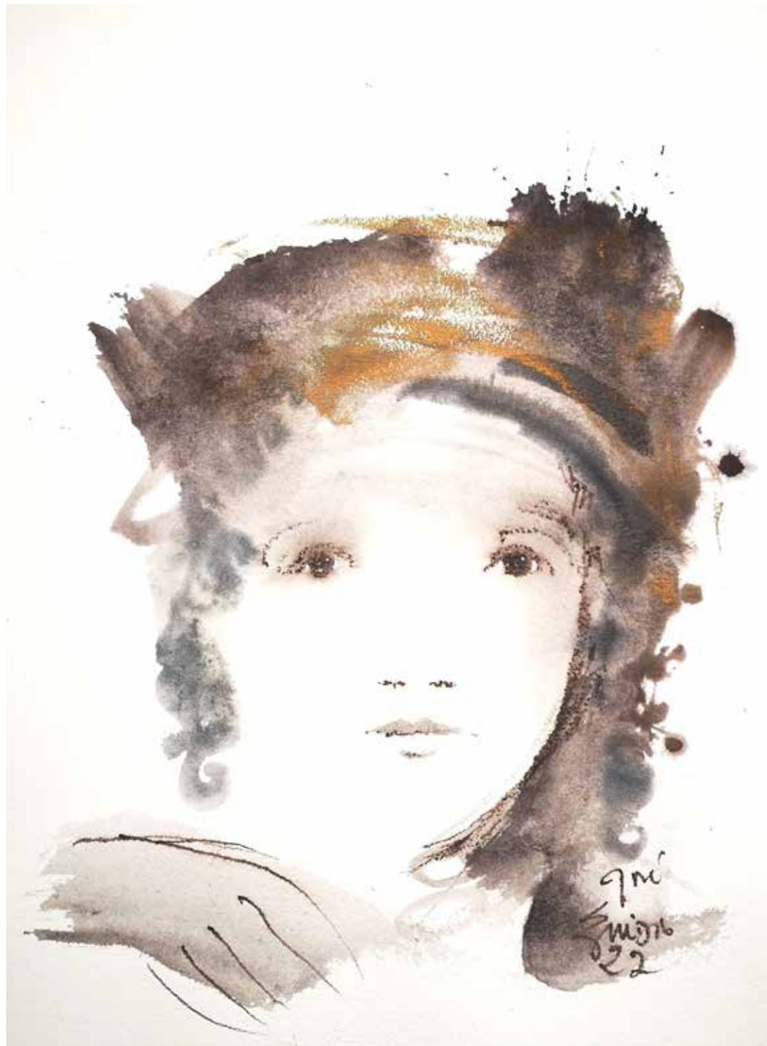
31. Série "A poética do olhar", 2022 Aguarela e aguadas ArtGraf s/ papel, 65x50 cm