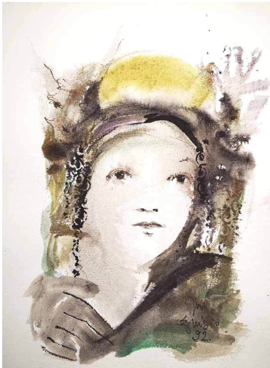
25. Série "A poética do olhar", 2022 Aguarela e aguadas ArtGraf s/ papel, 65x50 cm