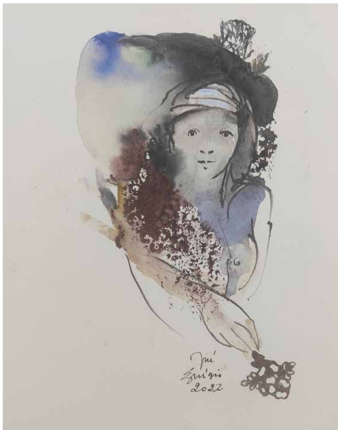
50. Série "A poética do olhar", 2022 Aguarela e aguadas ArtGraf s/ papel, 35x25 cm