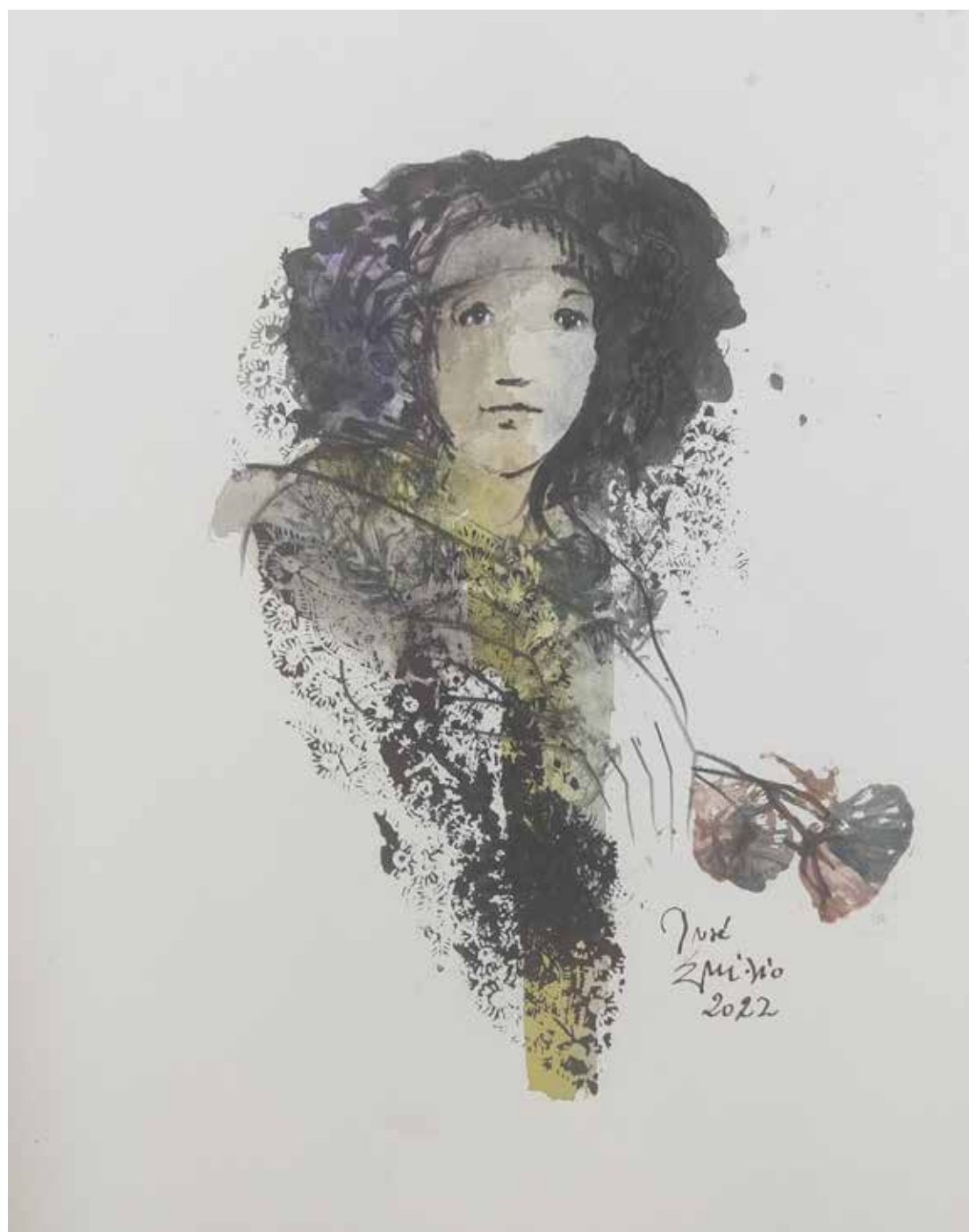
47. Série "A poética do olhar", 2022 Aquarela e aguadas ArtGraf s/ papel, 35x25 cm