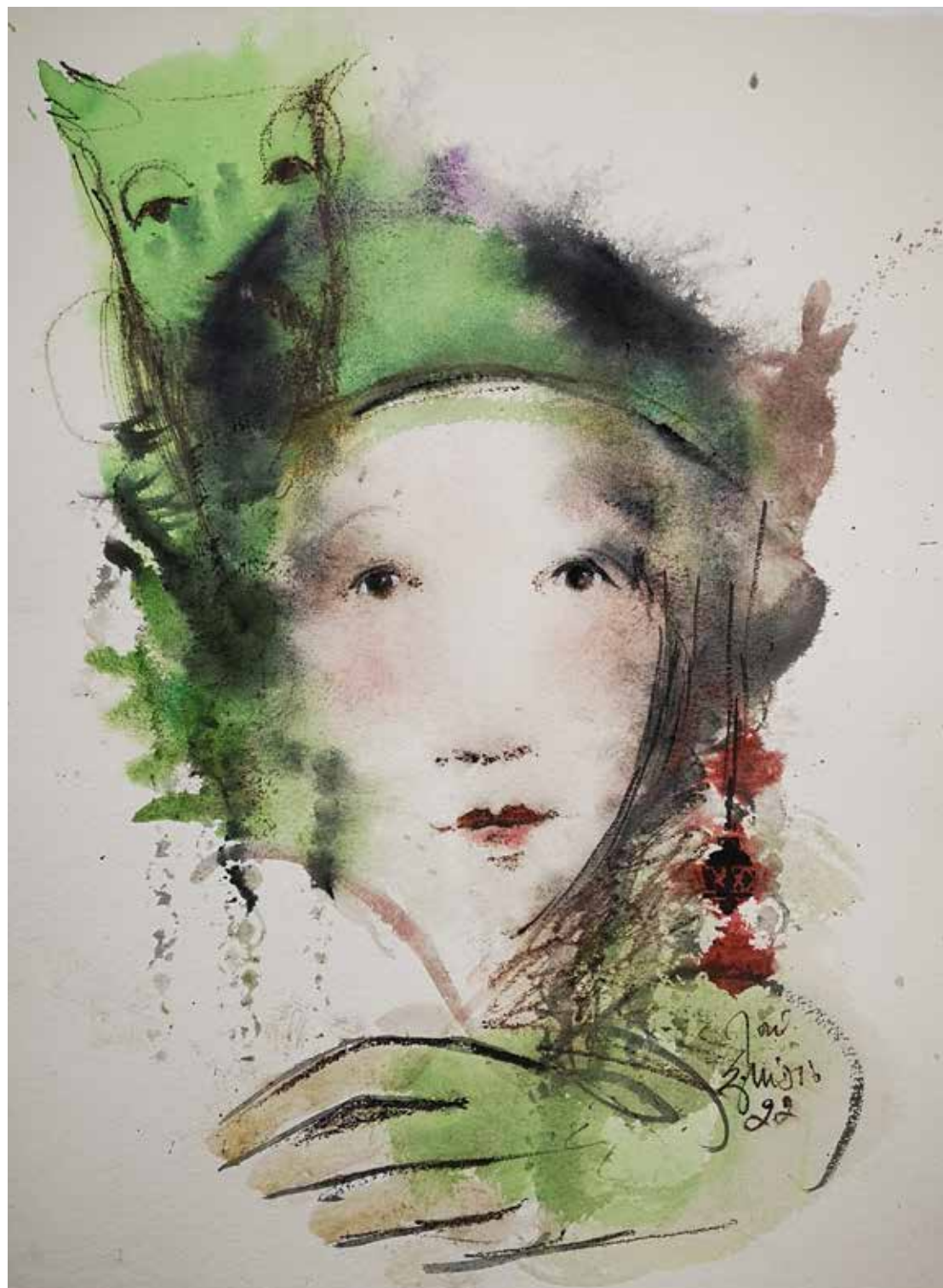
7. Série "A poética do olhar", 2022 Aguarela e aguadas ArtGraf s/ papel, 65x50 cm