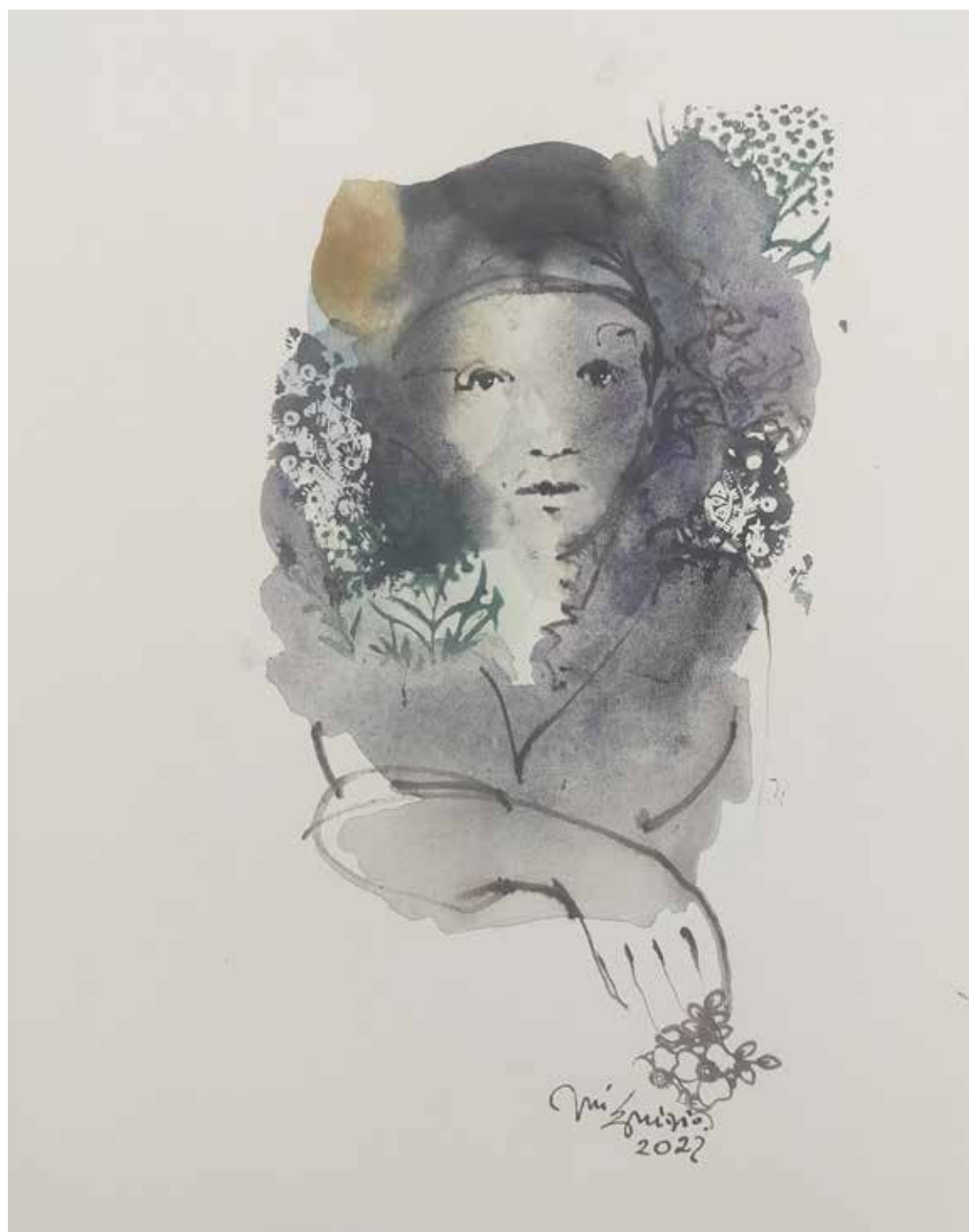
52. Série "A poética do olhar", 2022 Aguarela e aguadas ArtGraf s/ papel, 35x25 cm