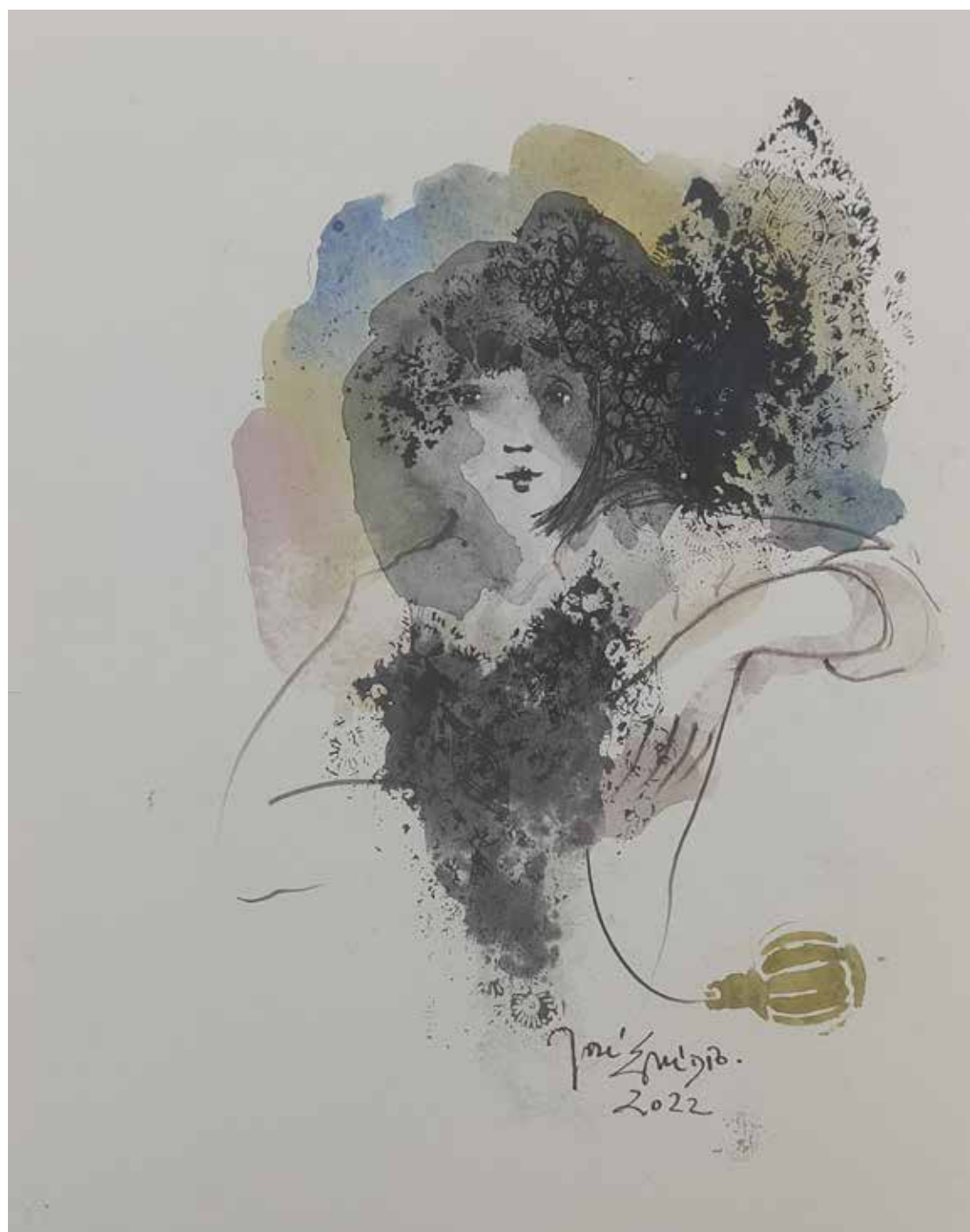
45. Série "A poética do olhar", 2022 Aquarela e aguadas ArtGraf s/ papel, 35x25 cm