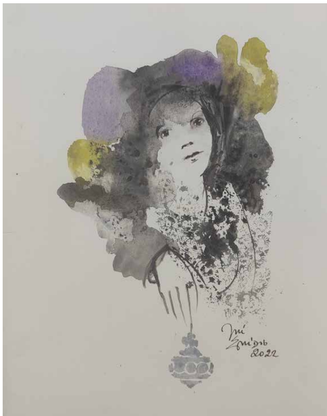
46. Série "A poética do olhar", 2022 Aquarela e aguadas ArtGraf s/ papel, 35x25 cm