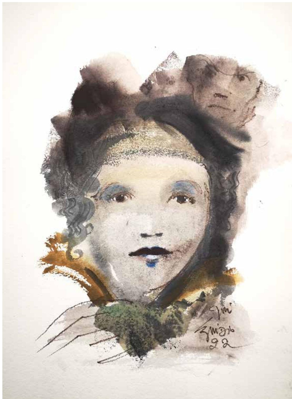
30. Série "A poética do olhar", 2022 Aquarela e aguadas ArtGraf s/ papel, 65x50 cm