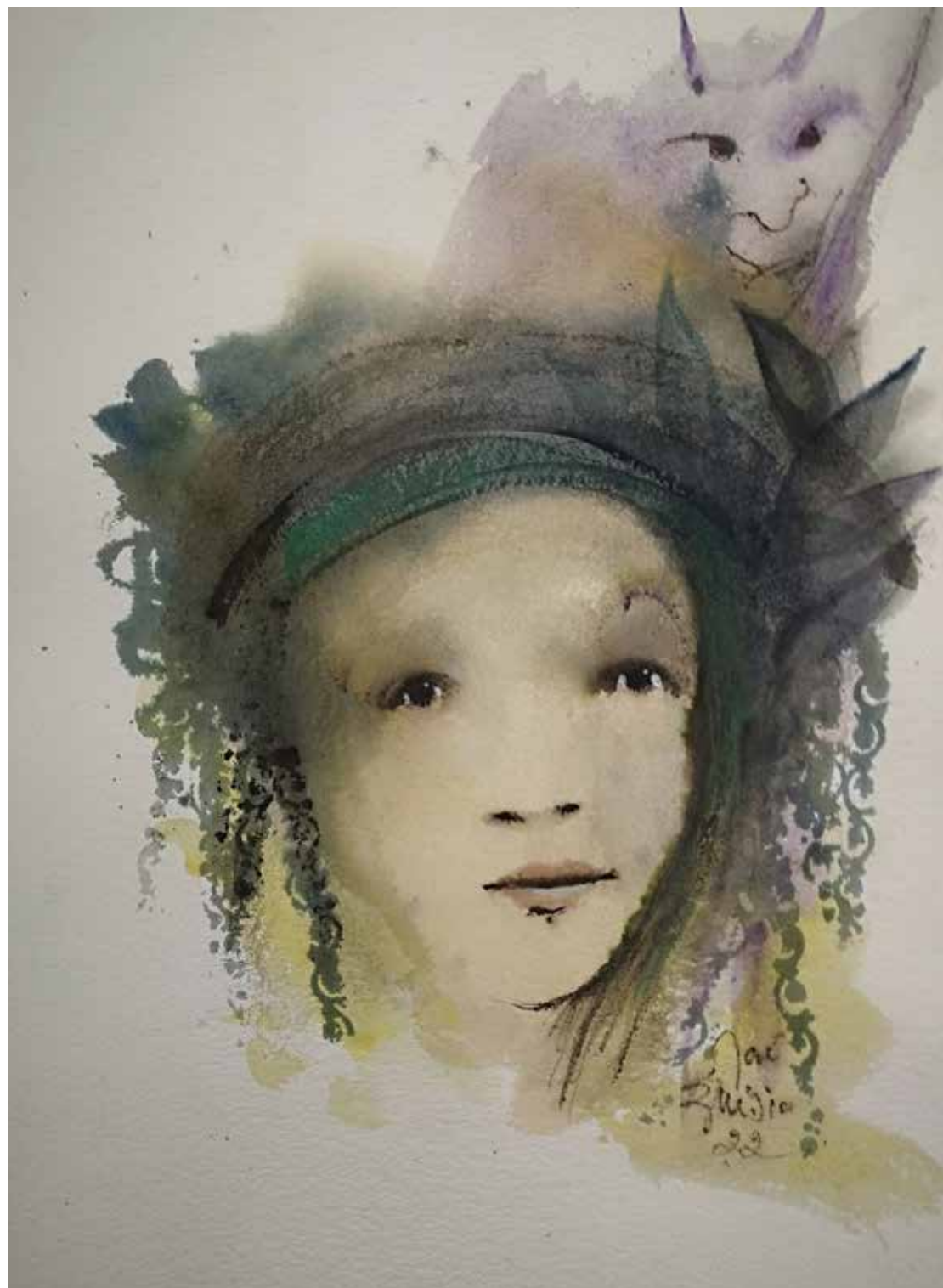
22. Série "A poética do olhar", 2022 Aquarela e aguadas ArtGraf s/ papel, 65x50 cm