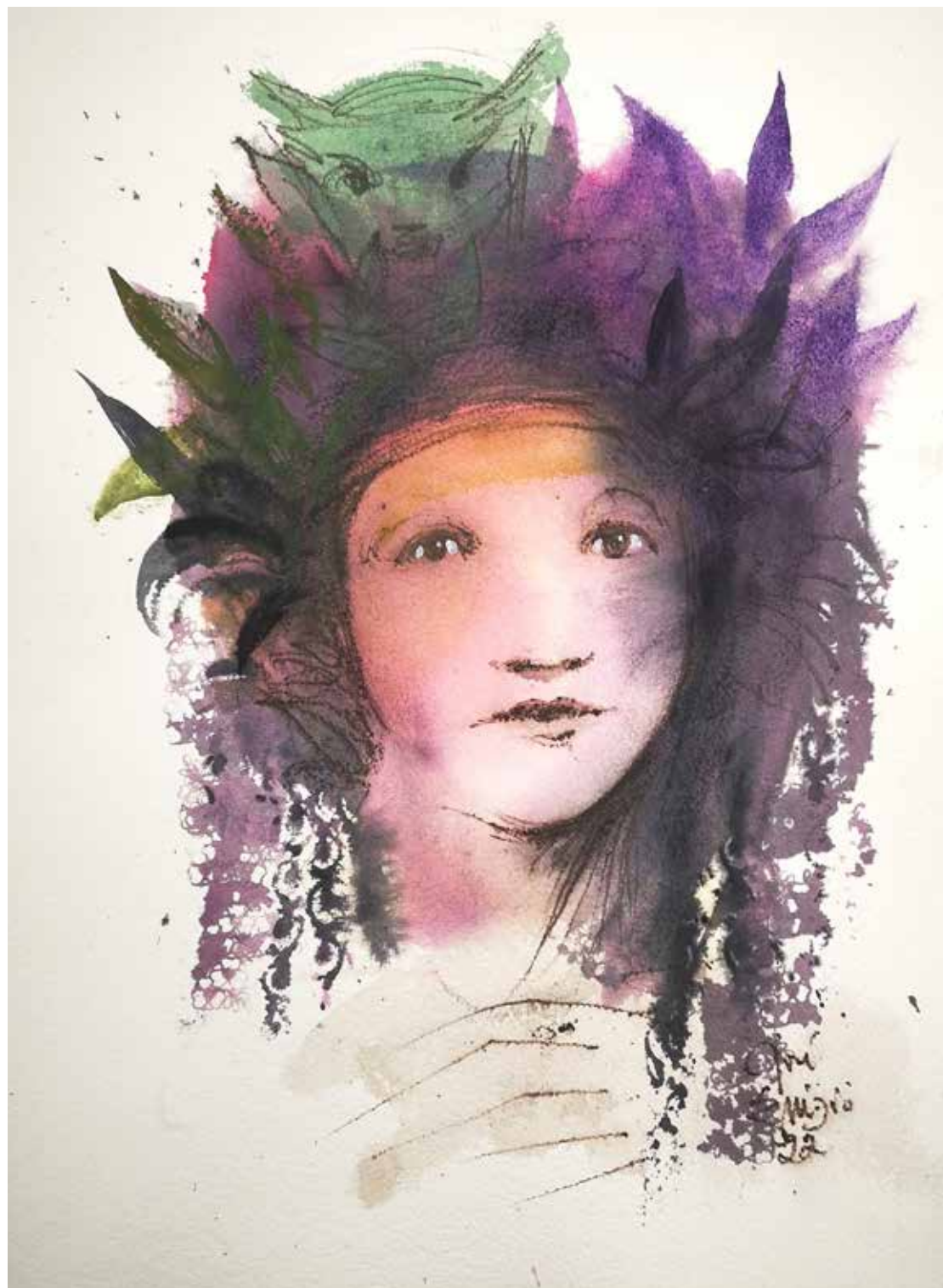
14. Série "A poética do olhar", 2022 Aquarela e aguadas ArtGraf s/ papel, 65x50 cm