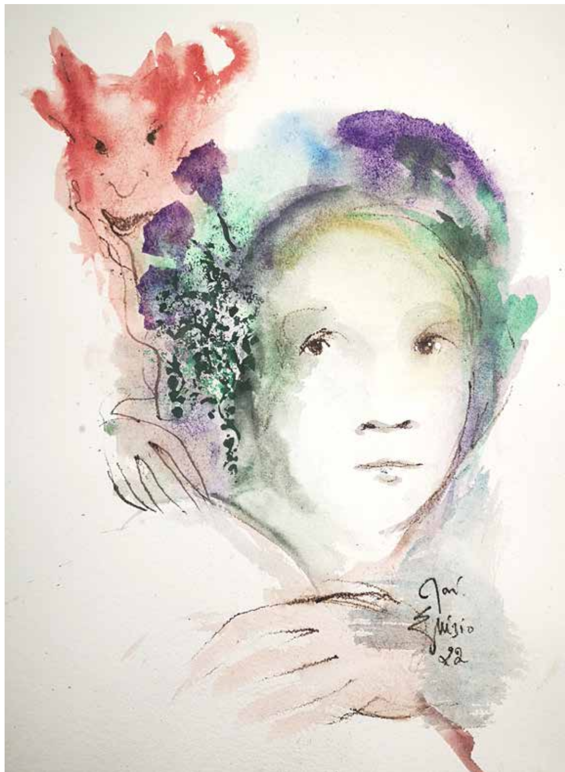
24. Série "A poética do olhar", 2022 Aguarela e aguadas ArtGraf s/ papel, 65x50 cm