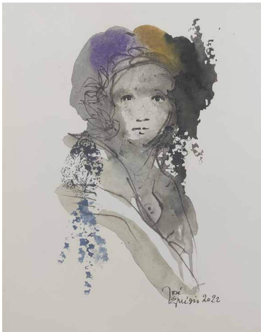
40. Série "A poética do olhar", 2022 Aquarela e aguadas ArtGraf s/ papel, 35x25 cm