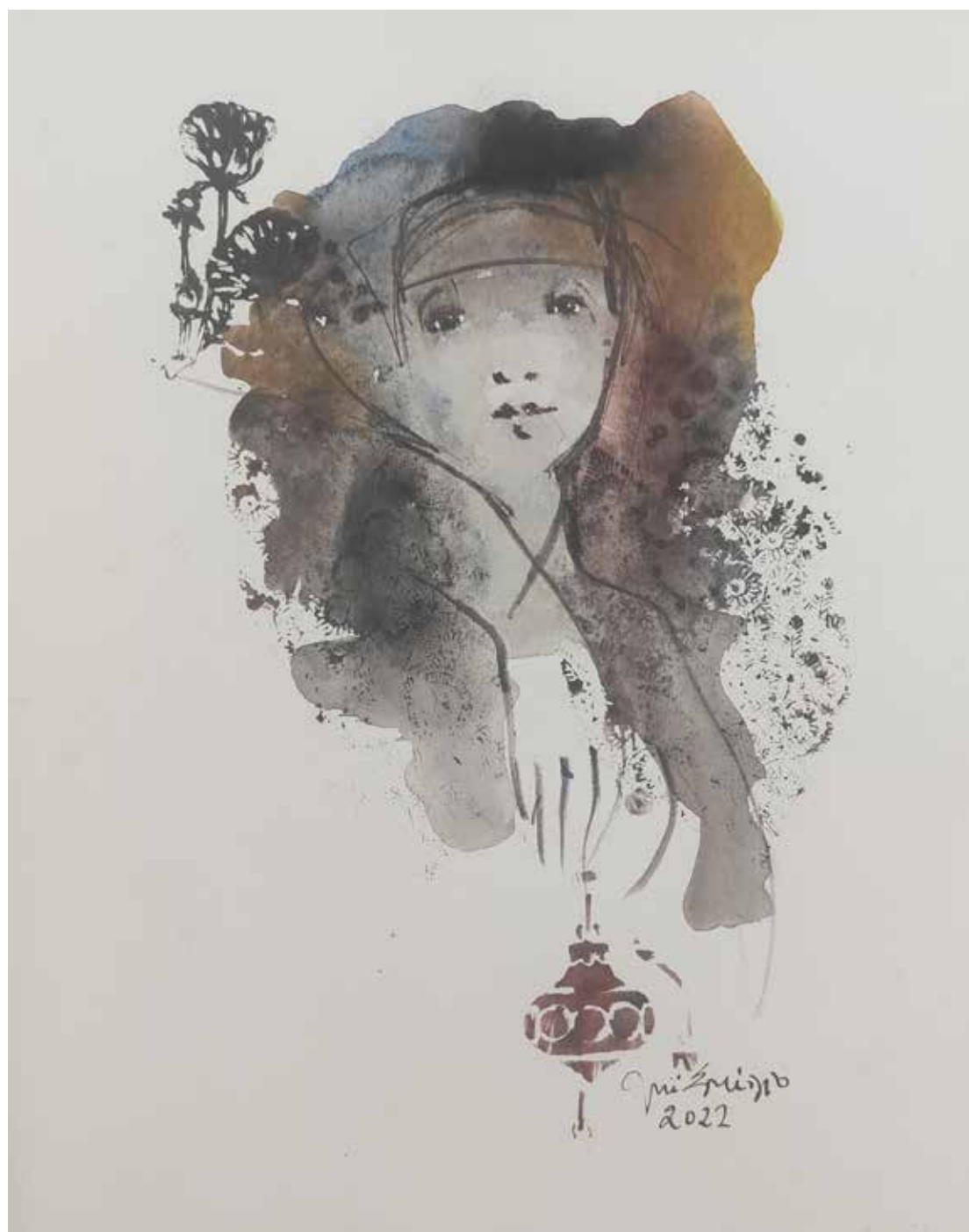
44. Série "A poética do olhar", 2022 Aquarela e aguadas ArtGraf s/ papel, 35x25 cm