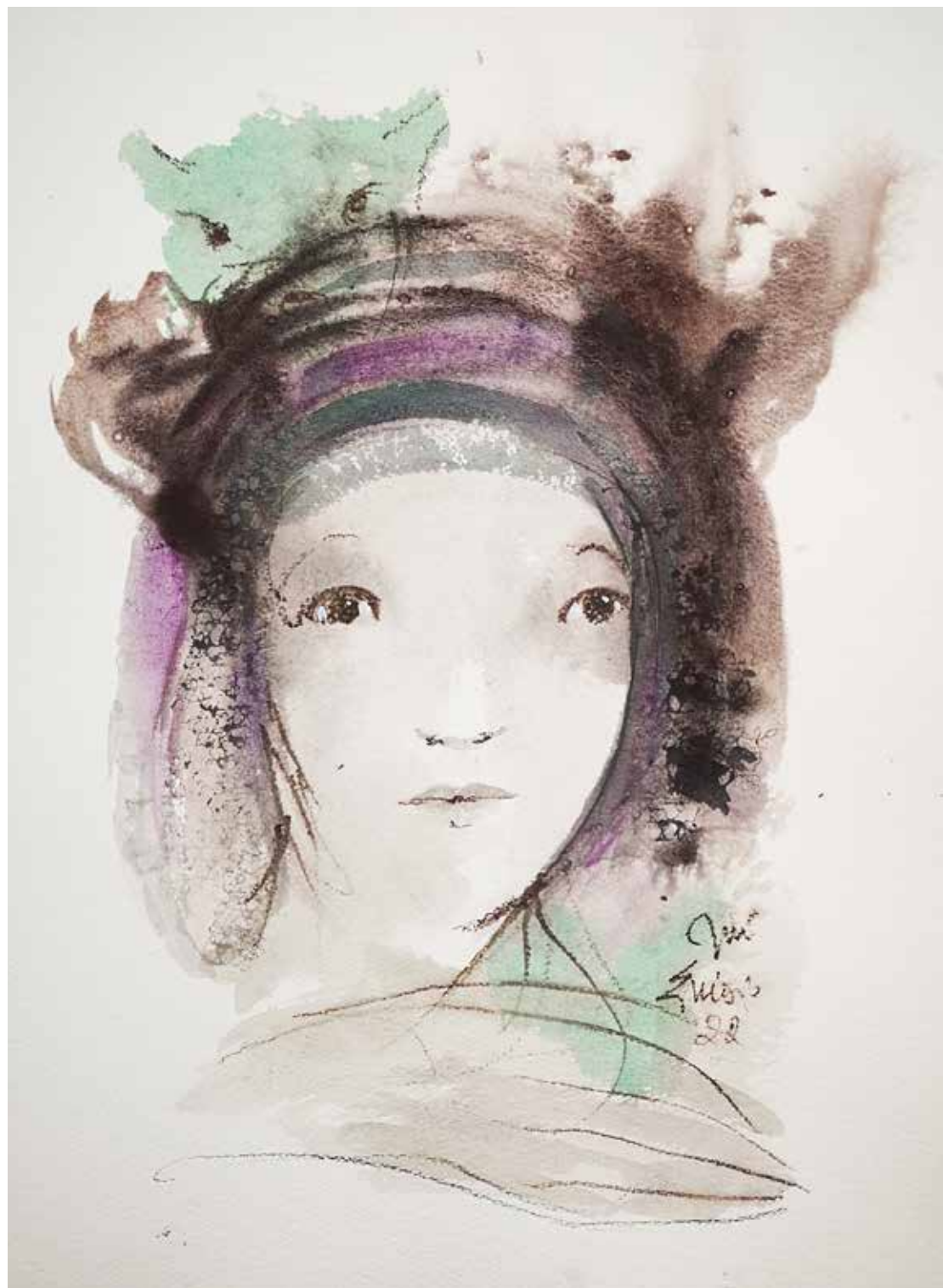
32. Série "A poética do olhar", 2022 Aquarela e aguadas ArtGraf s/ papel, 65x50 cm