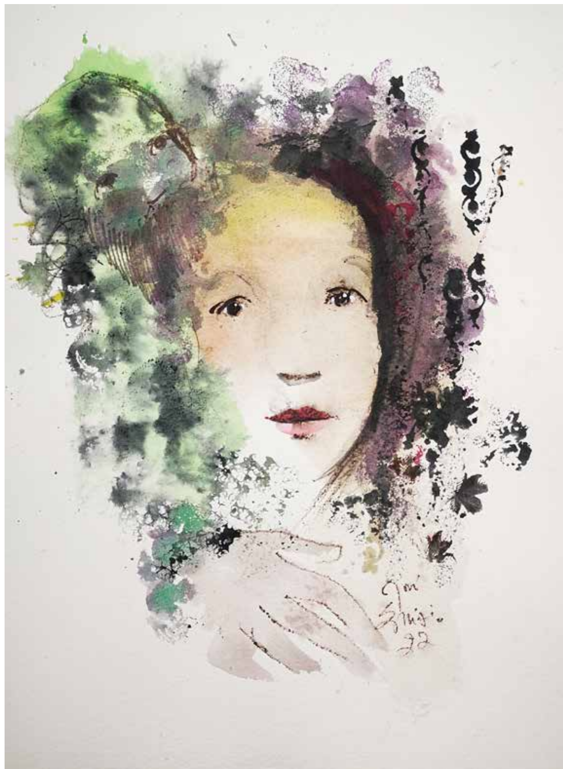
9. Série "A poética do olhar", 2022 Aquarela e aguadas ArtGraf s/ papel, 65x50 cm