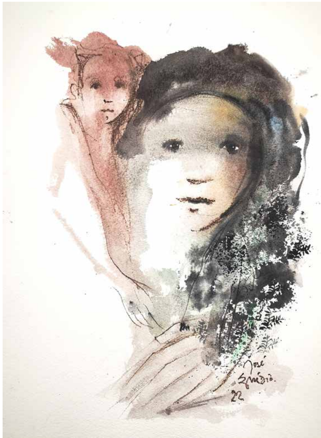
21. Série "A poética do olhar", 2022 Aguarela e aguadas ArtGraf s/ papel, 65x50 cm