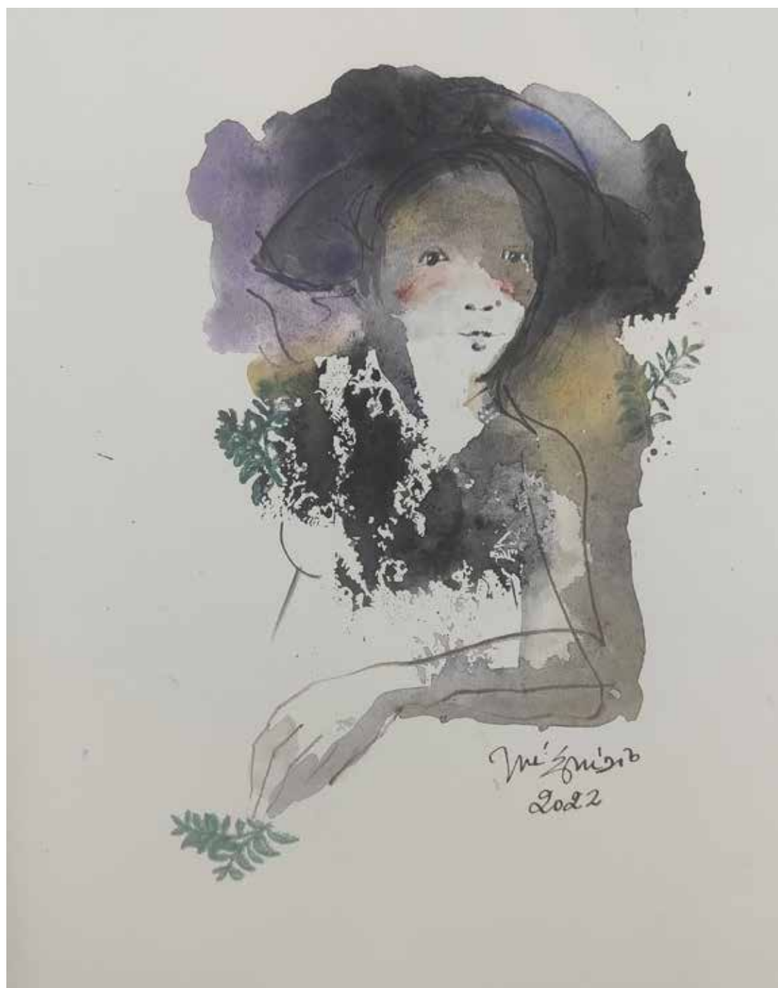
41. Série "A poética do olhar", 2022 Aquarela e aguadas ArtGraf s/ papel, 35x25 cm