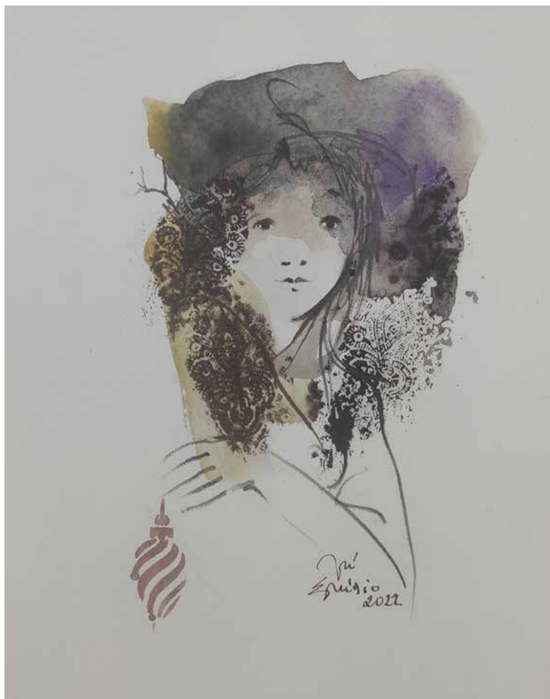
42. Série "A poética do olhar", 2022 Aquarela e aguadas ArtGraf s/ papel, 35x25 cm