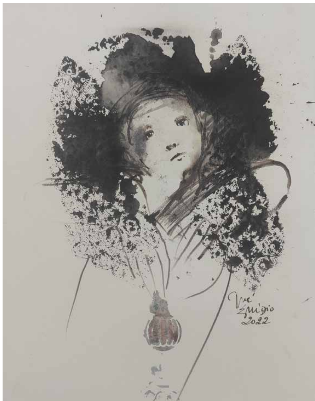
51. Série "A poética do olhar", 2022 Aguarela e aguadas ArtGraf s/ papel, 35x25 cm