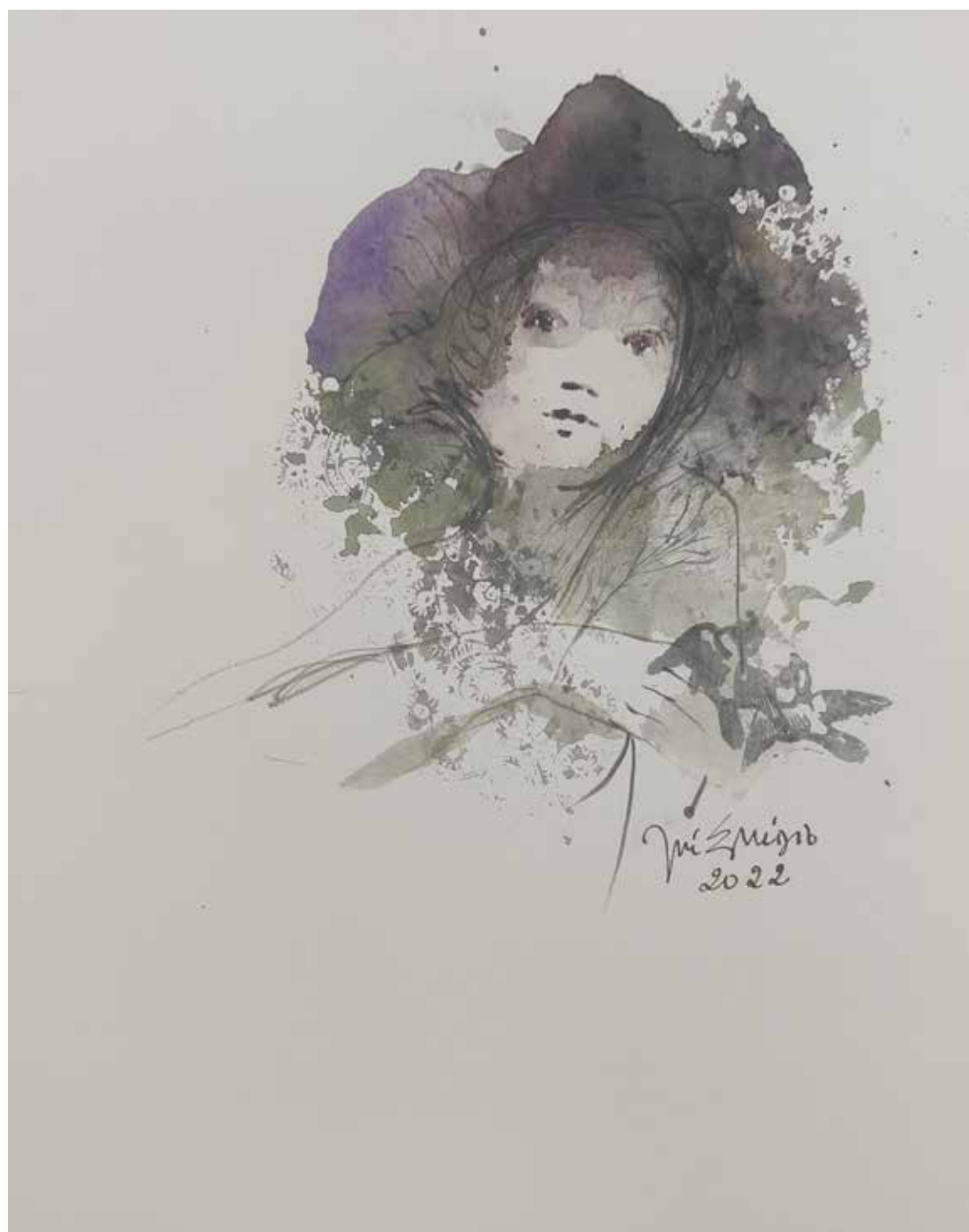
53. Série "A poética do olhar", 2022 Aquarela e aguadas ArtGraf s/ papel, 35x25 cm