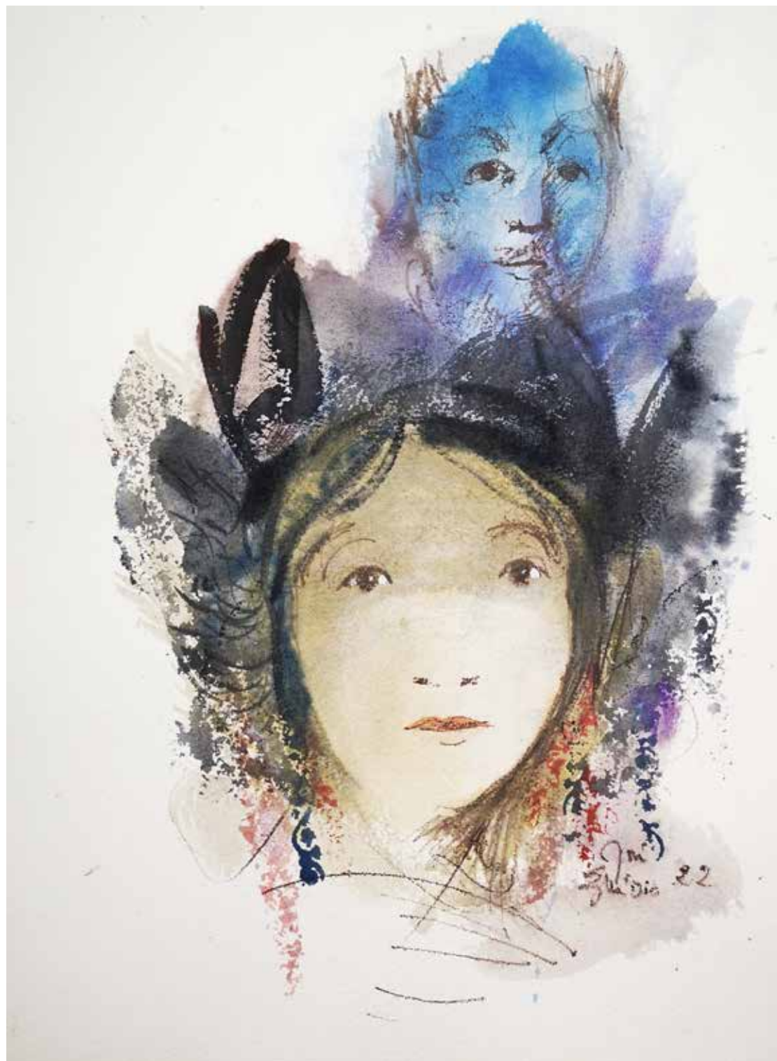
4. Série "A poética do olhar", 2022 Aquarela e aguadas ArtGraf s/ papel, 65x50 cm