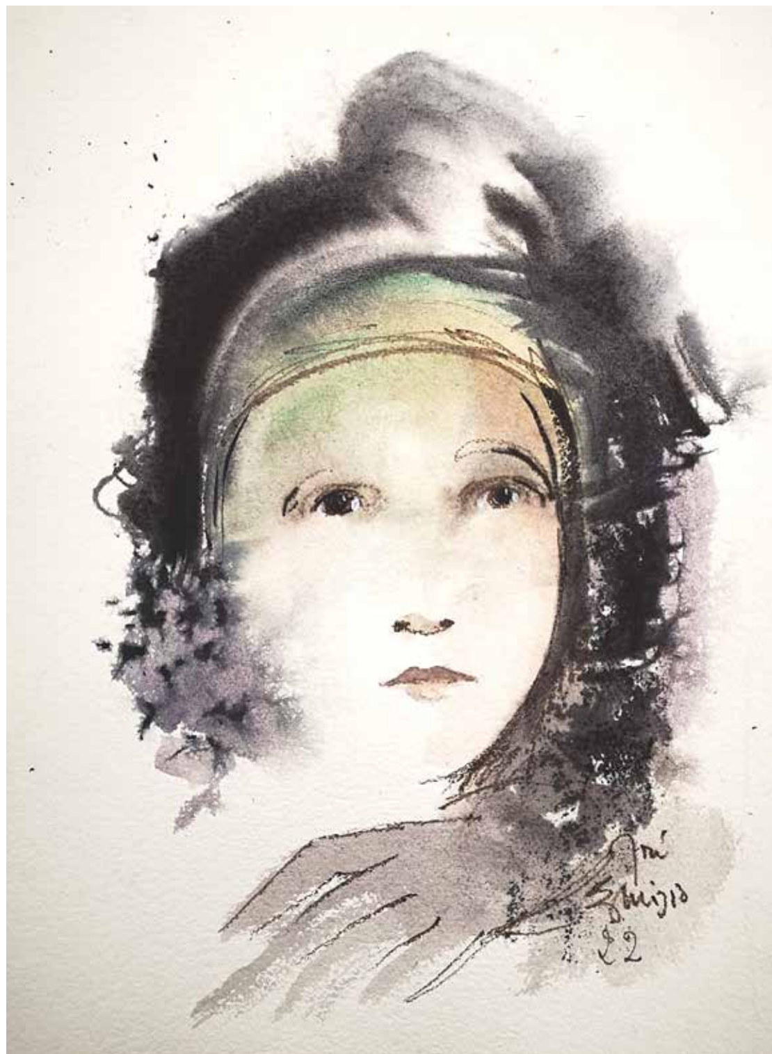
17. Série "A poética do olhar", 2022 Aquarela e aguadas ArtGraf s/ papel, 65x50 cm