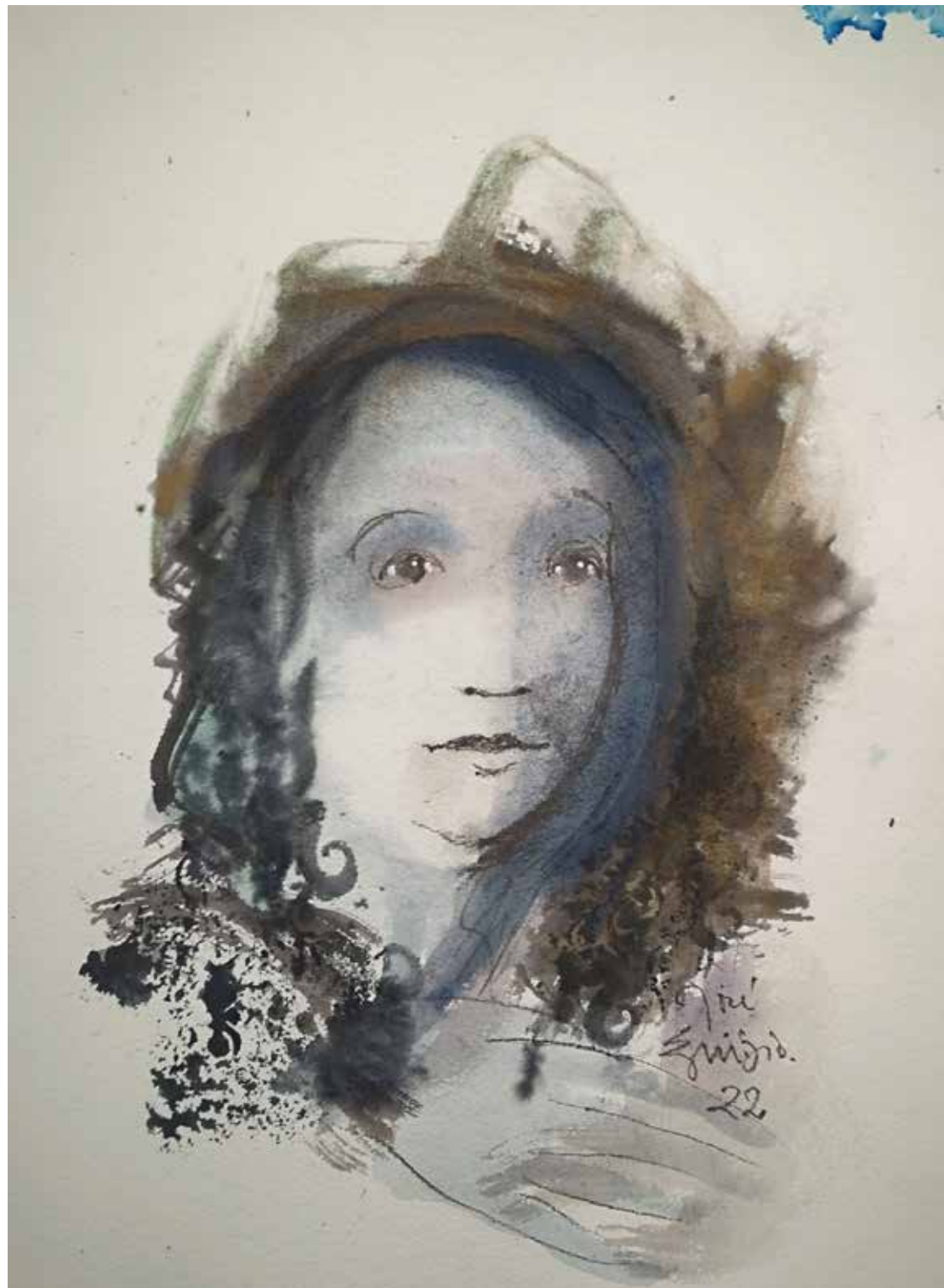
27. Série "A poética do olhar", 2022 Aguarela e aguadas ArtGraf s/ papel, 65x50 cm