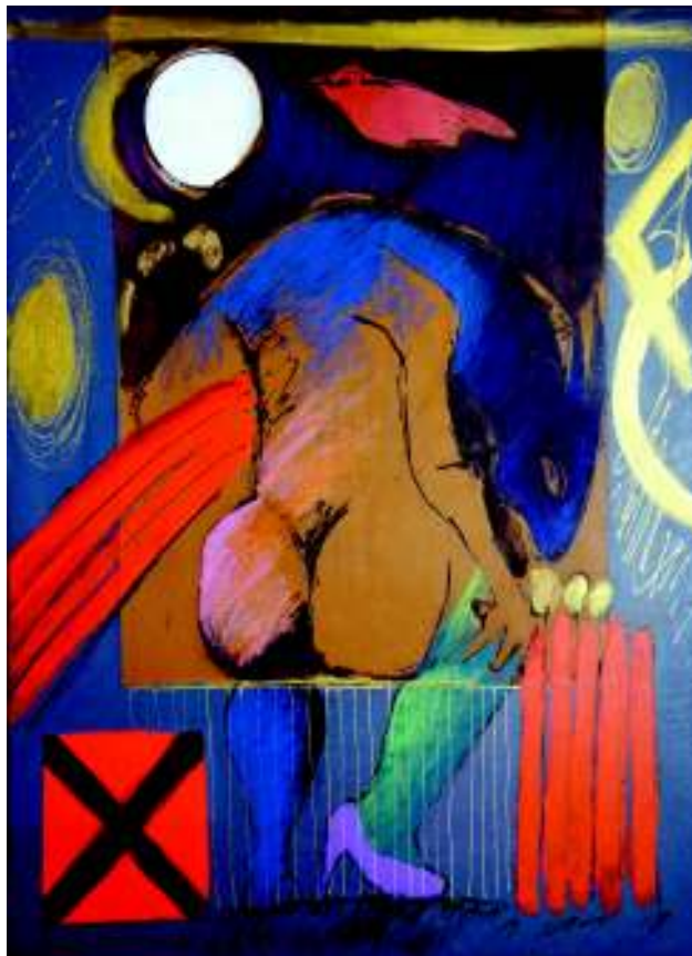
10. Noturno com comedora de flores Técnica mista s/ tela, 90x70cm