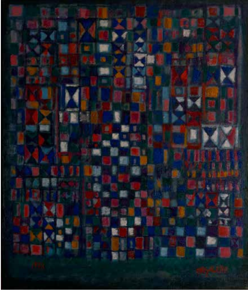
45. Venise à minuit, Óleo s/ tela, 55 x 46 cm, 1978