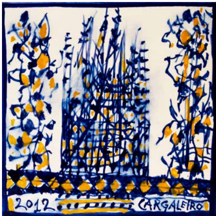
19. Placa cerâmica 14 x 14 cm, 2012