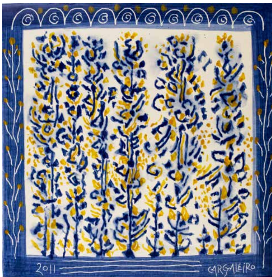
8. Placa cerâmica, 30 x 30 cm, 2011