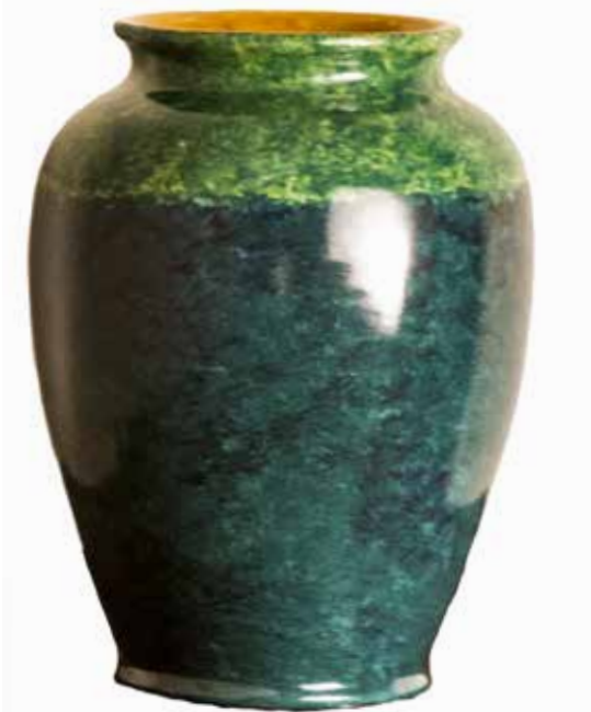
40. Jarra, 2014