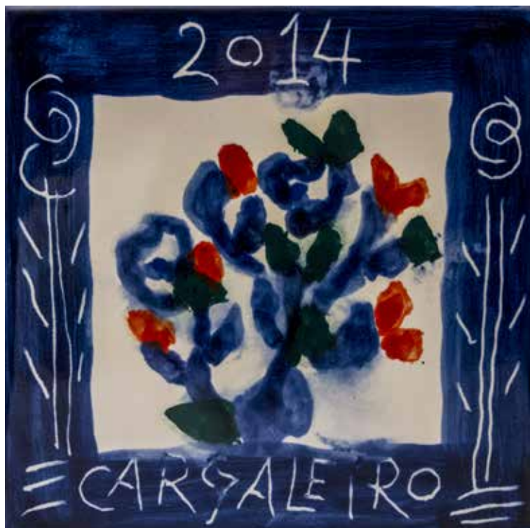
13. Placa cerâmica 14 x 14 cm, 2014