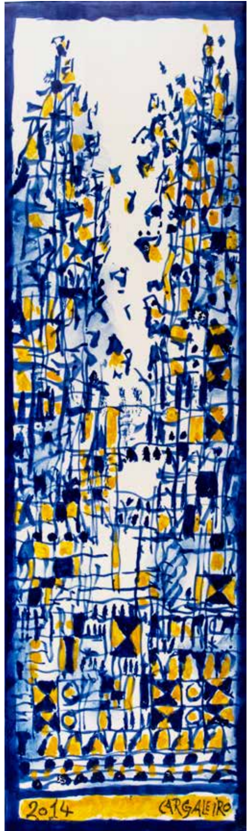
1. Placa cerâmica, 48 x 14 cm, 2014