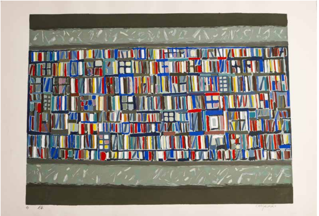
52. Bibliotheque, 1991 Seragrafia, P/A, Papel Arches, 63 x 91 cm