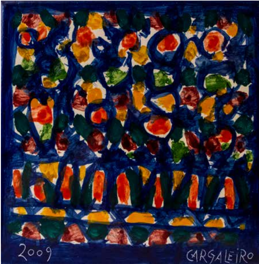
11. Placa cerâmica, 20 x 20 cm, 2009