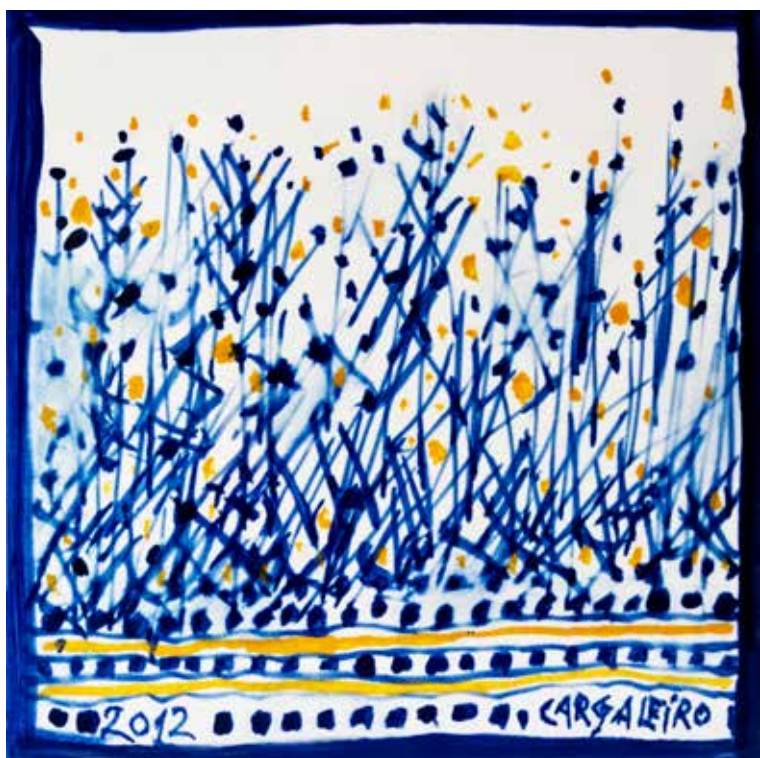
18. Placa cerâmica 14 x 14 cm, 2012