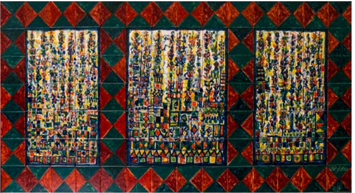
28. Painel de azulejos, 98 x 196 cm, 2015