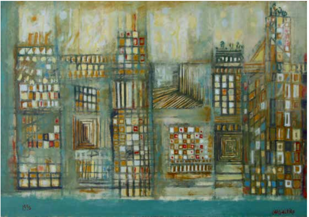
46. Vesailles II, Óleo s/ tela, 61 x 46 cm, 1990