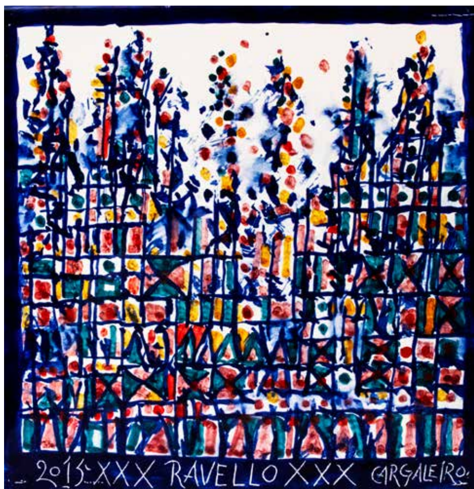
6. Placa cerâmica, 30 x 30 cm, 2015