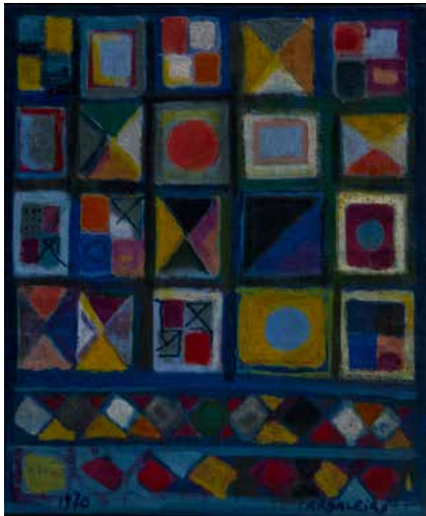
47. La petite exposition geometrique, Óleo s/ tela, 26,5 x 21 cm, 1970