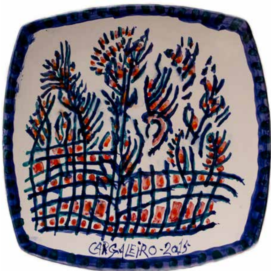
24. Prato, 26 x 26 cm, 2015