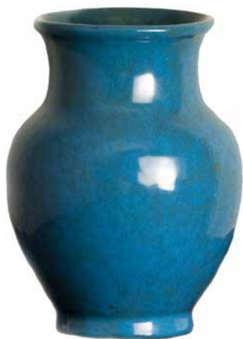
44. Jarra, 1998