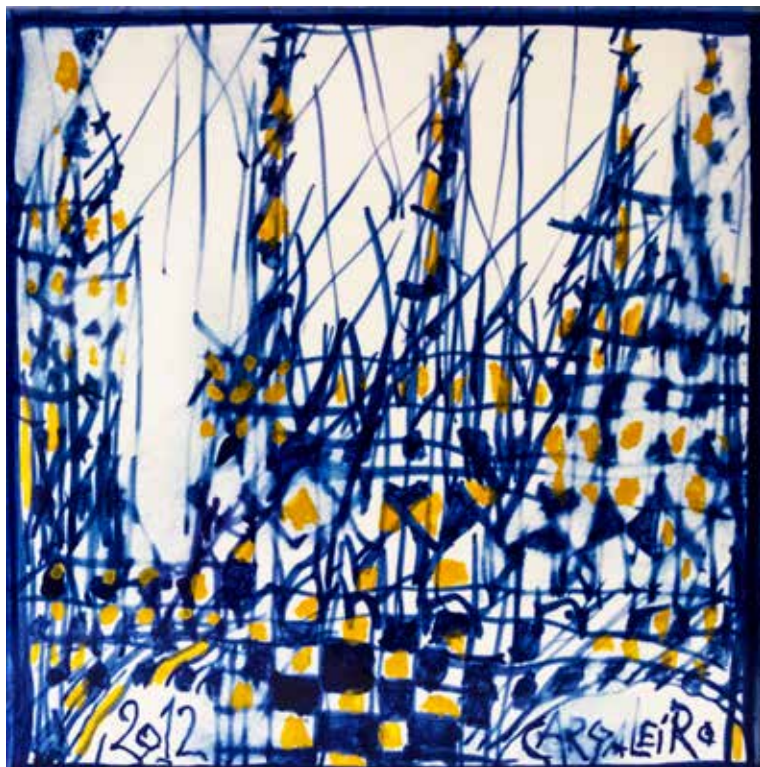
17. Placa cerâmica 14 x 14 cm, 2012