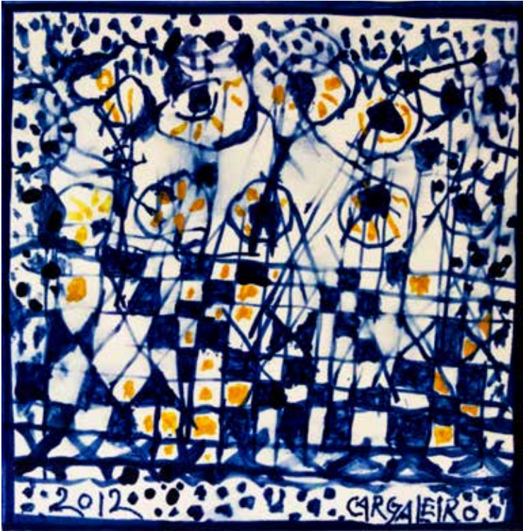
21. Placa cerâmica 14 x 14 cm, 2012