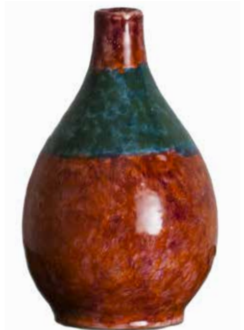
41. Jarra, 2015