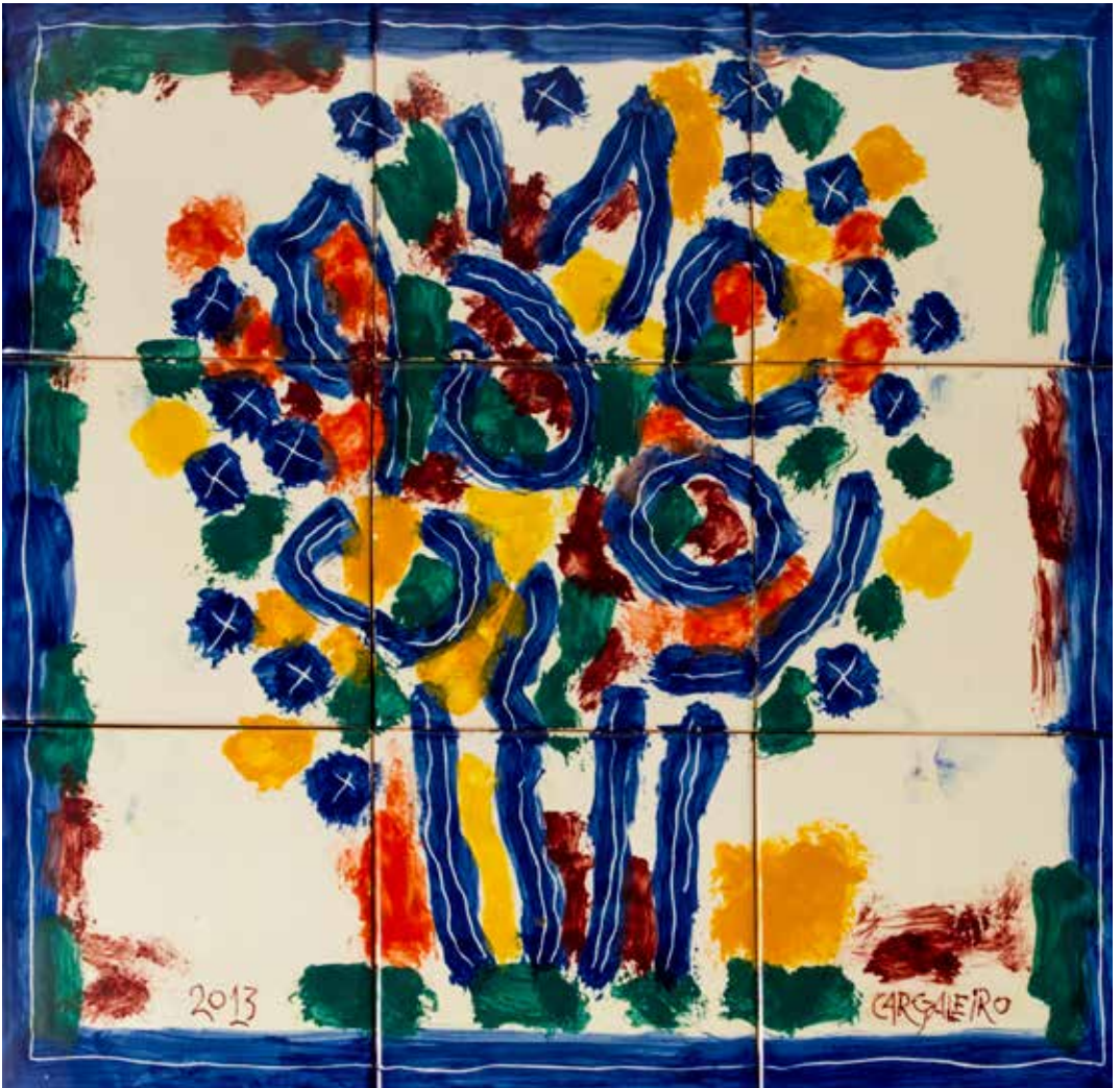
25. Painel de azulejos, 42 x 42 cm, 2013