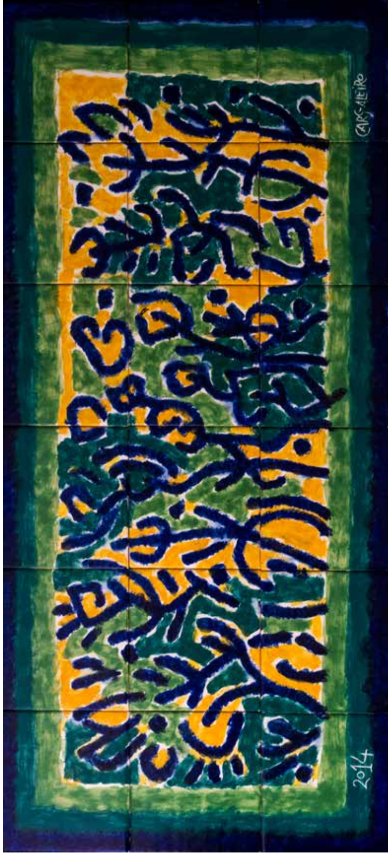
27. Painel de azulejos, 42 x 84 cm, 2014