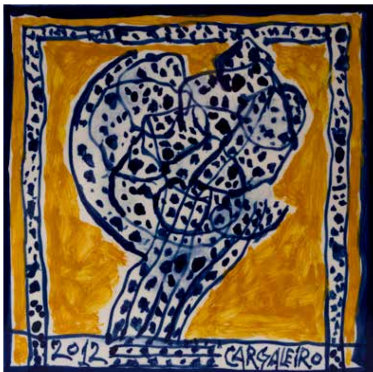
14. Placa cerâmica 14 x 14 cm, 2012