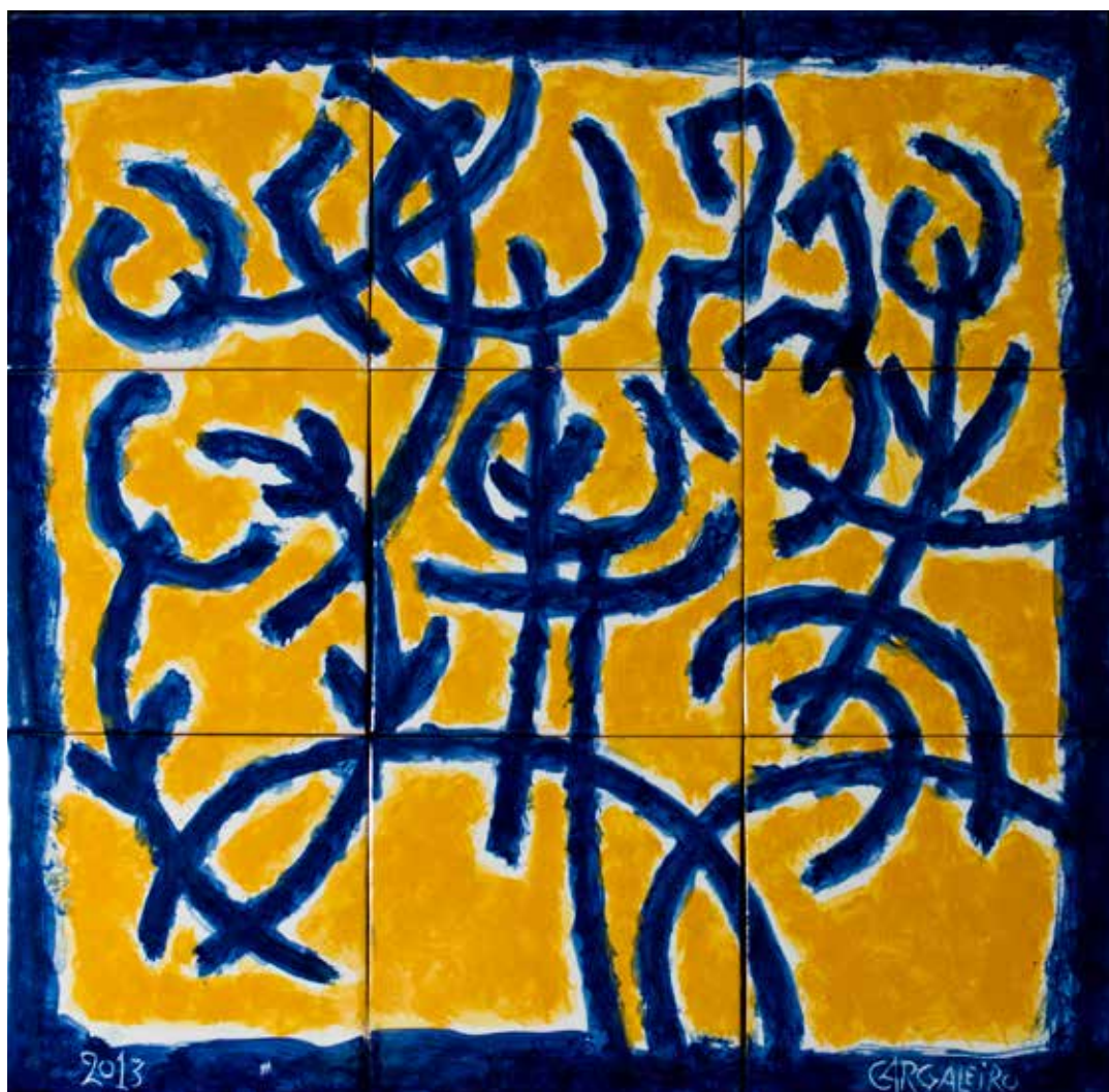
26. Painel de azulejos, 42 x 42 cm, 2013