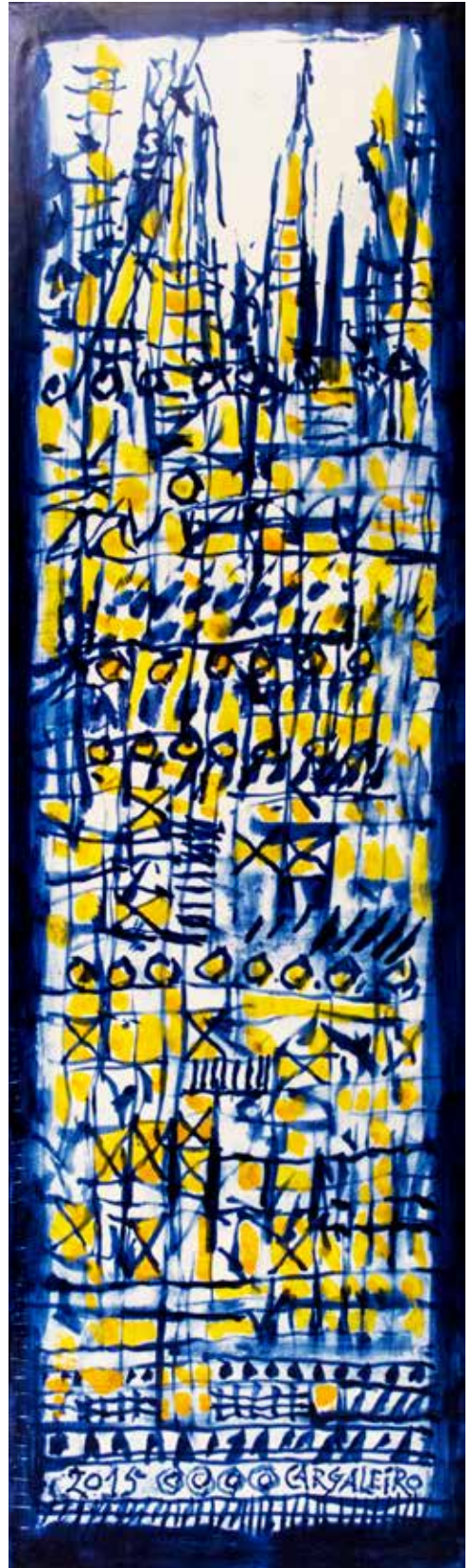
3. Placa cerâmica, 48 x 14 cm, 2015