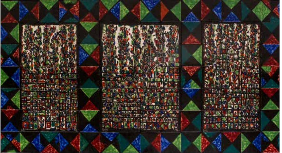
29. Painel de azulejos, 98 x 196 cm, 2015