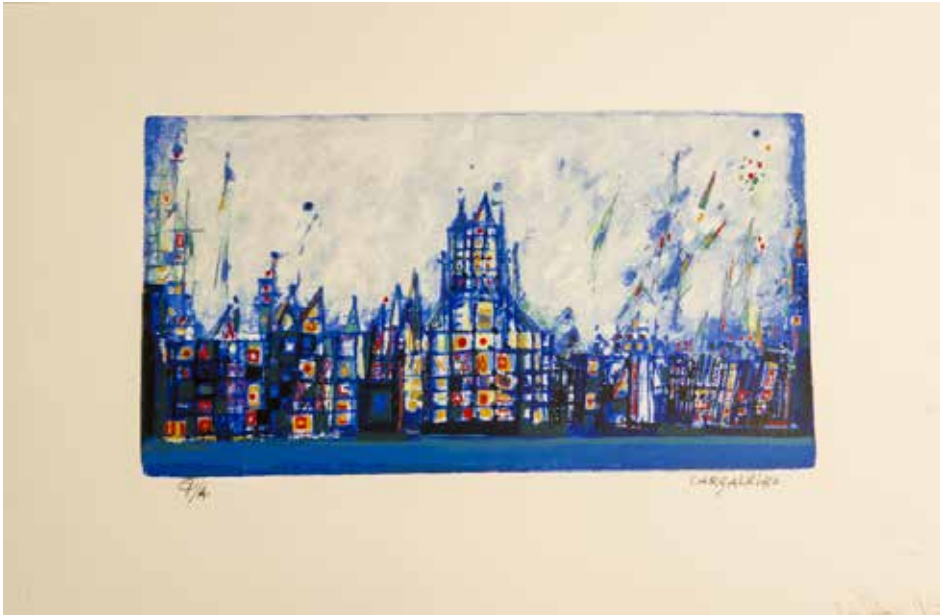
51. Ville Ancienne, 2002 Seragrafia, P/A, Papel Fabriano, 38 x 56 cm