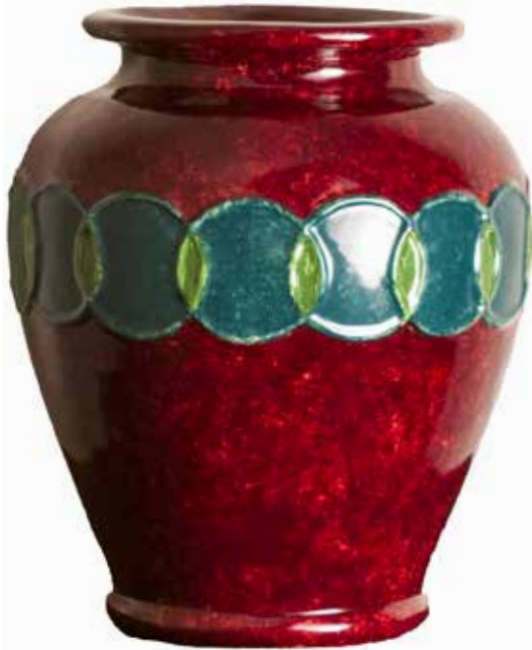
42. Jarra, 1997