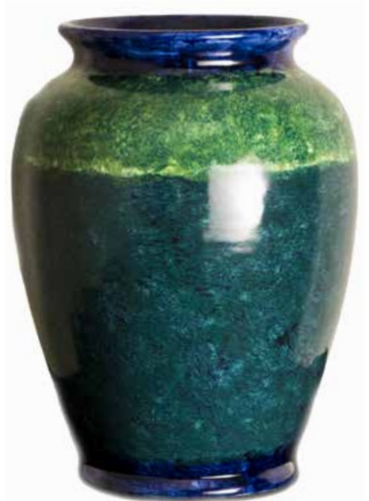
39. Jarra, 2014