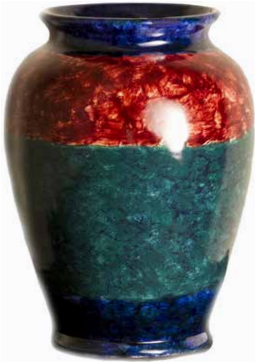
38. Jarra, 2014