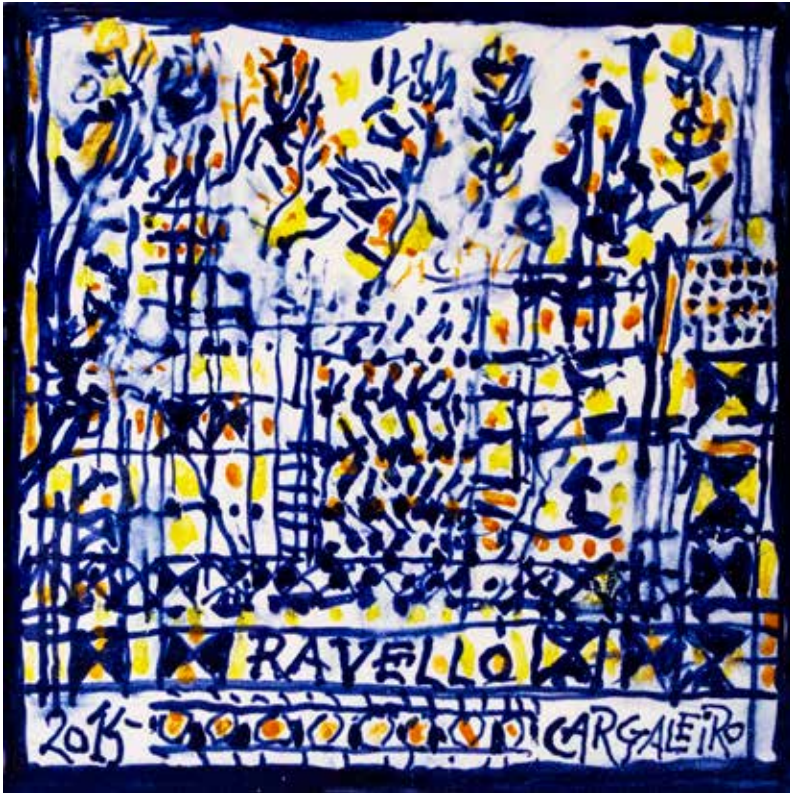
23. Placa cerâmica, 15 x 15 cm, 2015