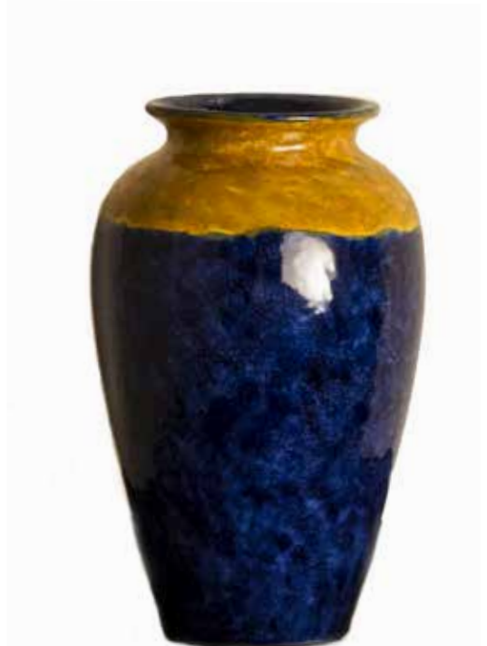
43. Jarra, 2015