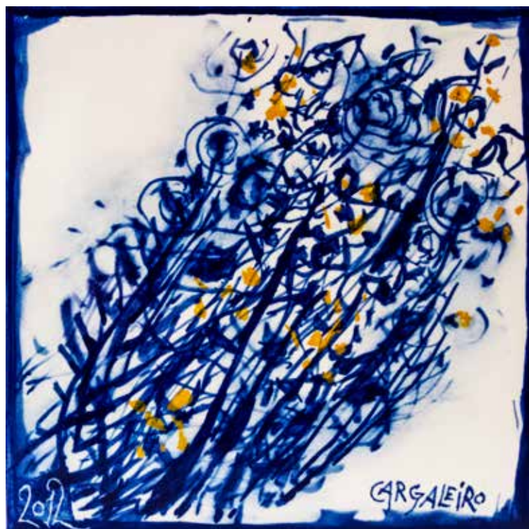
20. Placa cerâmica 14 x 14 cm, 2012