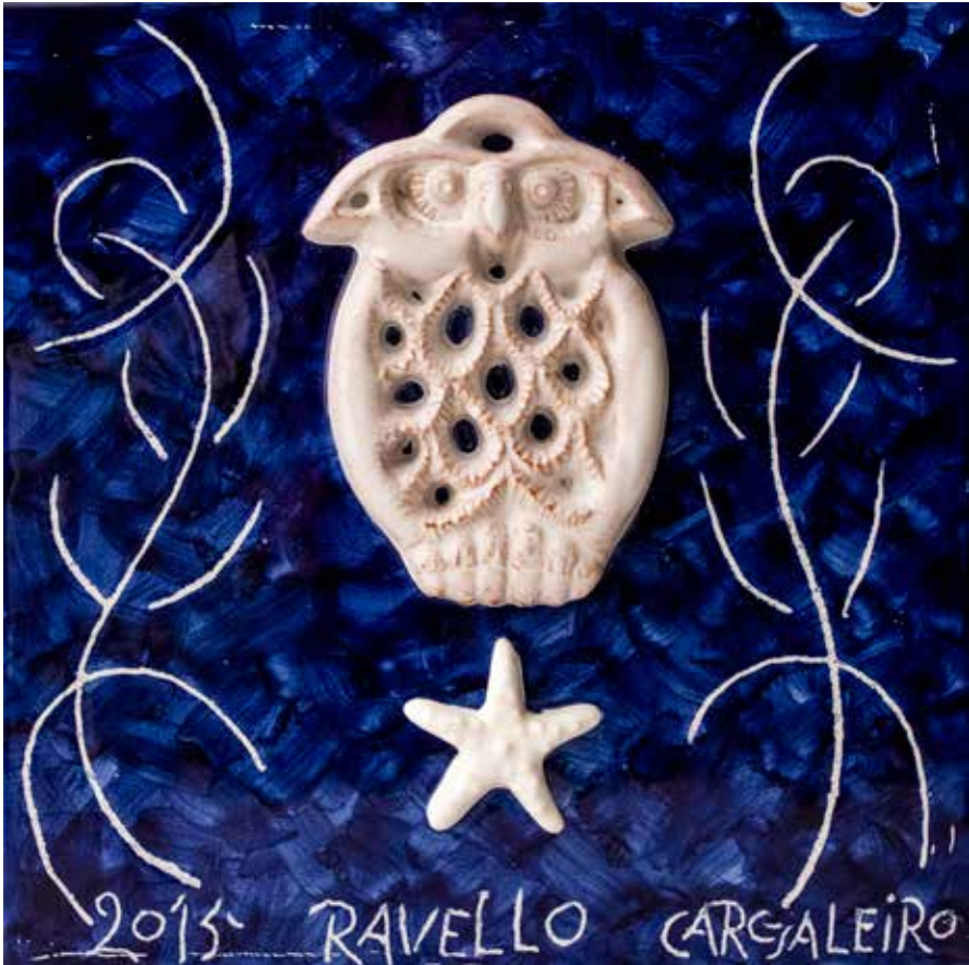
12. Placa cerâmica, 20 x 20 cm, 2015