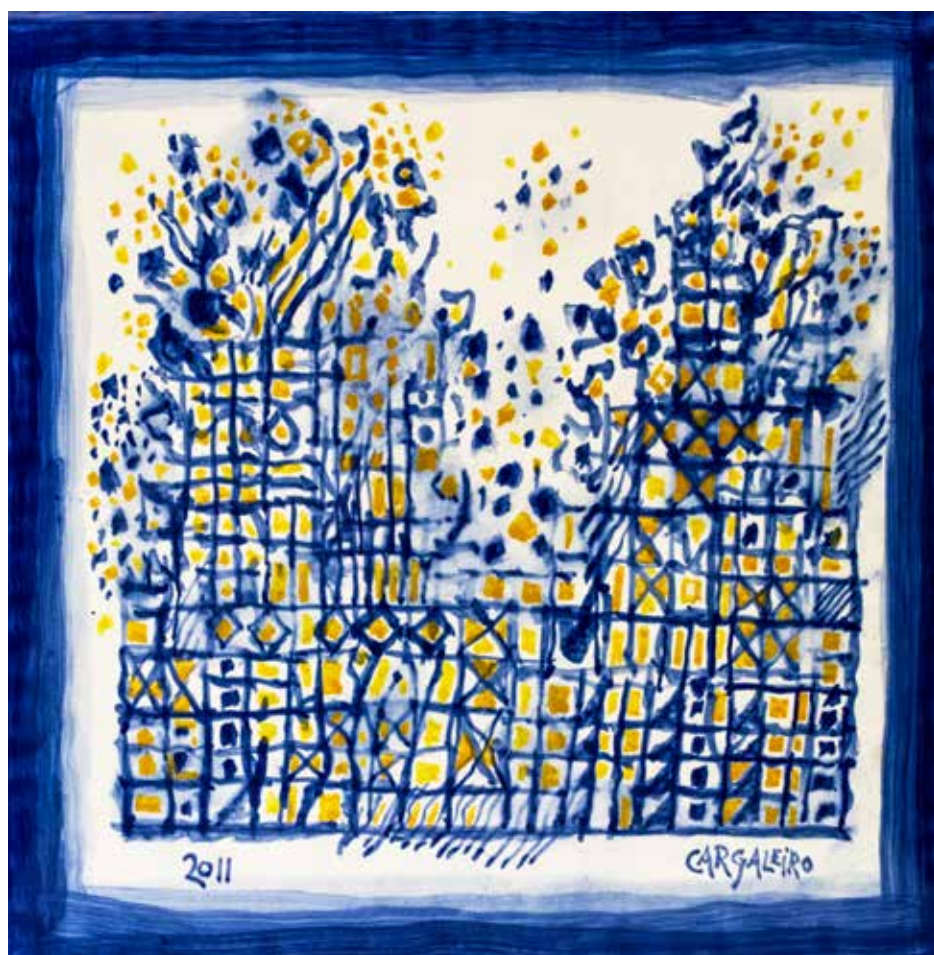
7. Placa cerâmica, 30 x 30 cm, 2011