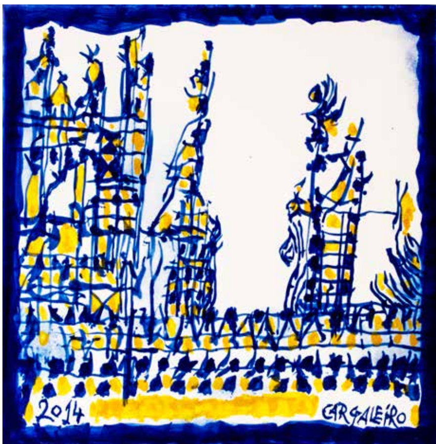
10. Placa cerâmica, 20 x 20 cm, 2014