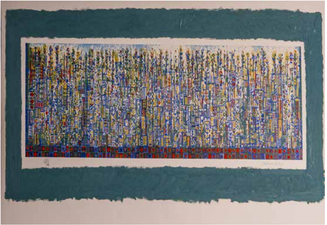
48. Amadora, 2009 Rehaussée, P/A, Papel Fabriano, 50,4 x 99,9 cm