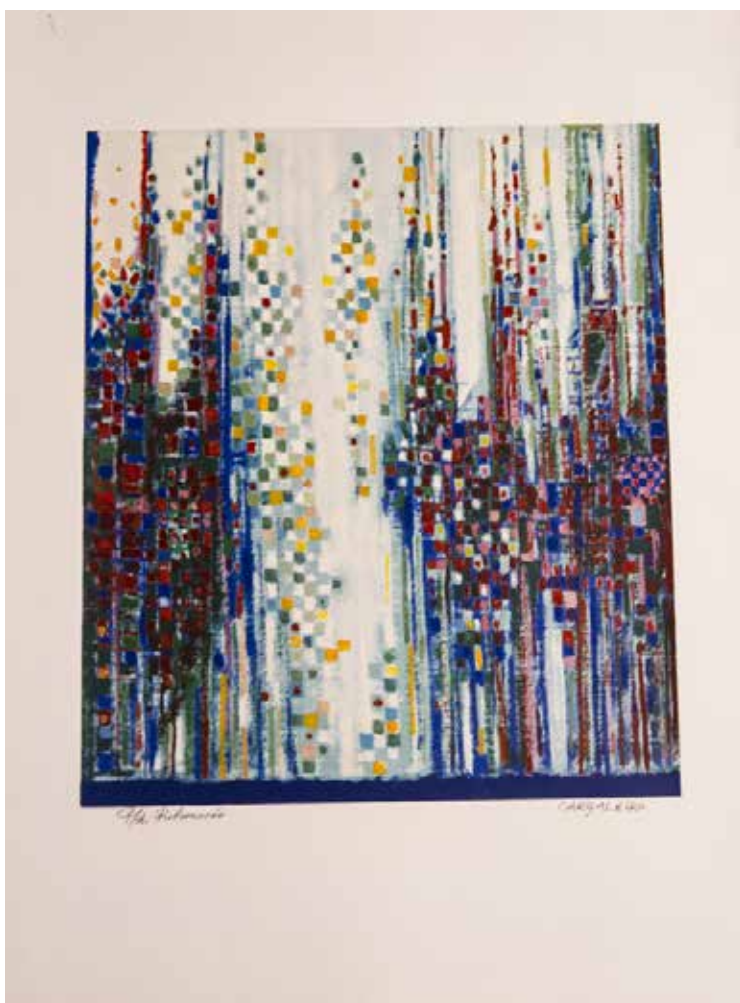
49. Cidade Suspensa, 1996 Rehaussée, P/A, Papel Guarro, 70 x 50 cm