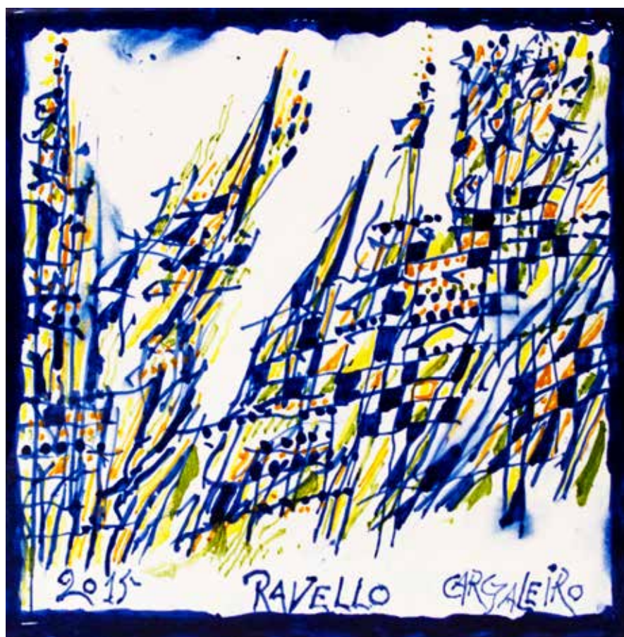
9. Placa cerâmica, 20 x 20 cm, 2015