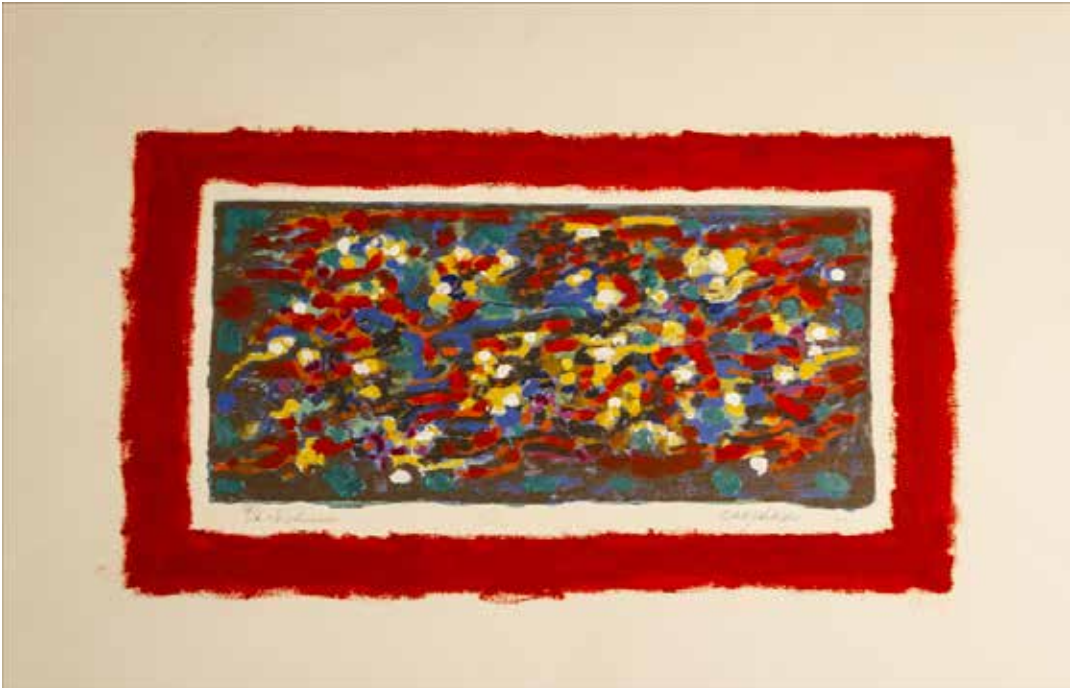
50. Les secrets de la montagne, 1992 Rehaussée, P/A, Papel Arches, 51,5 x 73 cm