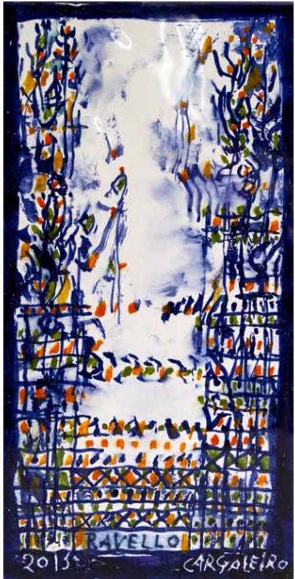
5. Placa cerâmica, 30 x 15 cm, 2015