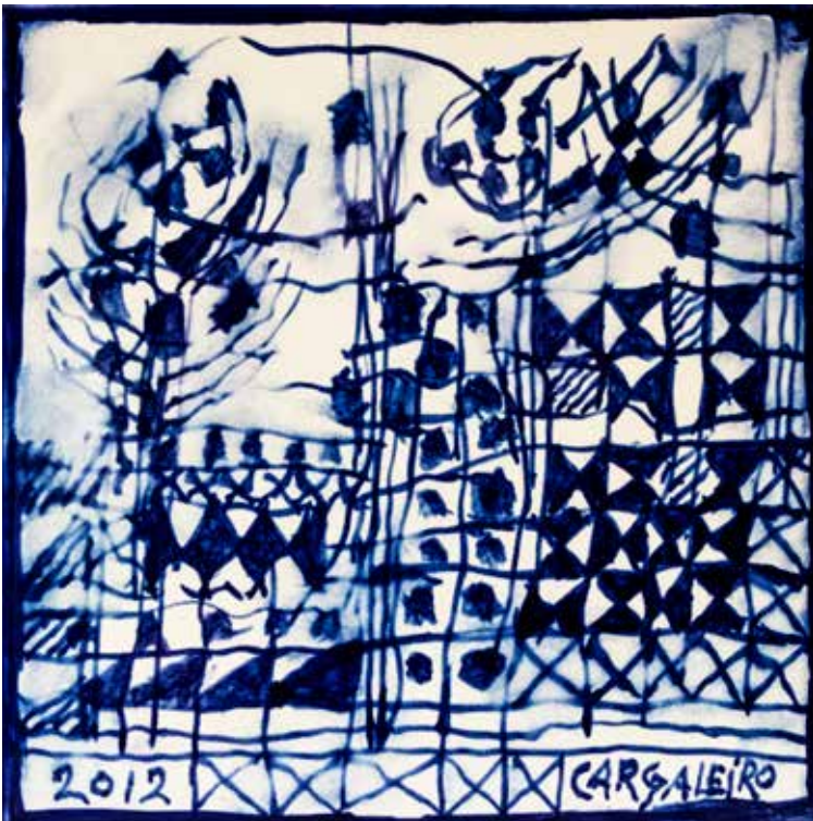
22. Placa cerâmica 14 x 14 cm, 2012