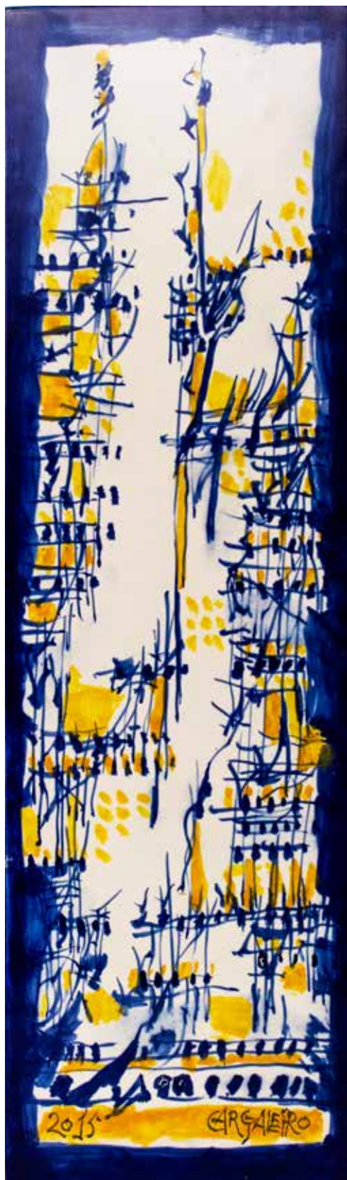
2. Placa cerâmica, 48 x 14 cm, 2015