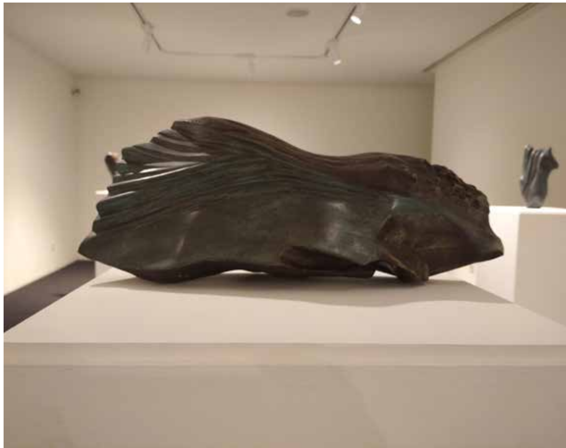
09. "De pedra e bronze" Bronze, 18x42x7 cm