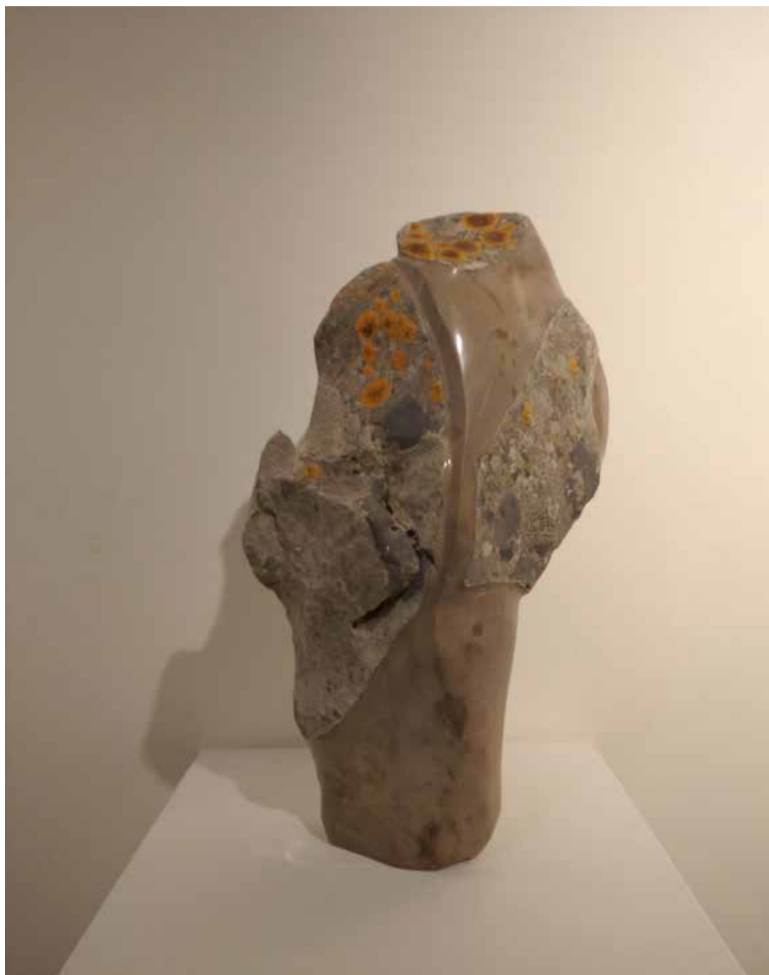
02. "De pedra e bronze" Calcário da Serra D'Aire, 45x12x7 cm