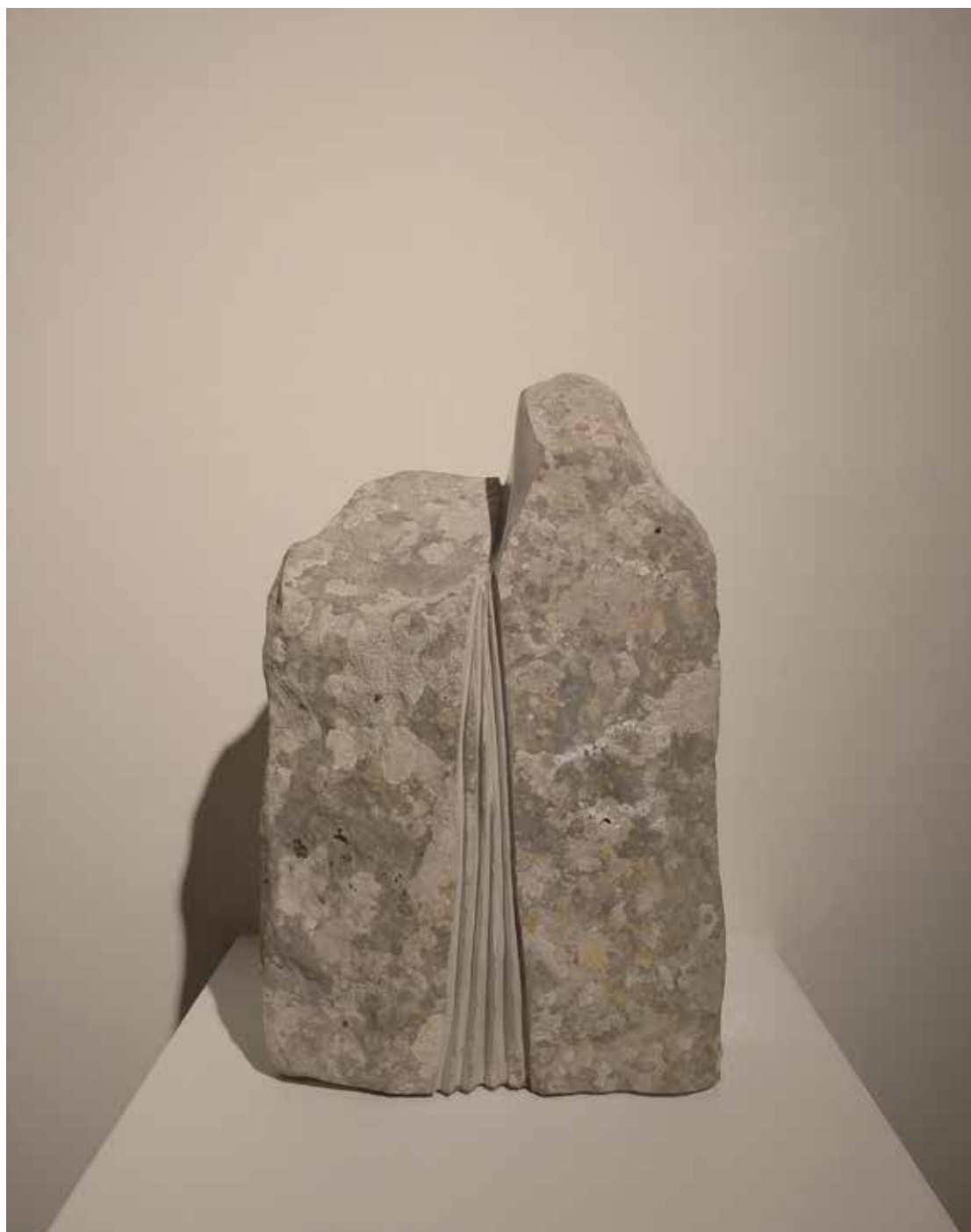
01. “De pedra e bronze” Calcário da Serra D’Aire, 40x25x8 cm