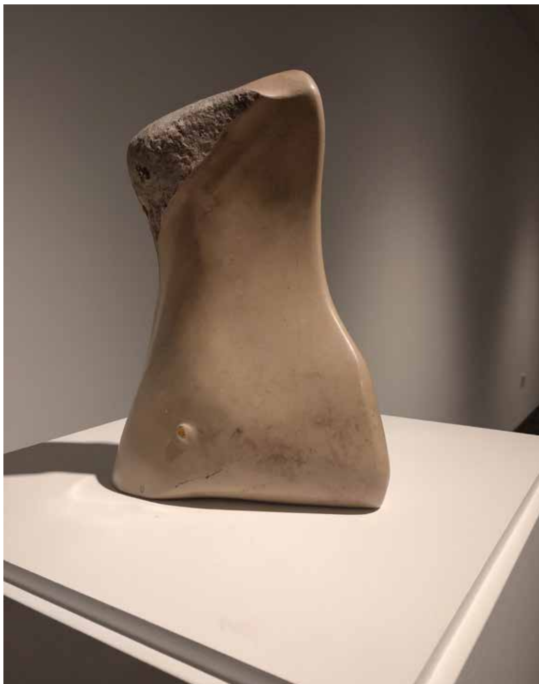
04. "De pedra e bronze" Calcário da Serra D'Aire, 29x20x8 cm