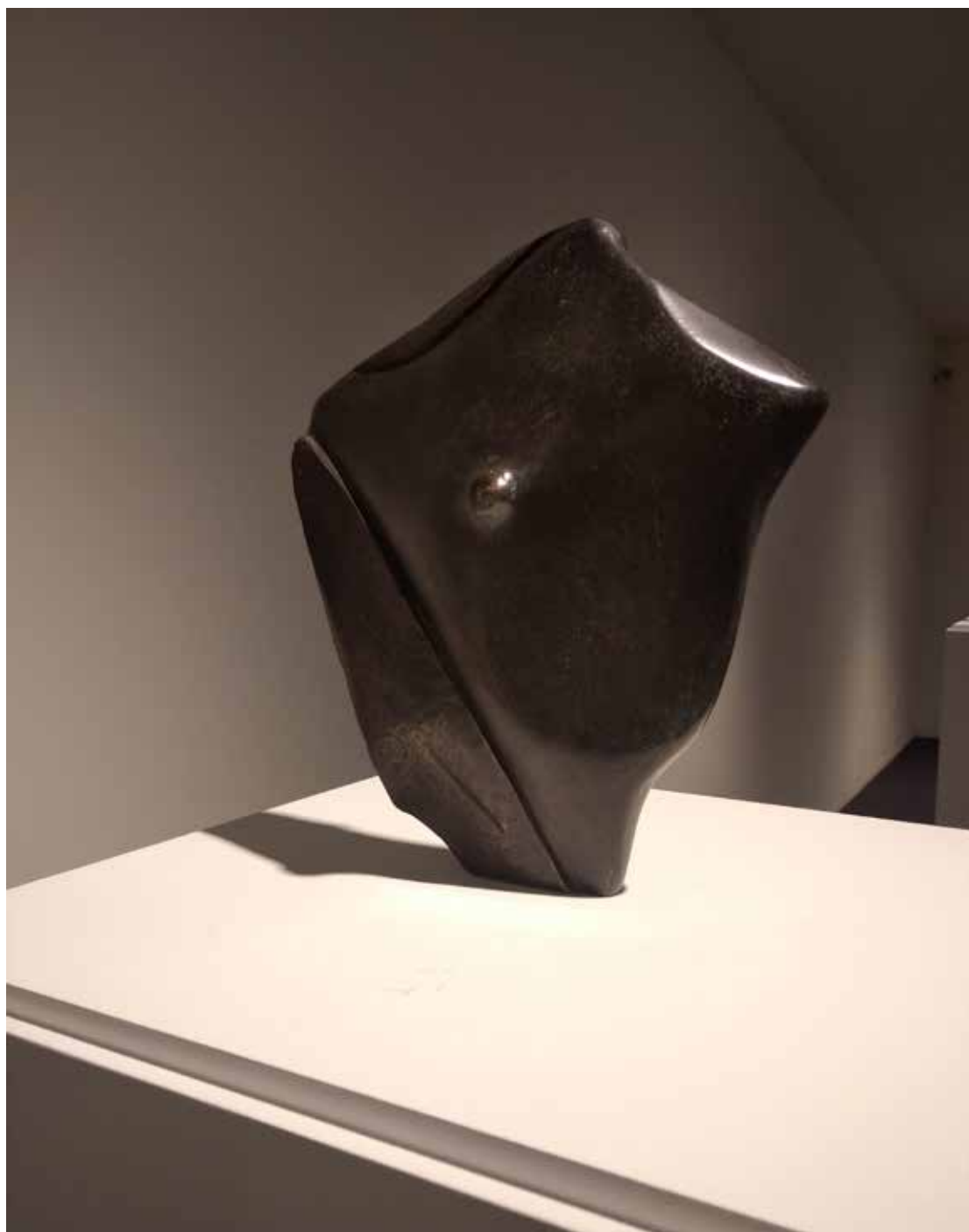
08. "De pedra e bronze" Bronze, 29x26x4 cm