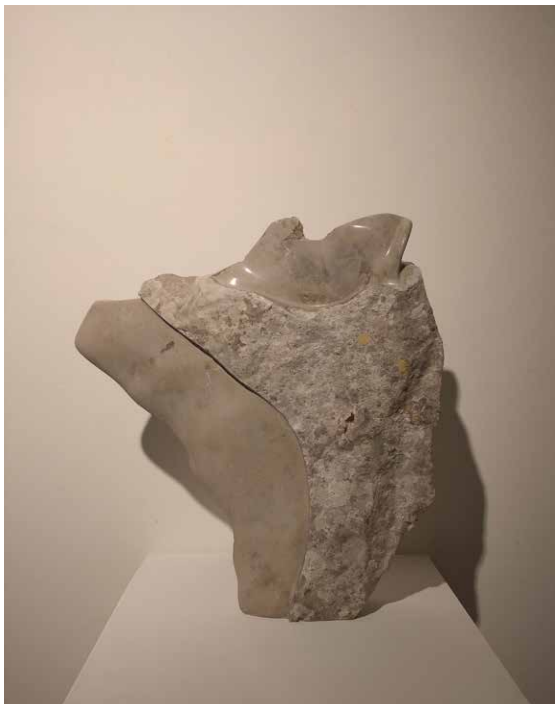
03. "De pedra e bronze" Calcário da Serra D'Aire, 42x12x7 cm