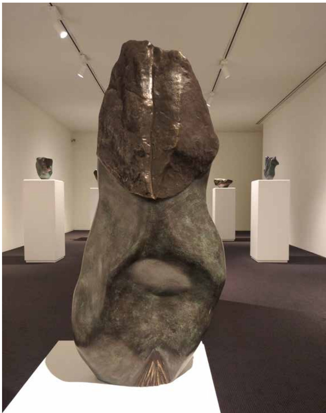
07. "De pedra e bronze" Bronze, 70x30x9 cm