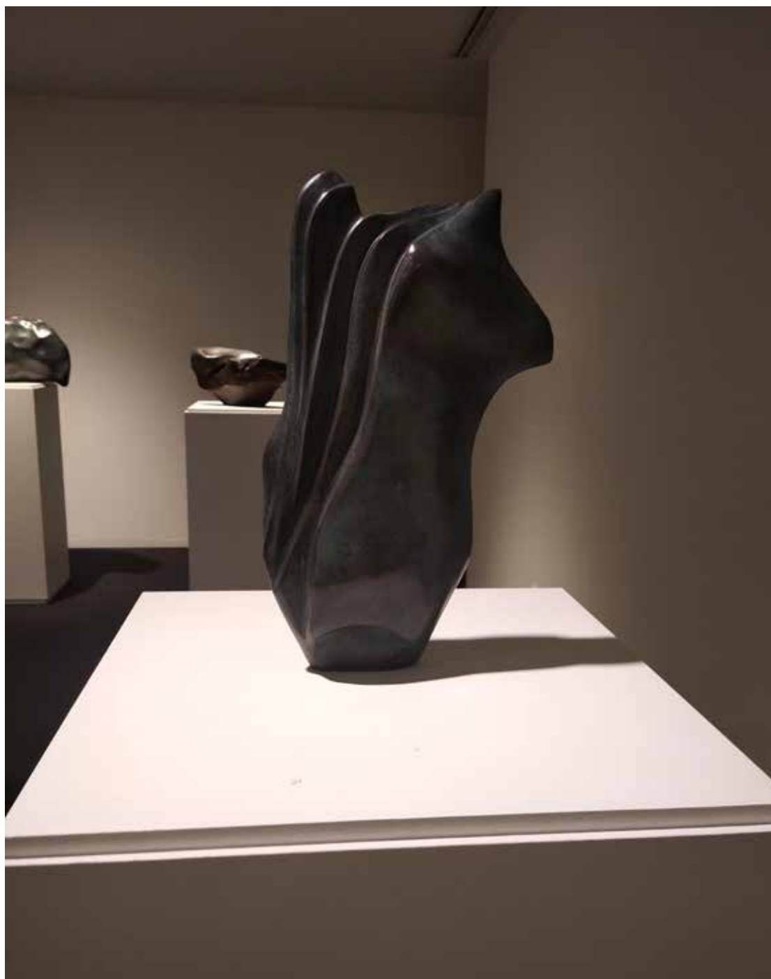
12. "De pedra e bronze" Bronze, 34x19x5 cm