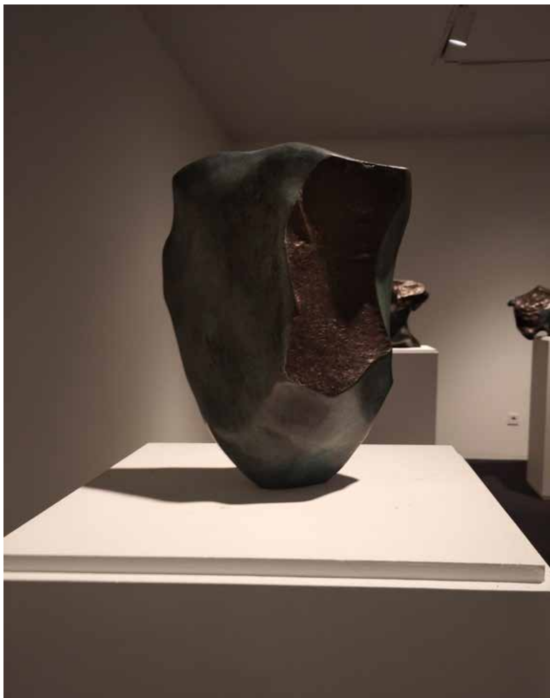
10. "De pedra e bronze" Bronze, 33x28x9 cm