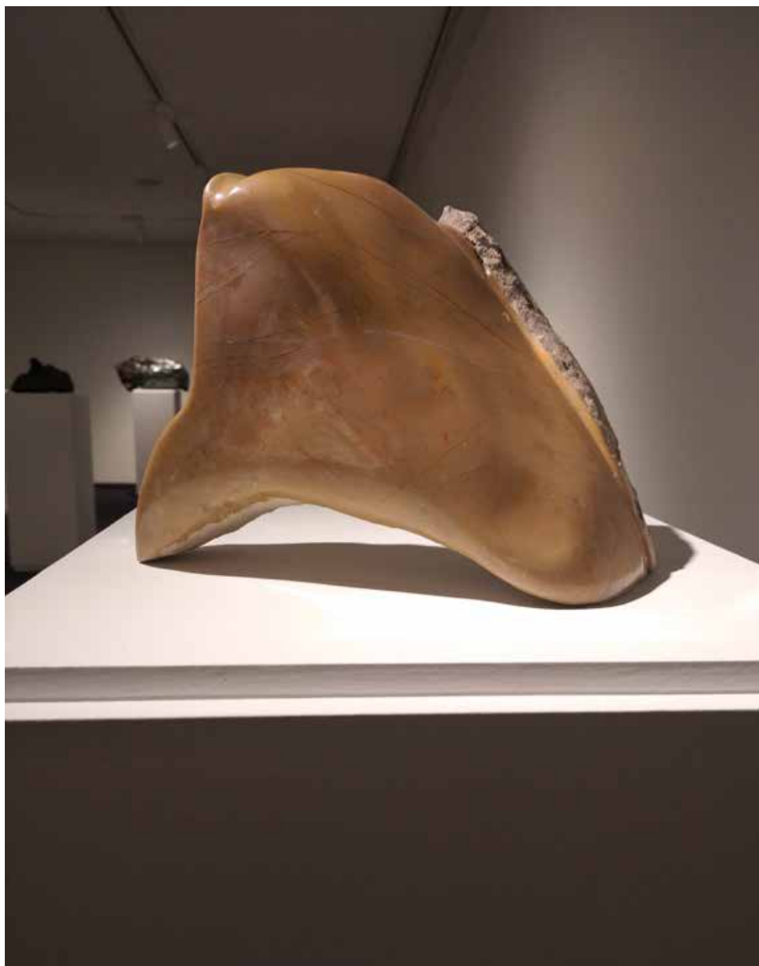
05. "De pedra e bronze" Calcário da Serra D'Aire, 19x30x15 cm