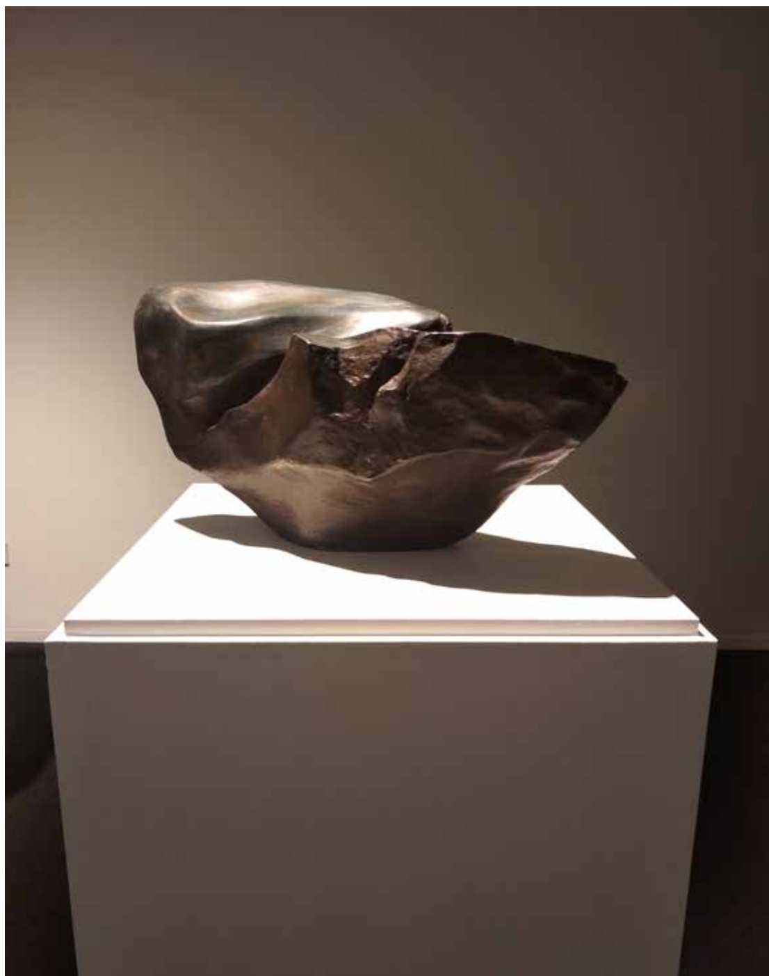
13. "De pedra e bronze" Bronze, 20x39x15 cm