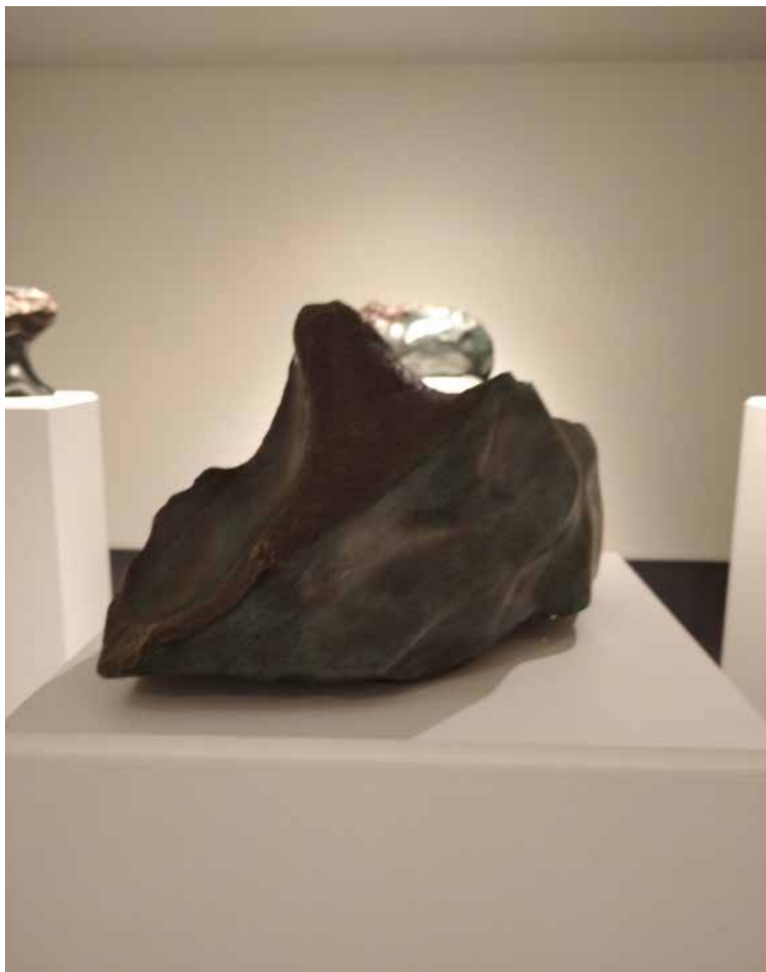
11. "De pedra e bronze" Bronze, 44x20x15 cm