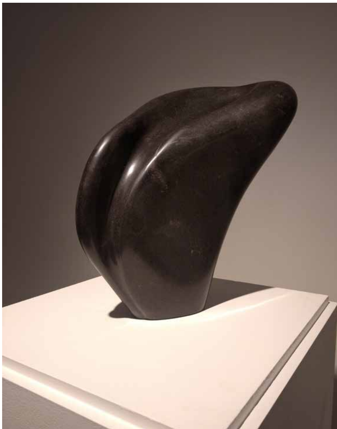
06. "De pedra e bronze" Basalto de Rio Maior, 30x15x7 cm