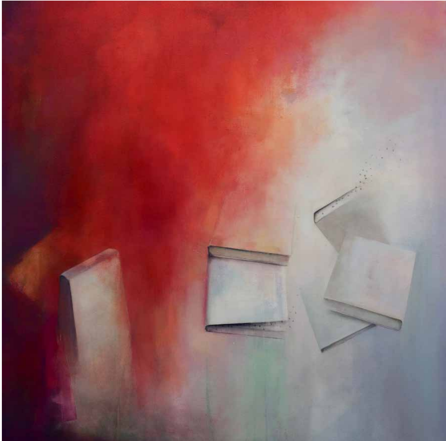
Palabras al viento Técnica mista sobre tela, 92x92 cm