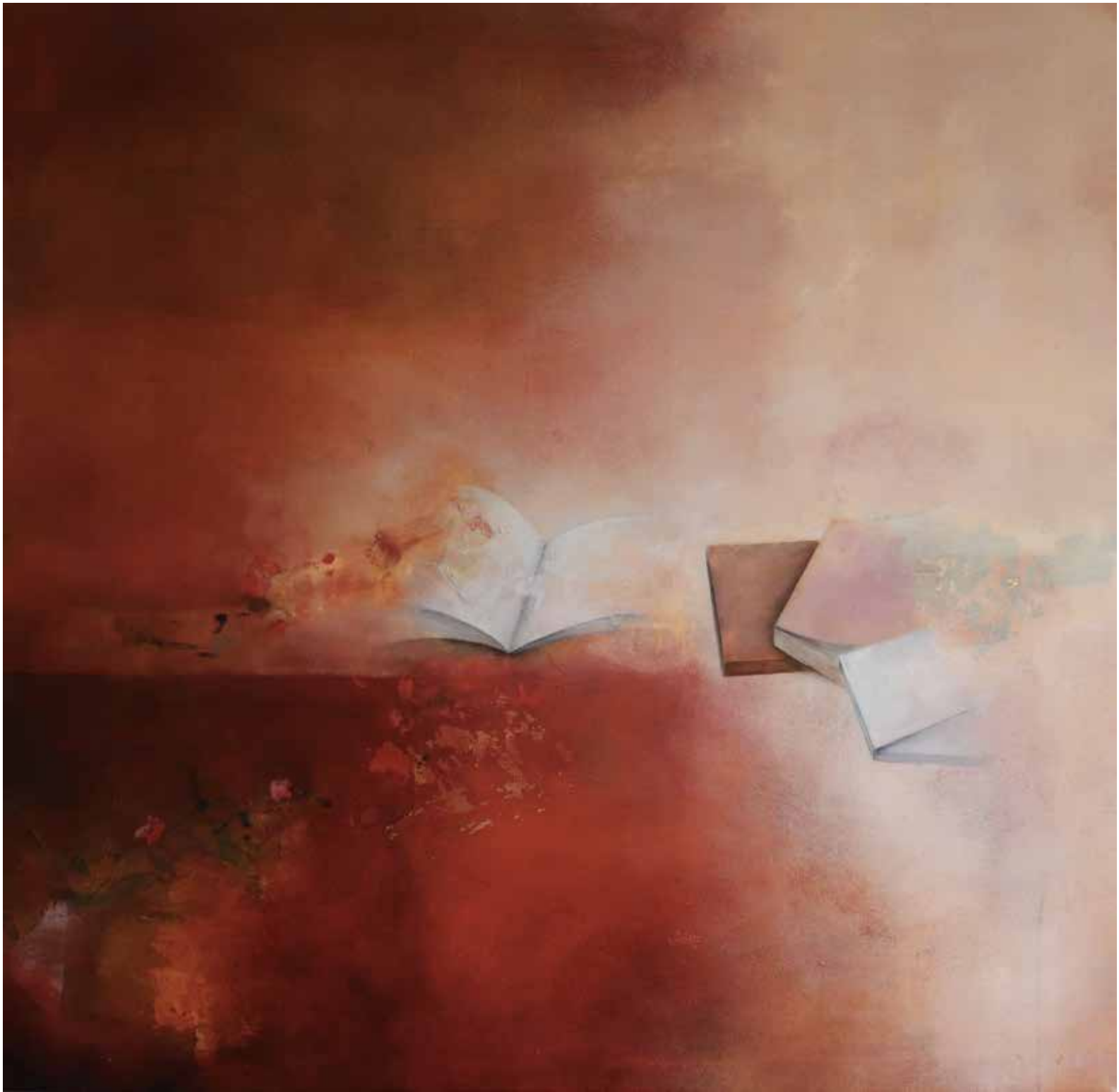
La soledad de las letras Técnica mista sobre tela, 98x100 cm