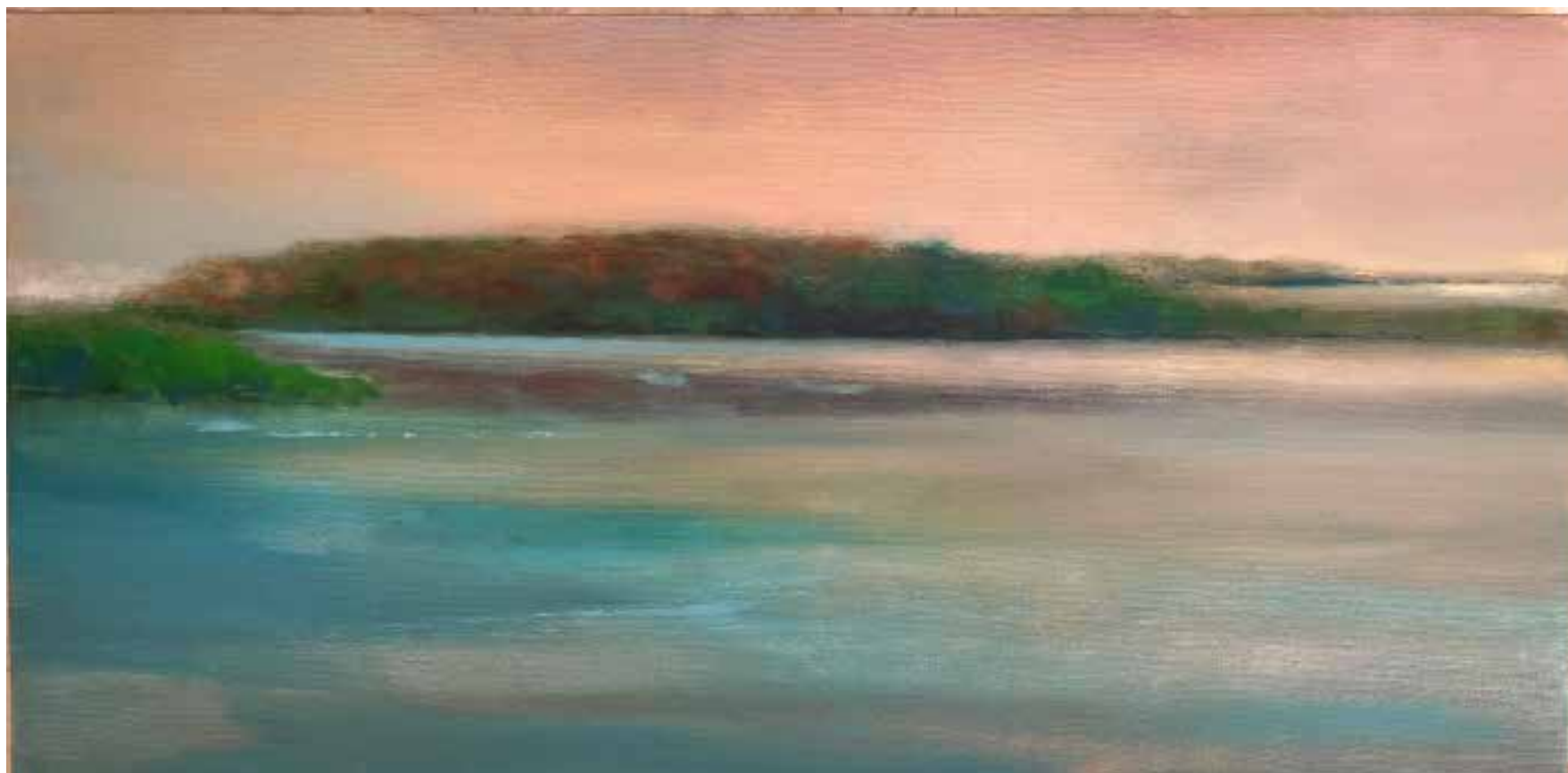
Isla Verde Técnica mista sobre tela, 40x80 cm