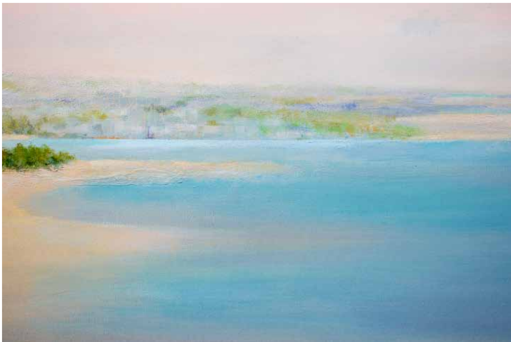
Calima Técnica mista sobre tela, 80x120 cm