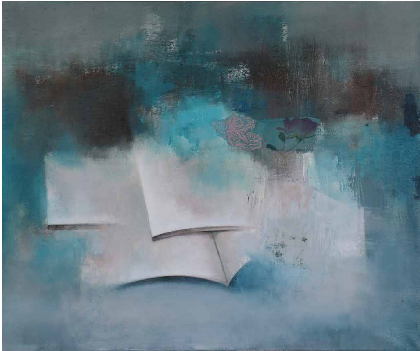
Lluvia azul Técnica mista sobre tela, 54x65 cm