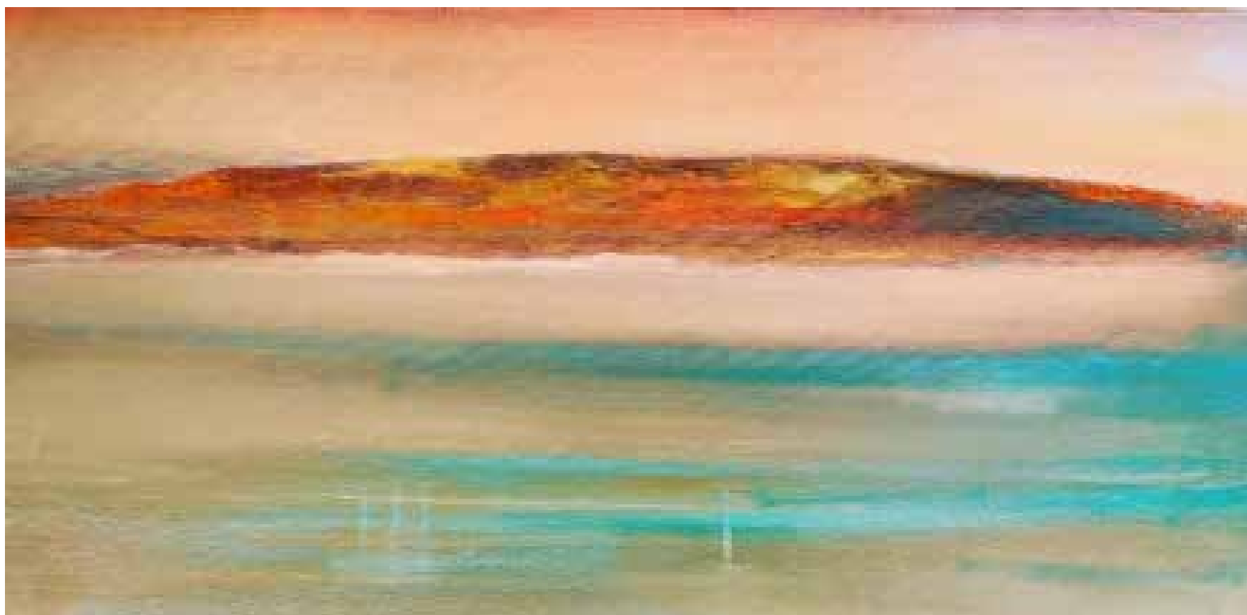
Isla Roja Técnica mista sobre tela, 40x80 cm