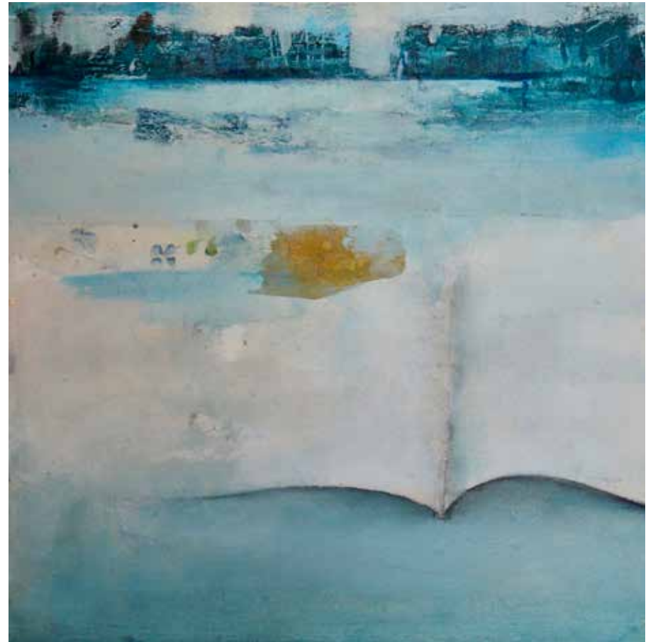
Serie Atlântico I e II Técnica mista sobre tela, 30x30 cm