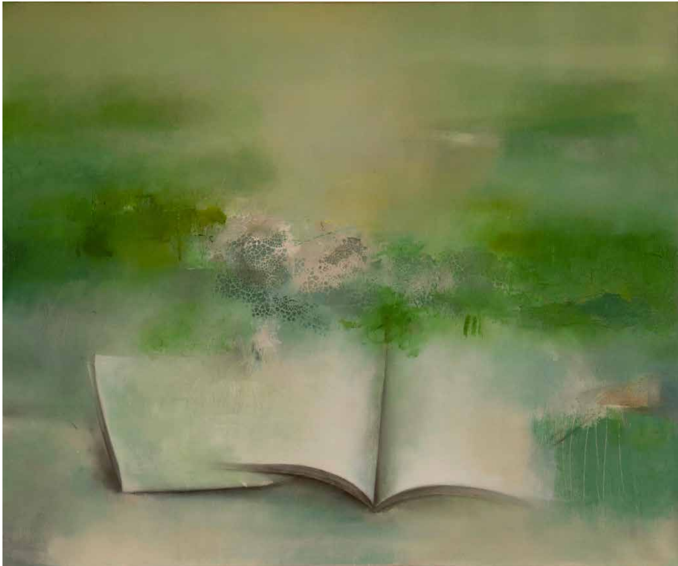
Paysage y Cultura Técnica mista sobre tela, 54x65 cm