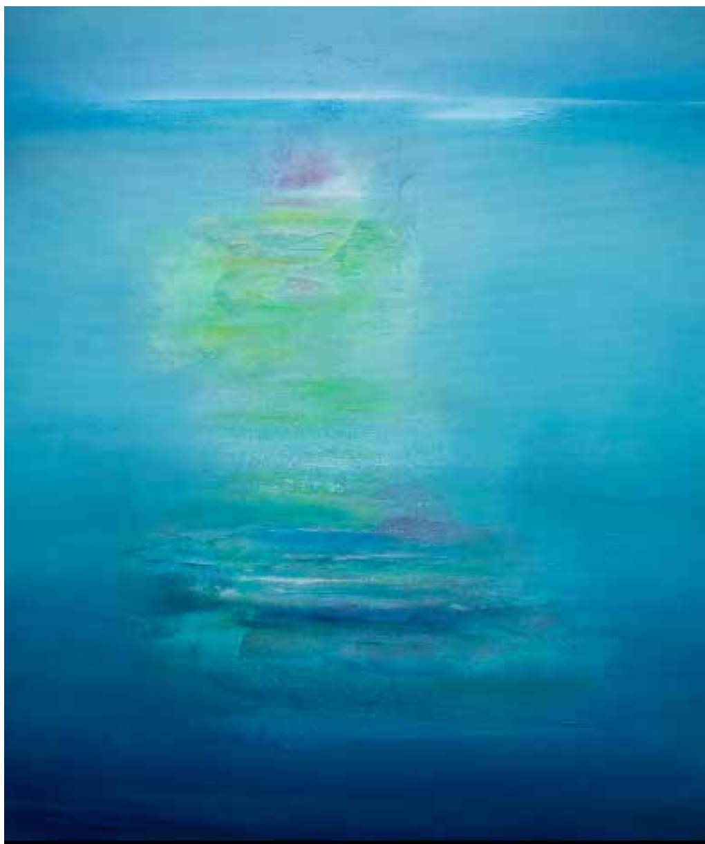
Mera Técnica mista sobre tela, 81x65 cm