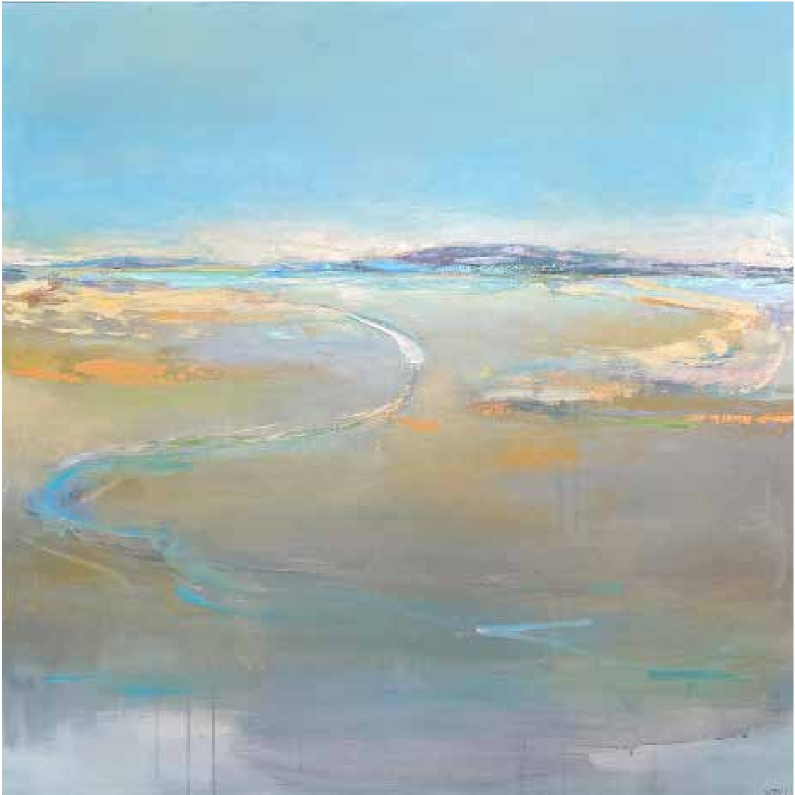
Isla Técnica mista sobre tela, 120x120 cm