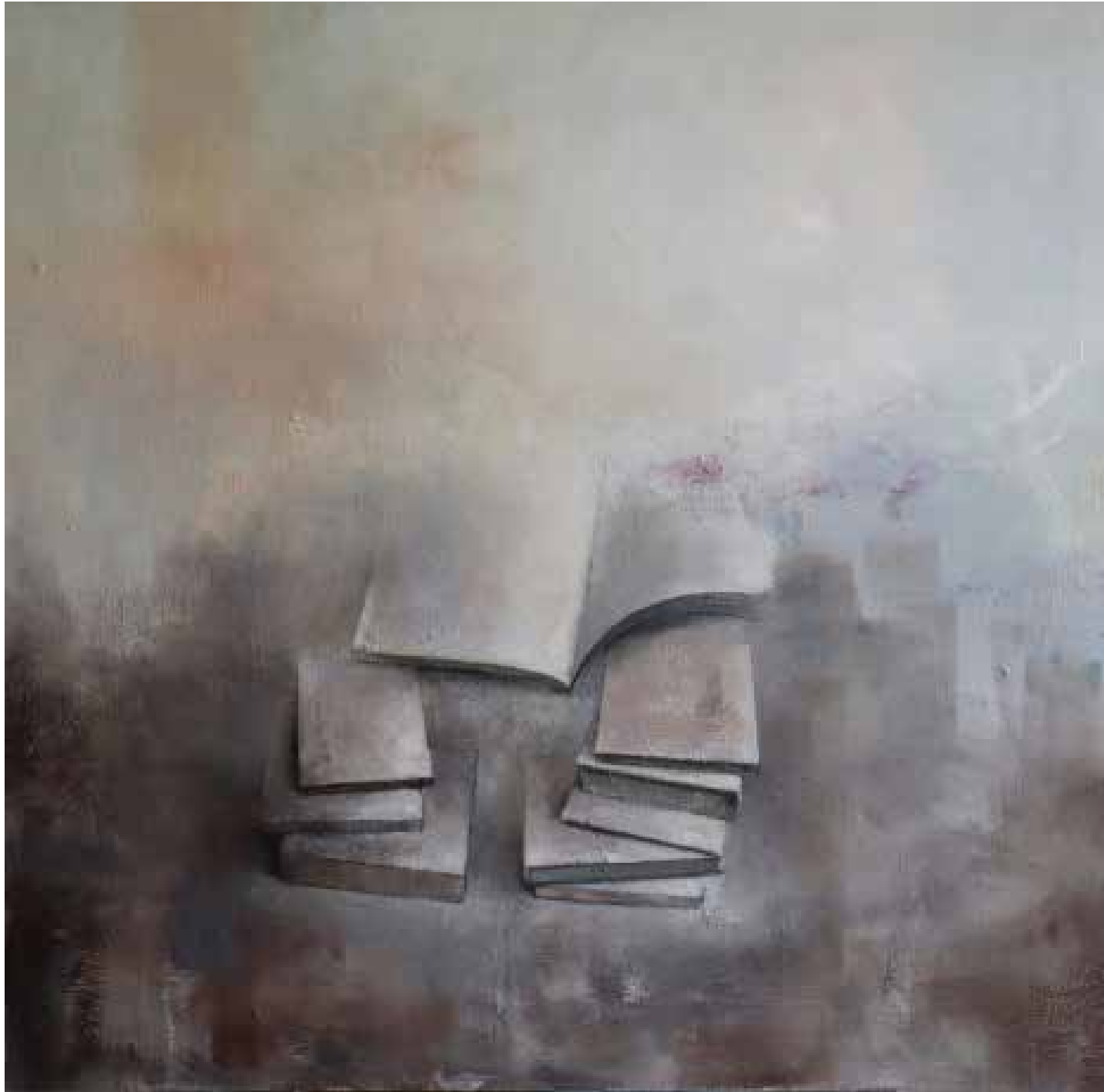
Babel Técnica mista sobre tela, 80x80 cm