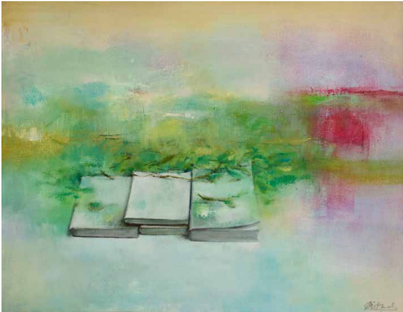
Las Horas Técnica mista sobre tela, 50x65 cm