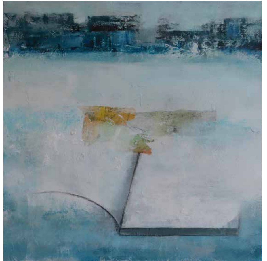
Serie Atlântico III e IV Técnica mista sobre tela, 30x30 cm