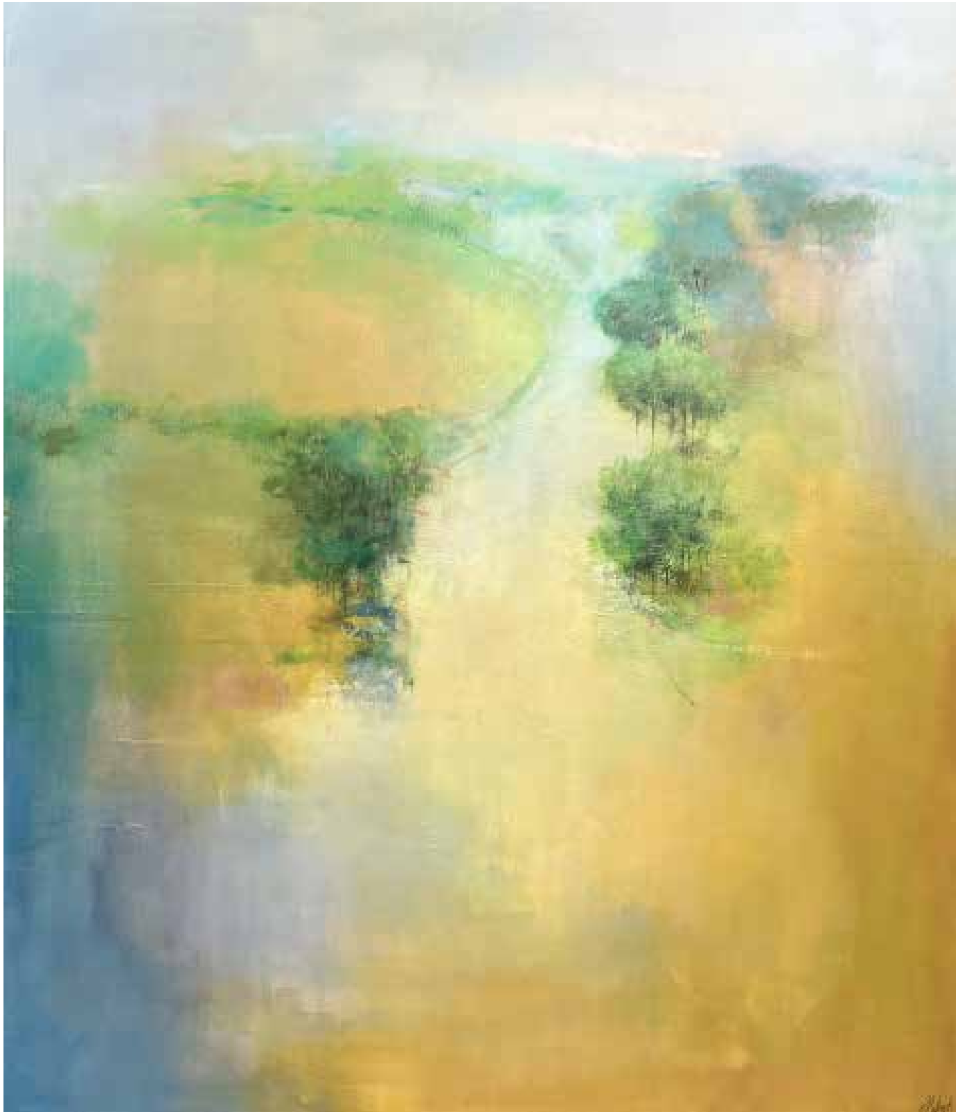
Luzada Técnica mista sobre tela, 116x100 cm