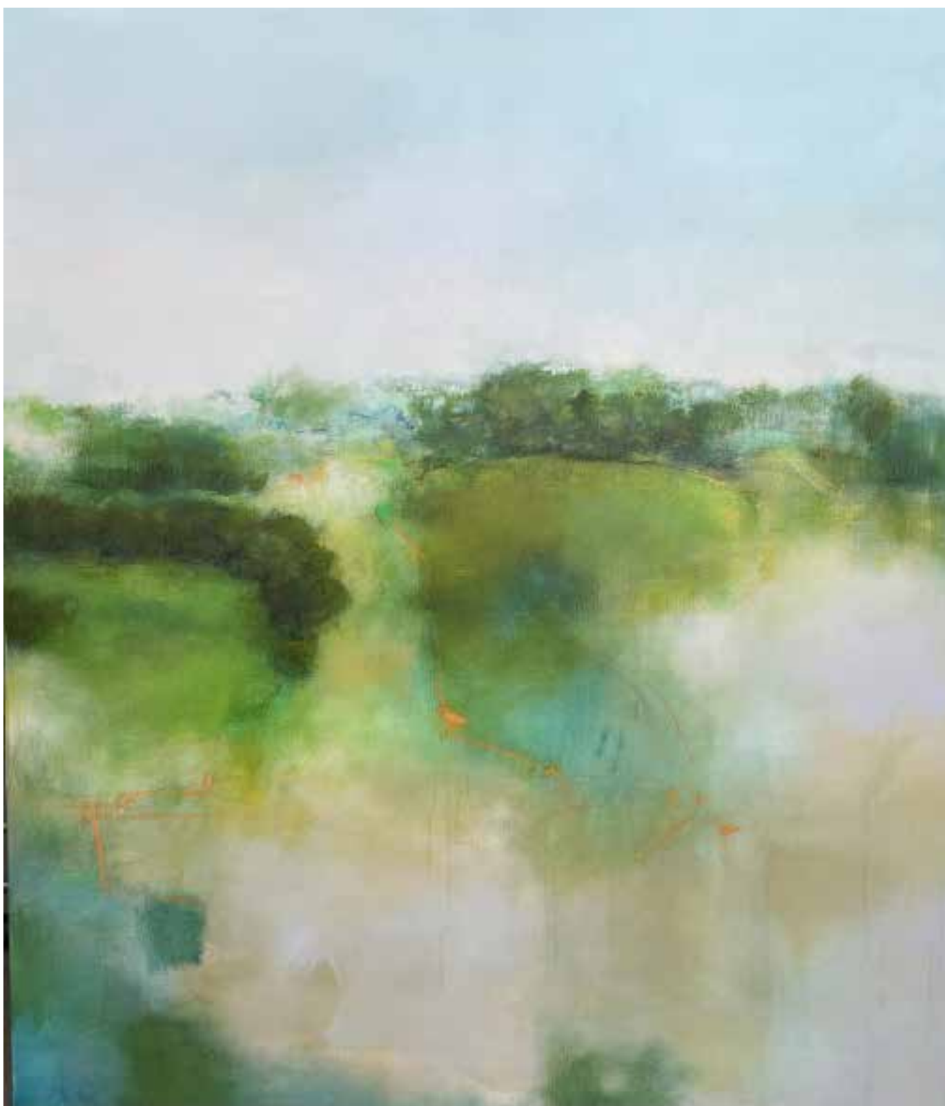
Cómaros verdes Técnica mista sobre tela, 116x100 cm